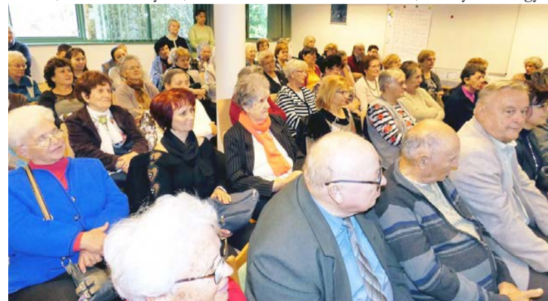
A kiadvány bemutatóját november 5-én tartották Békéscsabán