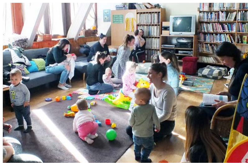
A legkisebbeket is várták a programsorozaton

Pénteken a legkisebbeket várunk a könyvtárba. A Baba-Mama Klub