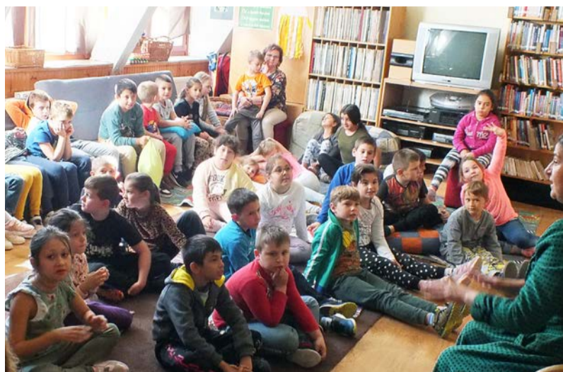
Mesetündék találkozója a könyvtárban

Ebben az évben már tizenhetedik alkalommal kerül sor az Országos Könyvtári Napok eseményeire. Esély, egyenlőség, könyvtár az idei év szlogenje. Esély arra, hogy az információhoz egyenlő módon mindenki hozzáférjen és ennek a legkézenfekvőbb tere nem más mint a könyvtár.