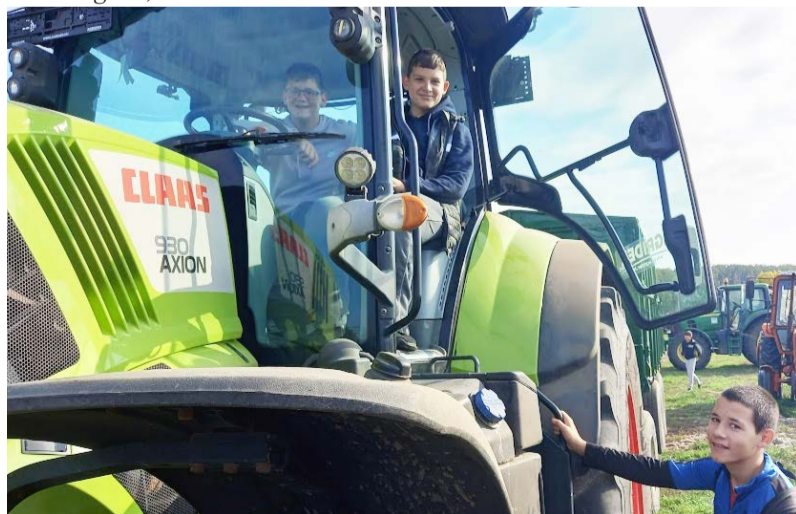
A tanulók több szakmával is megismerkedhettek