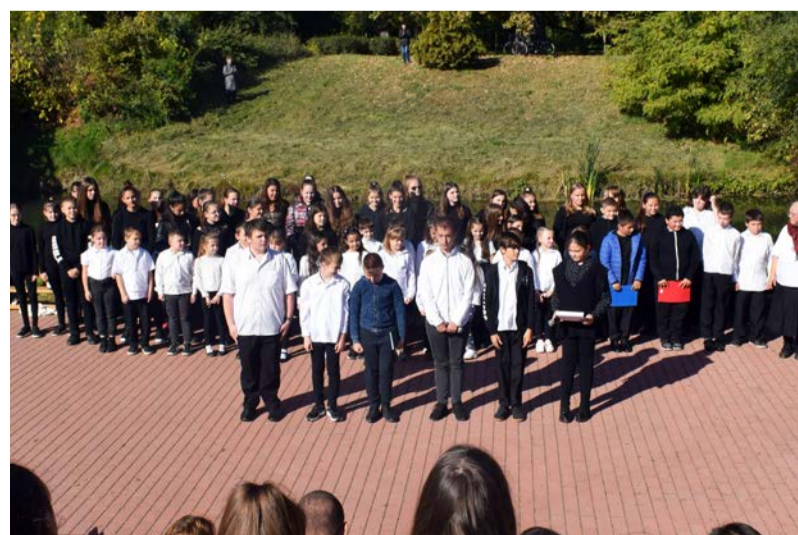
Ünnepi műsorról emlékeztek 1956 eseményeire

A műsor a felépítésével és tartalmával is azt igyekezett hangsúlyozni, hogy miért is