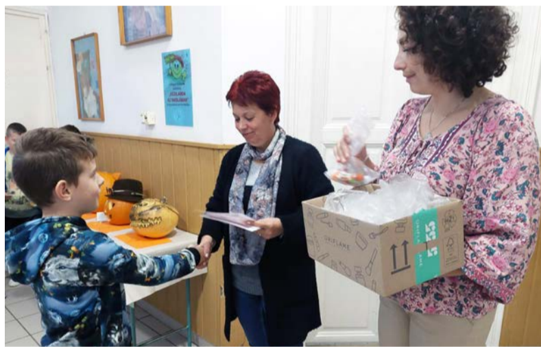
A gyerekek kreatív alkotásokkal készültek a versenyre

Újra eljött a szellemek és boszorkányok ideje, legalábbis a Halloween ünnep szerint, amely az ősi kelta hagyományokból alakult ki. Bár elsősorban az angolszász országokban tartják nyilván a Halloween éjszakáját, mára már szinte az egész világon elterjedt.