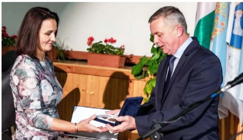
Civilek Dobozerért Díját vehette át a Magyar Vöröskereszt Békés Megyei szervezetének Dobozi Alapszervezete

Később felvételt nyert a BME-re az Építésztechnika Karra. Már itt is foglalkoztatta a közösségi élet, így sikerült a Senior Kör tagjává válni, ami az elsőévesek integrálásával és mentorálásával foglalkozik. A későbbiek során az Építésztechnika Hallgatói Képviselői Mandátum tagjává is választották hallgatóságai, ahol 2022 februárja óta a Senior Kör-vezetői tisztséget tölti be, így az ő feladata a csapat koordinálása. Így Gólyatábor segédszervezőjévé, illetve a Gólyahét főszervezőjévé vált.