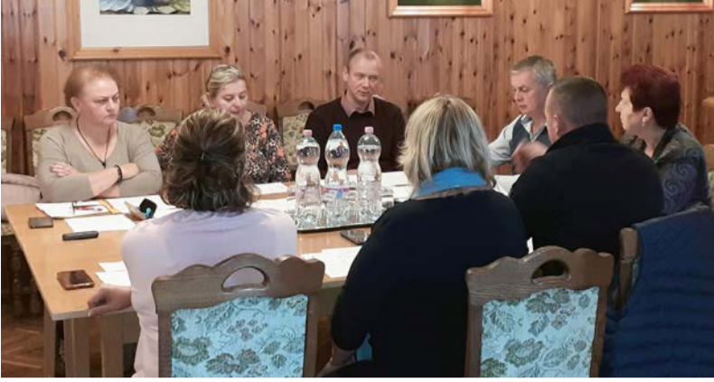
A testület október 27-én tartotta az ülést

Doboz Nagyközség Önkormányzatának Képviselő-testülete 2022. október 27-én tartotta munkaterv szerinti testületi ülését, amelyen a napirendi pontok a következők voltak: