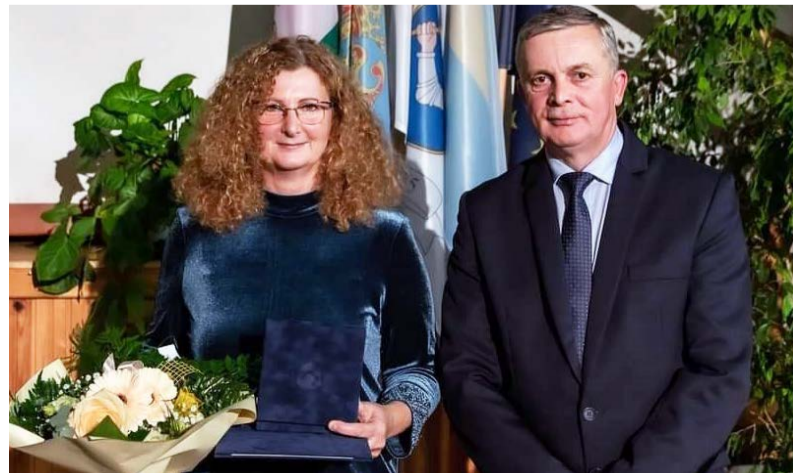
Az Év Vállalkozása elismerést az Ektor Bt. vehette át