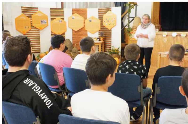
A helyi méhészek mézeit is megkóstolták a gyerekek