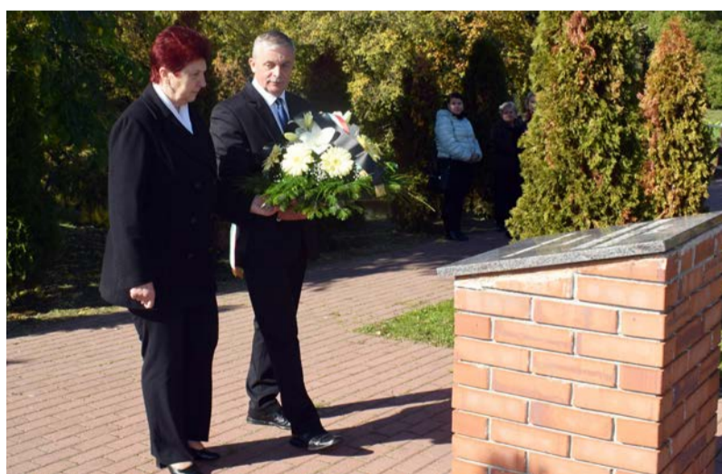
Koszorúzás az '56-os emlékműnél

Október 21-én, a pénteki napon ismét ünnepi műsorról emlékeztünk 1956 eseményeire és hőseire a forradalom és szabadságharc 66. évfordulóján. A természet és az időjárás méltó hátteret biztosított az ünnepléshez, hiszen ragyogó napsütésben, gyönyörű kék égbolt alatt, őszi színekben pompázó fák által ölelve kezdődhetett az előadás.