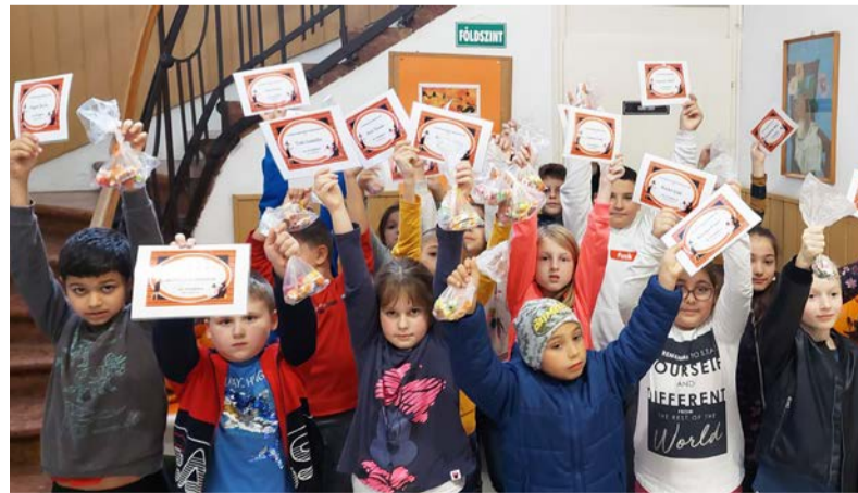
Az oklevelek büszke tulajdonosai

DOBOZI Hírmondó – Megjelenik havonta – Kiadó: Dobozói Óvár Nonprofit Kft., Felelős szerkesztő: Szabó-Bánfi Boglárka.