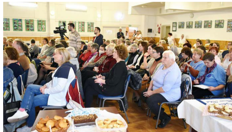
Számos érdeklődő ellátogatott a rendezvényre.