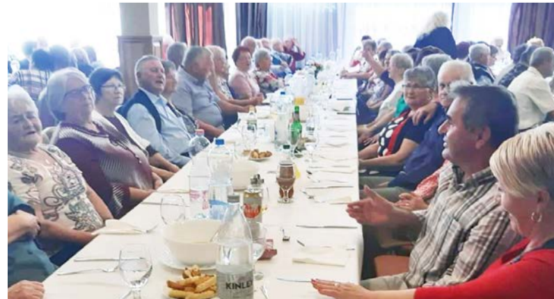
Jó hangulatban telt a rendezvény