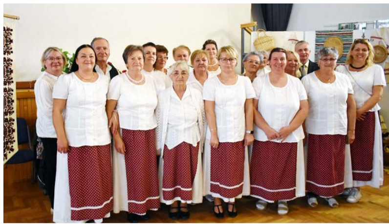
A vendéglátók szerepét a Dobozai Népművészeti Egyesület és a Dobozai Nefelejcs Hímző Szakkör tagjai látták el.

2022. november 5-én településünk adott otthont, a Népi Kézműves Közösségek Találkozójának, amely immár 8. alkalommal került megrendezésre. A Békés Megyei Népművészeti Egyesület által szervezett eseményen 32 közösség több mint 140 tagja vett részt. Különböző népi kismesterségekkel foglalkozó közösségek tagjai találkoztak ezen a napon úgy, mint hímzők, csipkeverők, mézeskalács-készítők, gyöngyfűzők, nemezelők, bútorfestők, gyékény-, szalma- és csuhéfonók, szövők, vesszőfonók és egyéb komplex népi díszítőművészeti alkotók.