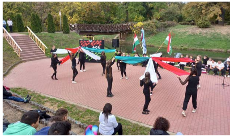
Ünnepség október 23-án

A hagyományokhoz híven iskolánk tanárai és diákjai az idei évben is ünnepi műsorral tisztelgették az 1956-os forradalom hőseinek emléké előtt. Az ünnepi programnak a liget melletti közösségi tér adott otthont, ahol a tanulók műsorukban felelevenítették a hatvanöt évvel ezelőtti eseményeket.