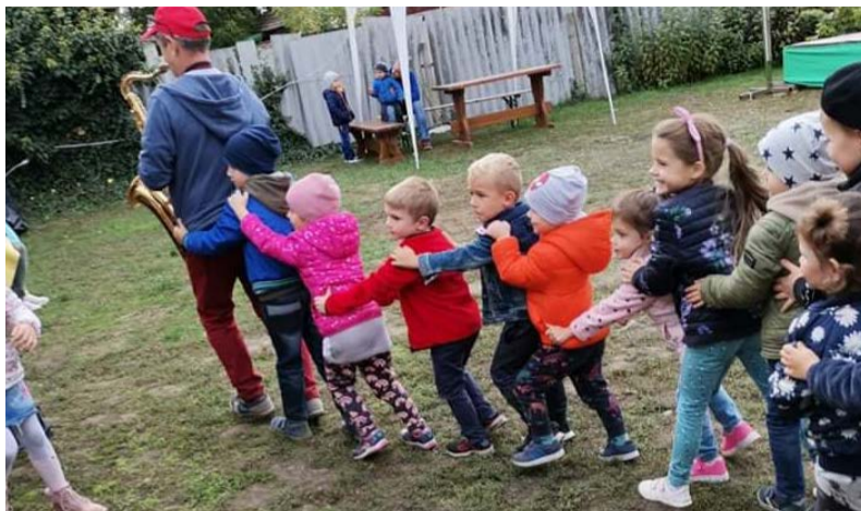
Vonatozás az udvaron