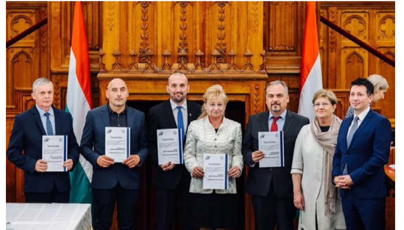
Az energiahatékony Önkormányzatok képviselői

Múlt héten, a Parlamentben vette át Doboz Nagyközség polgármestere és alpolgármestere az Energiahatékony Önkormányzat 2021. tanúsítványt.