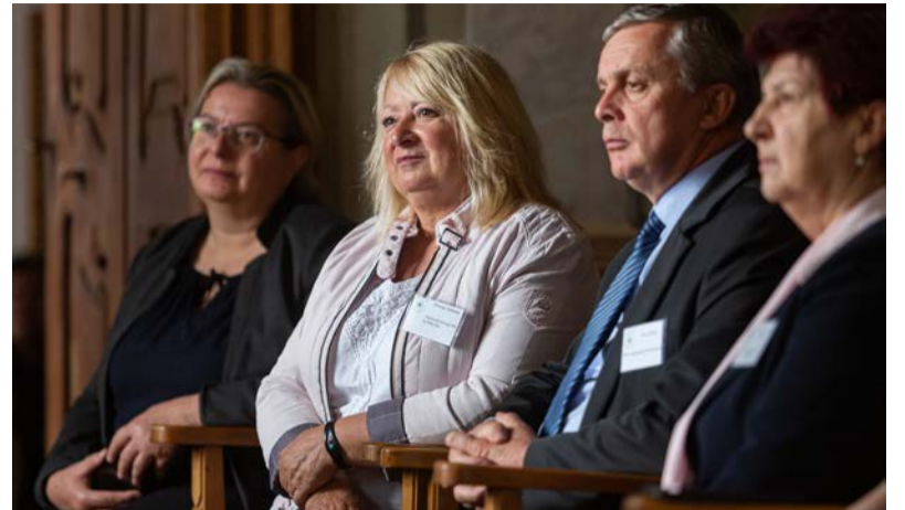
Látópont címet kaptunk

A Magyar Közösségépítők Értékszövetsége Egyesület 2021 tavaszán hirdette meg a Látópont Cím pályázatát, melyre példaértékű közösségi tevékenységeket megvalósító szervezetek jelentkezését várták. A beérkezett 23 pályázat közt a Dobozi Községi Ház és Könyvtár munkáját is érdemesnek találták arra a pályázat kiírói, hogy „Látópont” címet adományozzanak intézményünknek. Békés megyében Gyula és Dévaványa kulturális intézményei részesültek hasonló elismerésben.