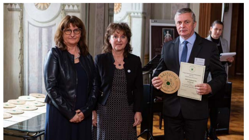
Szakmai nap a díjátadó után