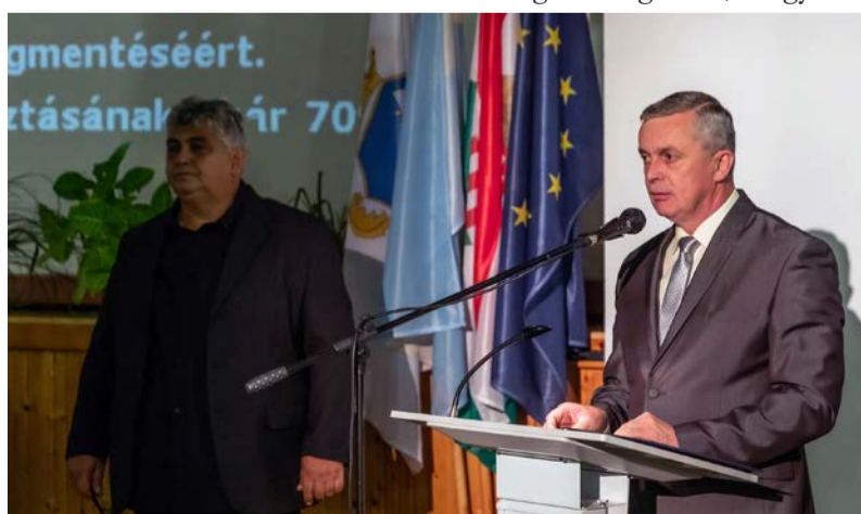
Megnyitó beszéd a Művázban