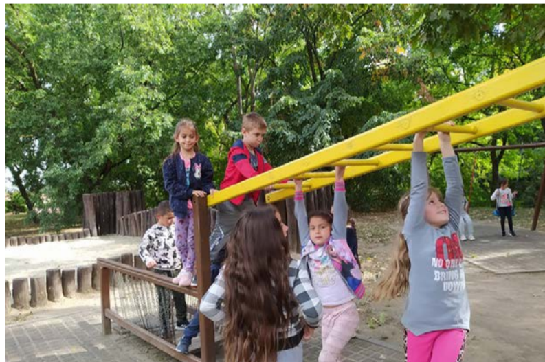
...és a ligetben