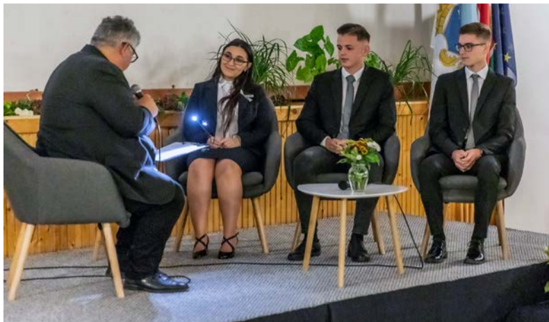
Ifjúsági díj nyertesei

akik 2021-ben a 13/2017. (VII. 5.) önkormányzati rendelet alapján kiérdemelték a Képviselő-testület elismerését, így: a Doboz Nagyközség Ifjúsági díja kitüntetést, a Civilek Dobozért kitüntetést,