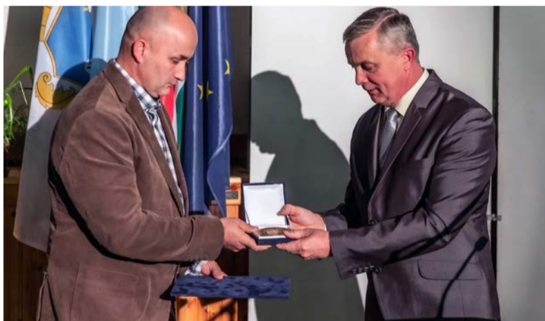
Az év vállalkozója

bölcsességgel köszöntsem a mai kitüntetetteket, mely így szól: „Állj meg vándor! Emlékezz! Meríts erőt a múltból, és ne feledd, hogy mennyi tanulás, mennyi munka, mennyi