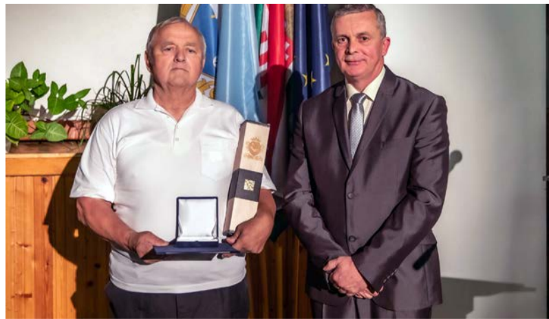
A Civilek Dobozért díj nyertesének képviselője