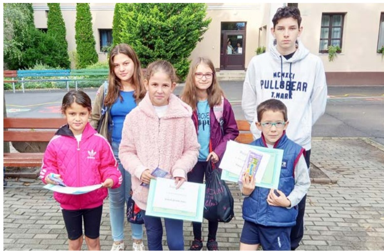
A meghirdetett versenyre összesen 76 alkotás érkezett

„Vakációs élményeim”... címmel pályázatot hirdetett a Békéscsabai Rendőrkapitányság és a Dobozi Cigány Nemzetiségi Önkormányzat a Dobozi Általános Iskola tanulói részére. A pályázat célja annak bemutatása, hogy a gyerekek az iskolai nyári szünetben