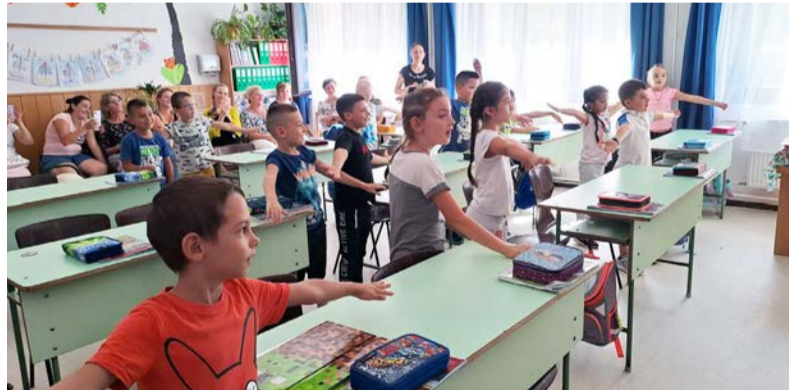
Elengedhetetlen a közös munka az iskola és az óvoda között

Az iskola első hónapja egy előkészítő szakasz a kis elsősoők számára. Teljesen új világba csöppennek, ahol szabályok és elvárások vannak, mely idegen a szinte még óvodás kisgyermek előtt.