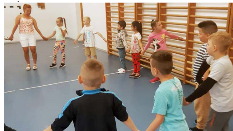
A program során alkalom nyílt a közös játékra is

alapozni, amire később az iskolában tudunk építeni. Emiatt elengedhetetlen a közös munka a két intézmény között.