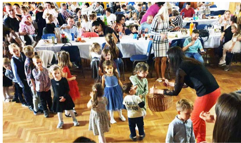
Szép estét tölthettek együtt az ovibál résztvevői