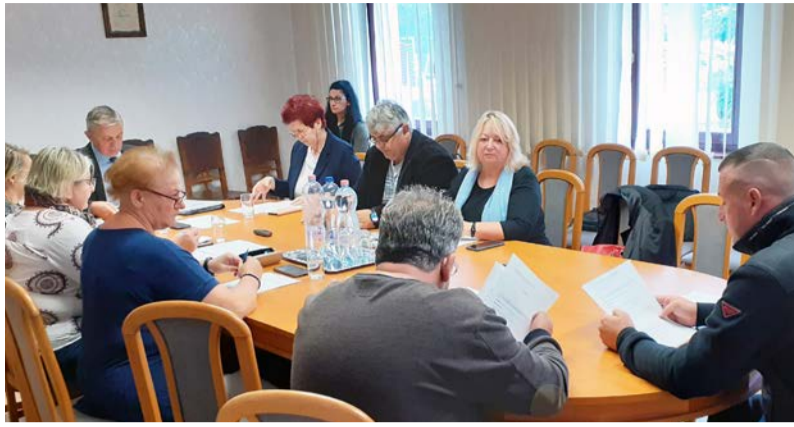
A testület szeptember 29-én tartotta az ülést

Doboz Nagyközség Önkormányzatának Képviselő-testülete 2022. szeptember 29-én tartotta munkaterv szerinti testületi ülést, amelyen a napirendi pontok a következők voltak: