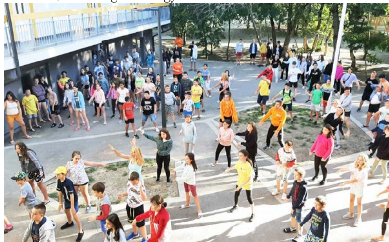
Minden nap reggeli tornával kezdődött