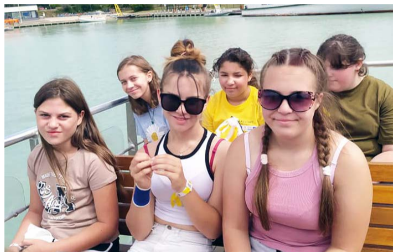
Jobbnál jobb programok vártak a fiatalokra

Remélem, az eddig leírtakból is kiderült, hogy nagy hibát követett el, aki nem jött el