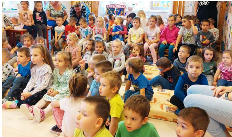
Az ovisok csillogó szemmel hallgatták a mesebeli történeteket

„A mese játék, csoda, hit és lélek. Mosoly mindenki lelkére. A mese az gyógyír, az beféle és kifele is gyógyít.”