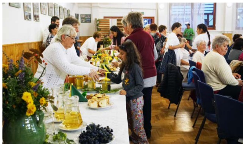
Finom ételek és italok várták a rendezvényre látogatókat

Az idén 25. alkalommal rendeztük meg a hagyományos „Dobozi Szüret” elnevezésű program-sorozatunkat, amely változatos és érdekes programokat kínált minden korosztály számára. Rendezvényeinknek szerdától péntekig a Dobozi Községi Ház és Könyvtár adott otthont. Programjaink nyitottak voltak mindazok számára, akik vágytak egy kis kikapcsolódásra a mindennapok sűrűjében.