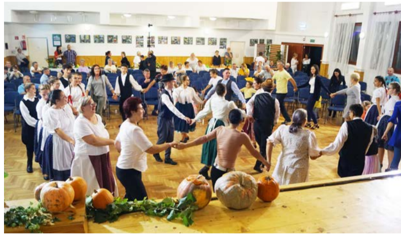
Közös tánc a szüreti mulatságon