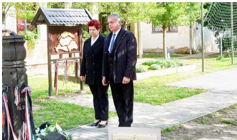
A koszorúzás pillanatai

A kormány 2001-ben a magyar nemzet gyásznapjává nyilvánította október hatodikát arra emlékezve, hogy 1849. október 6-án végezték ki Aradon a magyar szabadságharc tizenhárom honvéd főtisztjét, Pesten pedig Batthyány Lajos grófot, az első magyar felelős kormány miniszterelnökét. Az aradi vértanúk kivégzésének 173. évfordulóján országsszerte tartottak megemlékezéseket; településünk vezetői, iskolánk diákjai is fejet hajtottak mindazok előtt, akik életüket adták a szabadságért.