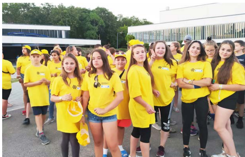
Minden altábor más-más színű pólót viselt

Az idei évben én is jelentkeztem, a zánkai Erzsébet táborba, ami nagyon jó döntésnek bizonyult, hiszen az ott eltöltött öt nap nagyon emlékezetes élményt jelentett a számomra. Július közepére már alig vártam, hogy elinduljunk és meglátogassuk Közép-Európa legnagyobb tavát, a Balatont. Nekem már az odaút is nagyon tetszett. Barátaimmal sokat nevtünk és beszélgettünk a majdnem hét órás vonatút alatt. Sőt a suliból olyan diákokkal is több szót váltottam, akikkel eddig nem igazán, így