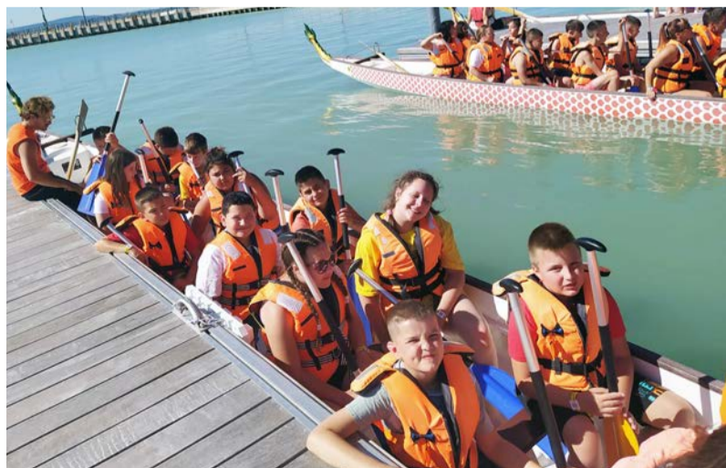
A sárkányhajózás pillanatai

Este kilenckor került sor a „beavató” bulira a tábor főterén. Csak ekkor tudatosult bennem, hogy milyen sok gyerek is jött rajtunk kívül a táborba. Több ezer általános iskolás diák pompázott saját altáborának színeiben (piros, sötétkék, világoskék, magenta, halványzöld, sötét