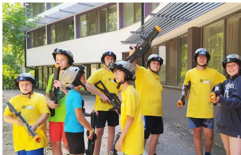
A fiatalok fáradhatatlanul élvezték a hét programjait

kilépést a strand felé vezető kapuknál. Ekkor derült számunkra az is, hogy a citromsárga altáborba kerültünk. A mellénk kirendelt TESO (Tábori Együttélést Segítő Operatív munkatárs) segítségével megkerestük a lakrészüket, ahol mindenki kapott egy citromsárga pólót és basaballsapkát, és egyéb kiegészítőket. Mivel már nagyon éhesek voltunk, senkit sem kellett bízgatni, hogy ezután elinduljunk vacsorázni. A vacsora lenyűgözött engem és teljesen megfelelt az ízlésemnek. De úgy