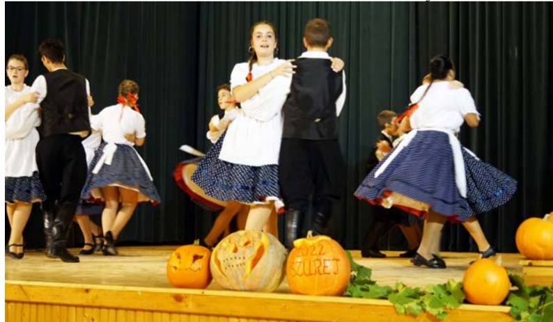
Az estét az ifjúsági néptáncosok nyitották meg