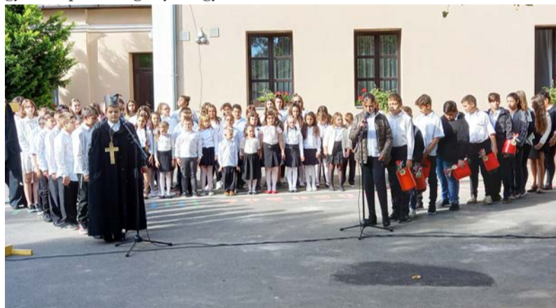
Iskolánk tanulóinak emlékműsora