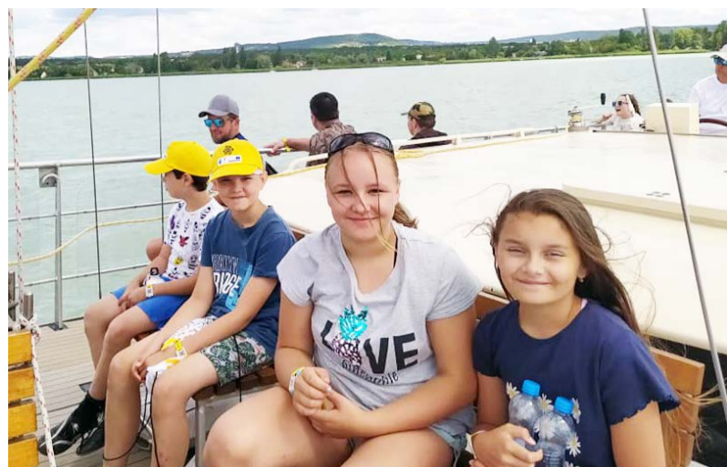
Sétahajózás a Balatonon

A Balaton partján többféle lehetőség közül választhattunk. Lehetett röplabdázni, focizni,