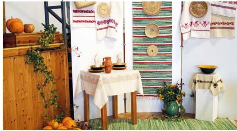
Népi kézműves kiállítás a Községi Házban