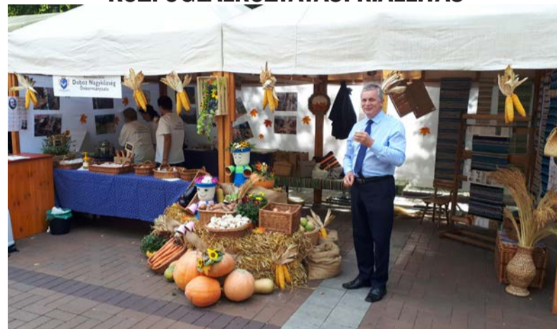
Dobozi Nagyközség standja

Nyolcadik alkalommal rendezte meg a Békés Megyei Kormányhivatal a Békés Megyei Közfoglalkoztatási Kiállítást Békéscsaba főterén. A kiállításon Dobozi település is bemutatta a közfoglalkoztatottak által megteremtett helyi értékeket.