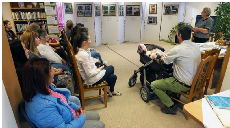
A Dobox Kincsei fotókiállítás

Tisztelettel és szeretettel invitáltuk az érdeklődőket az OKN dobozi rendezvényeire október első hetében a Dobozi Közösségi Ház és Könyvtárba.