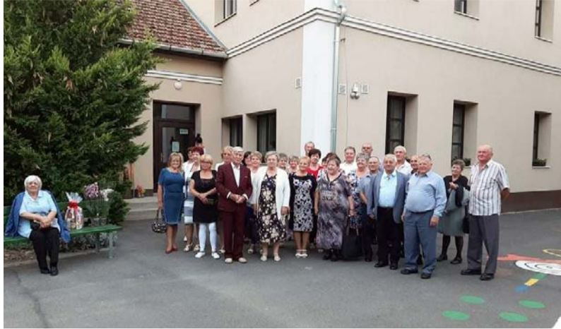
A találkozó résztvevői

2021. szeptember 4-én 50 éves évfolyamtalálkozót szerveztünk az 1971-ben végzett 8. osztályos „öreg” diákoknak. A három 8. osztály ballagó diákjainak létszáma 91 fő volt. Sajnos az elmúlt évtizedekben 21 diaktársunk eltávozott közülünk. A találkozón 39-en voltunk, ebből 27-en a volt tanulók. 5 évfolyamtársunkat nem sikerült felkutatni.