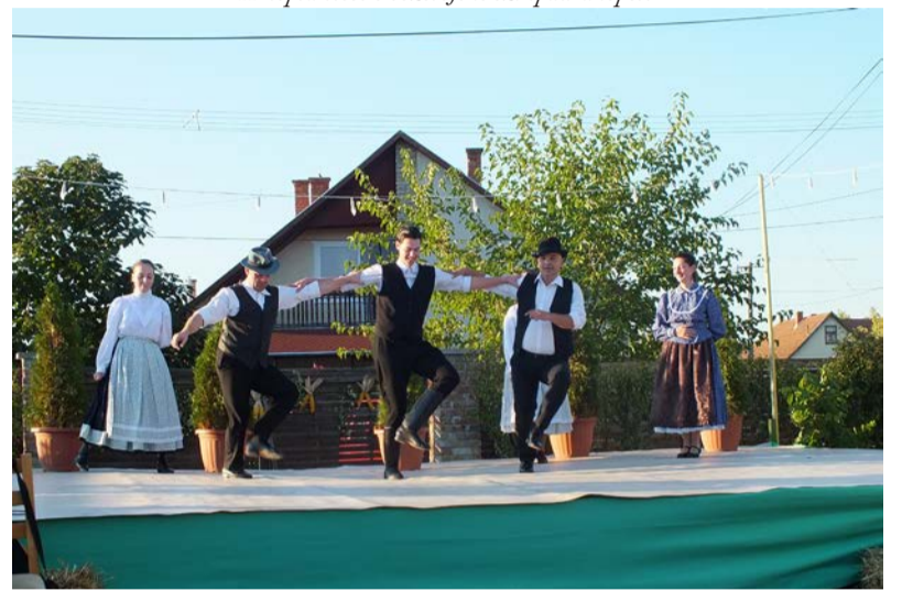
Különleges táncokat mutattak be

pedig a Ludas Zenekar tagjai voltak, akiktől látványos és magával ragadó néptánc és népzenei bemutatót láthattunk, hallhattunk. Eleki, méhkeréki, szatmári és kalotaszegi táncokkal és zenékkal szórakoztatták a kedves közönséget.