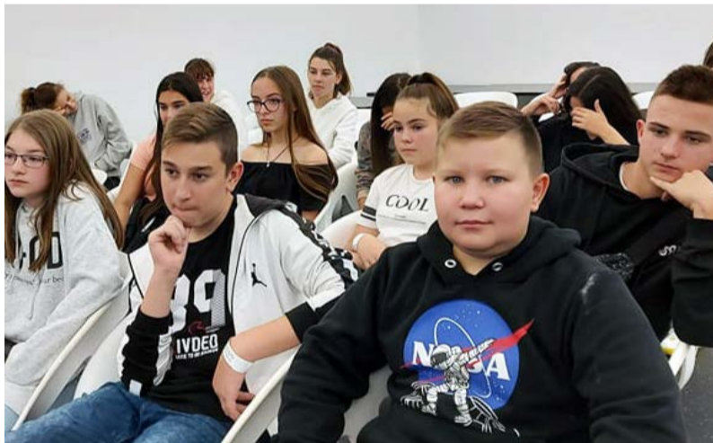
A gyerekek nagyon élvezték a kirándulást

A megújult Csodák Palotája két szinten, 5000 négyzetméteren, több mint 250 interaktív játékos eszközzel a nyolc tematikus részlegen várja a látogató csoportokat. Itt kiemelt hangsúlyt kap a tudományos oktatás, nevelés; céljuk, hogy kedvet csináljanak a gyerekeknek a természettudományok megismeréséhez, és tapasztalati úton tegyék élményé a tanulást.