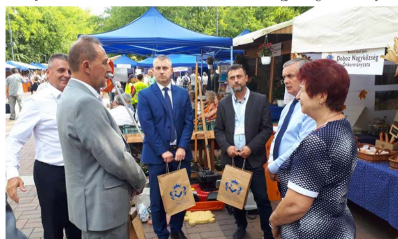
Dobozi Nagyközség Önkormányzata

Rengeteg szervezőmunkát, kreativitást igényelt a kiállítóstandunk berendezése. A rendezvényen a programban természetesen zöldség-félékből készített kóstolókkal vártuk a kiállításra kilátogatókat. A sárgarépalé, a fokhagymás pogácsa és a vegyes zöldségkrémből készült falatkák nagyon népszerűek voltak.