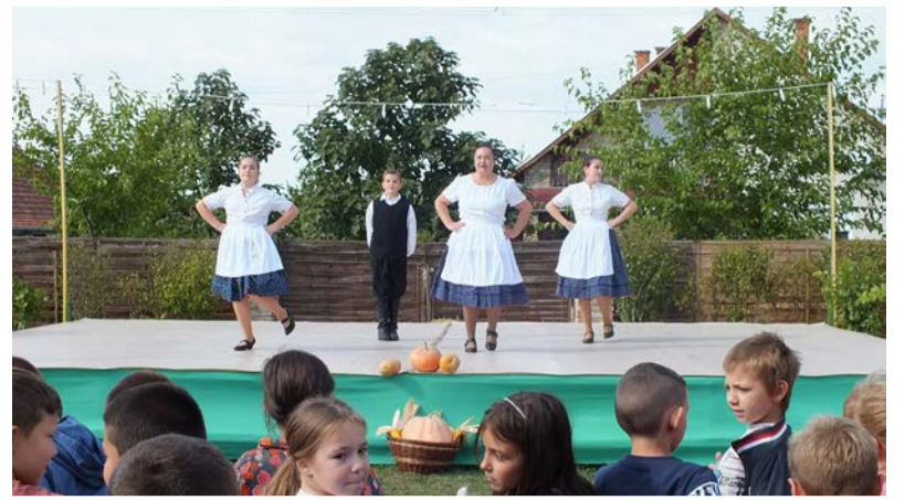
A néptáncosok vezetője is színpadra lépett