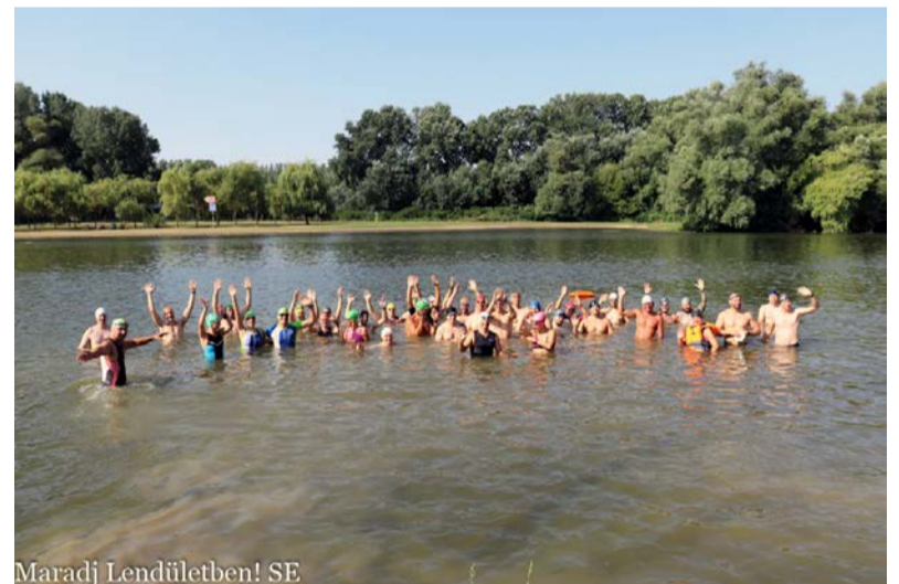
Maradj Lendületben! SE