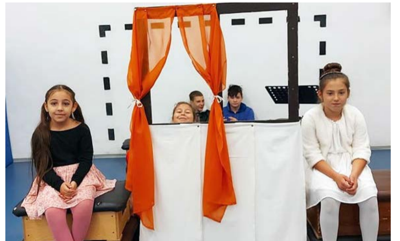
Bábelőadás az iskolában

A népmese napját első ízben 2005. szeptember 30-án – Benedek Elek születésének 146. évfordulóján – rendezték meg. E jeles ünnep méltán kötődik magyar népmese atyjához. Mesegyűjtőként és íróként egyaránt óriási hatással volt a magyar irodalomra. De vajon hogyan kezdődött mesés utazása?