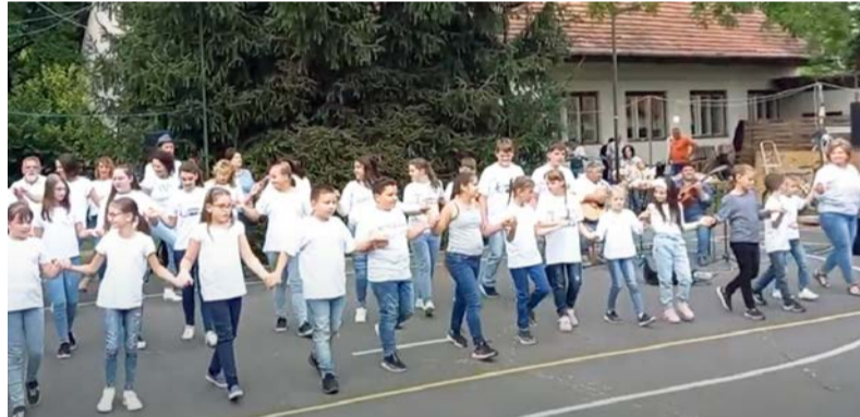
Az est első műsora

Alig kezdődött el az idei tanév, vendégségbe hívtuk a kicsiket és nagyokat, ismét jótékonysági estet rendeztünk. Az évek során azt tapasztaltuk, hogy egy jó ügyért, szép célokért szívesen tesznek a dobozi lakosok.