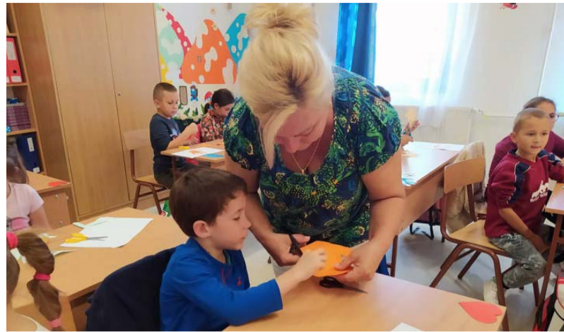
Az átmenet megsegítése különböző foglalkozásokkal

Az idei tanévben is minden nap meglátogattunk bennünket egy-egy óvó néni és segítségükkel közös beszélgetésbe vontuk be a gyerekeket, sok játékkal, rajzolással motiválva őket. Az első heti programunkat úgy állítottuk össze, hogy minden nap más-más tevékenységre helyeztük a hangsúlyt.