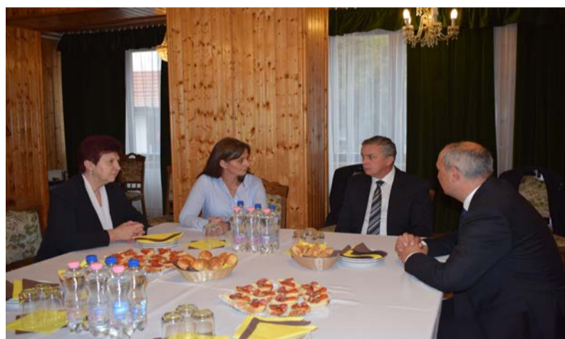
Rövid megbeszélés a Polgármesteri Hivatalban

Tanintézményünkben a múlt héten került az idei év első ünnepi műsorára. Október 6-án iskolai keretek között ismét megemlékeztünk az aradi vértanúkról, Batthyány Lajos miniszterelnökről, de az 1848-49-es szabadságharcban a szabadságért életét áldozó minden magyar katonáról.