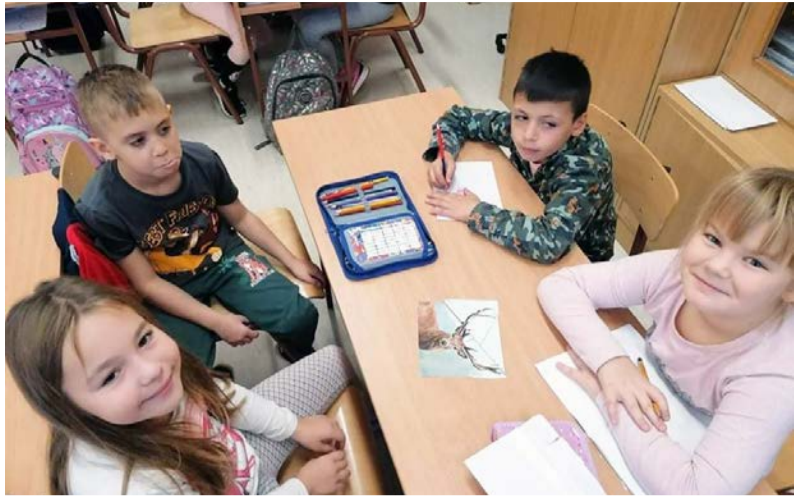
Kirákóval ismerkedhettek a gyerekek az állatokkal

A Dobozi Általános Iskola tanulóival az idei tanévben is megemlékeztünk az Állatok Világnapjáról. Az egyház október 4-ét jelölte ki Assisi Szent Ferenc, az állatok és a természet védőszentjének emléknapjává, majd 1931-től kezdődően e jeles nap lett az állatok világnapja is.