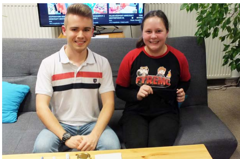
RoliX a sztárvendég