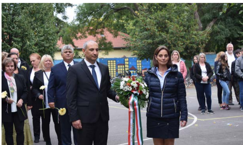
Különleges vendégek a megemlékezésen