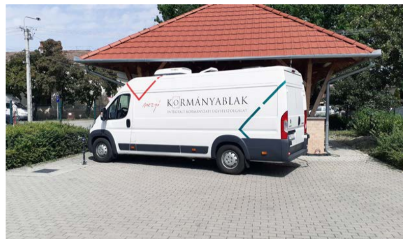
A Kormányablak busz a piactéren

A Mobilizált Kormányablak Ügyfélszolgálat vagy „kormányablakbusz” egy ügyintézésre felszerelt kisbusz, amely előre meghatározott időpontokban elérhető olyan településeken, ahol nem működik állandó jelleggel kormányablak. Lehetőséget teremt az ügyfelek speciális helyszíneken (kórházak, kollégiumok, rendezvények, fesztiválok, stb.) történő, eseti jellegű kiszolgálására.