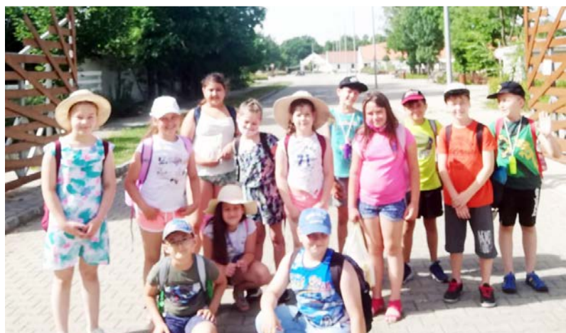
A gyerekek élvezték a programokat