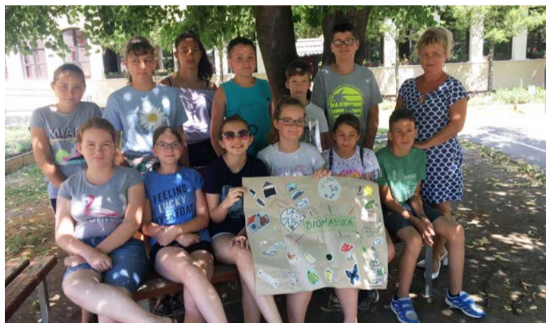
Ismerkedés a környezetünkkel

Valamennyi programról elmondható, hogy a közösség élményén túl tudást és tudásvágyat, tartalmas programokat, maradandó és emlékeztető pillanatokat, érdekes-értékes ismereteket adott a diákoknak, hasznosan teltek a táborozás napjai.