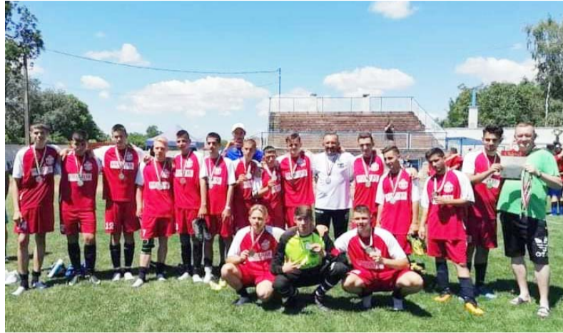
Az ifi csapat

A Doboz Szabadidős Tömeg- és Versenysport Egyesület mindkét labdarúgó csapata befejezte a 2020/2021-es őszi és tavaszi labdarúgó idényt.