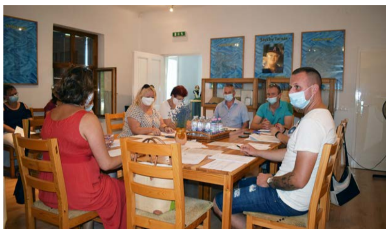
Testületi ülés a Széchy Emlékházban

Doboz Nagyközség Önkormányzata Képviselő-testülete június 29-én tartotta kihelyezett testületi ülést a Széchy Emlékházban, melynek napirendi pontjai a következők voltak: