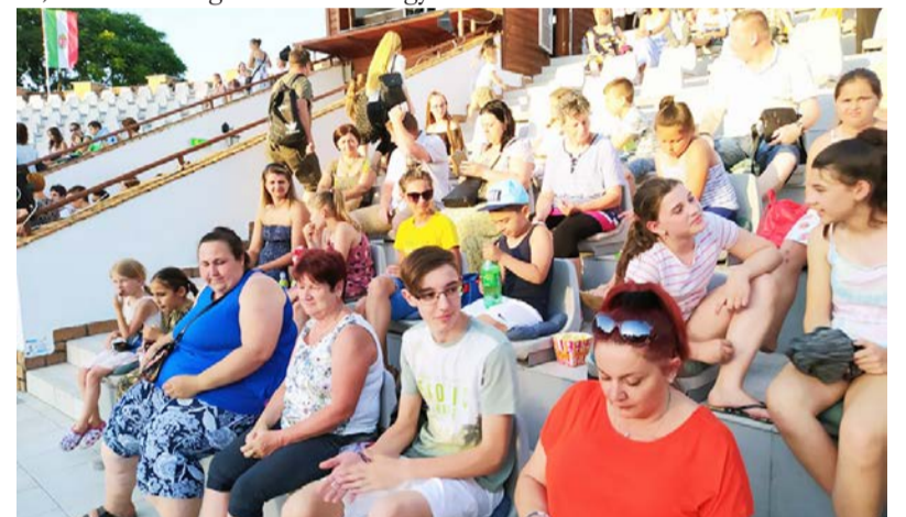
A jutalomkönyvek mellé szép élményt is kaptak kitűnő tanulóink

Ezt követően a szorgalmas diákoknak jutalomkönyveket és okleveleket adott át az intézményvezető úr, valamint meginvitálta őket egy