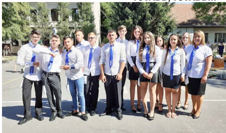
A ballagás egy különleges pillanat...

A ballagás az iskola életének egyik legszebb ünnepe, bensőséges szertartása, melynek során útra bocsátjuk a végzősöket. Tudjuk, ez a nap minden résztvevő számára felemelő és izgalmas. Ünneplőbe öltözünk és öltöztetjük az iskolát, átadjuk magunkat az érzéseknek, élményeknek, melyek összekötnék minket. Az ünnepség segít megélni a pillanatot, emlékeztetővé tenni az élet jelentős állomásait.