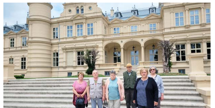
A tárlatvezetés során sok történetet hallhattak a résztvevők