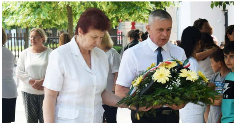
Koszorúzás az emlékhely előtt

A Nemzeti Összetartozás Napja az 1920-as trianoni békeszerződés aláírásának évfordulójára emlékező nemzeti emléknap. Június 4-én a trianoni döntésre, az ország területeinek elcsatolására, családok és városok szétszakítására emlékezünk, amikor is Magyarország új földrajzi határokat kapott, és így több mint 3 millió magyar ke-