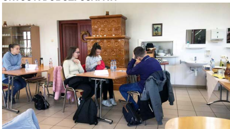
Írásbeli és gyakorlati feladat is várt a csapatra

A kültéri feladatok közül a növényfelismerés nagyon izgalmasnak bizonyult. A fajok és a bokrok begyűjtött levelek alapján, míg a gyógynövényeket illatuk alapján kellett felismerni. Lazításként egy játékos, ügyességi feladat várt a