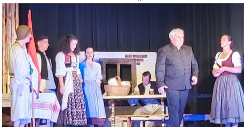
Az érdeklődők a Békési Betyárok című előadást tekinthették meg

2022. május 20-án Dobozen is megtekinthették az érdeklődők a Belinszki Zoltán, Székér Gergő, Varga Viktor Békési Betyárok című folk musical előadást a Dobozi Községi Ház és Könyvtár nagytermében. A megye több települését is bejáró produkció nagy sikert aratott a diákok, a nézők körében.