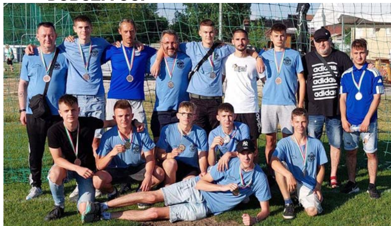
Ezúton is gratulálunk a fiúknak!

Befejeződött a 2021-2022. évi Megye II/A labdarúgó bajnokság. A Dobozi Se. labdarúgó csapata a tabella 8. helyén végzett 12 győzelemmel, 2 döntetlennel, 12 vereséggel. Nem lehetünk teljesen elégedettek a teljesítménnyel, csapatunk megmutatta pár mérkőzésen, hogy több van bennünk mint a tabellán elfoglalt helyezést mutatja. A következő évben felkészülésben, hozzáállásban és edzésátogatásban van hova fejlődnünk és sokkal sikeresebben zárhatjuk a következő pontvadászatot. Köszönünk minden támogatást, segítséget, aki bármilyen formában hozzájárult az egyesület működéséhez és sikeréhez. Köszönjük, Hajrá Dobozi!