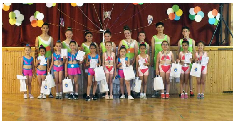
Az aerobikosoktól 10 koreográfiát láthattunk