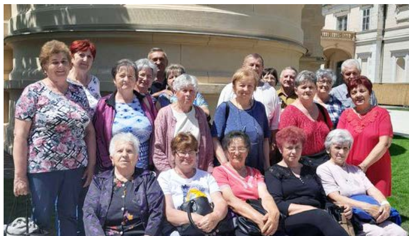
Csoportkép a kiránduláson résztvevőkről

Május 26-án kirándultunk Szabadkigyóásra a kastélyt megnézni. Nagyon szép lett a felújítás után. Tartalmas