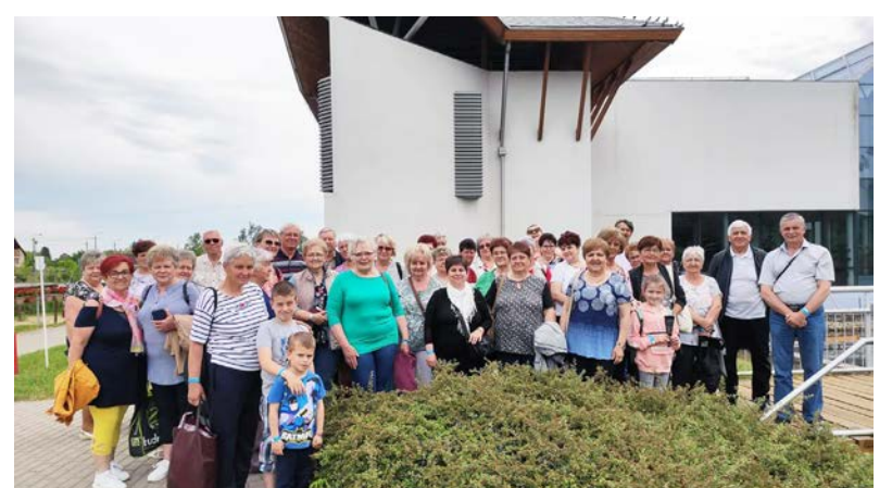
Egy vidám napot tölthettek együtt a kiránduláson résztvevők