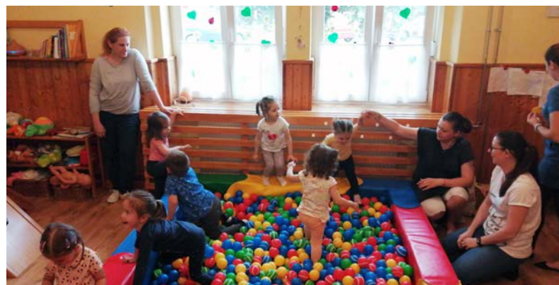
Önfelelt játék a labdamedencében