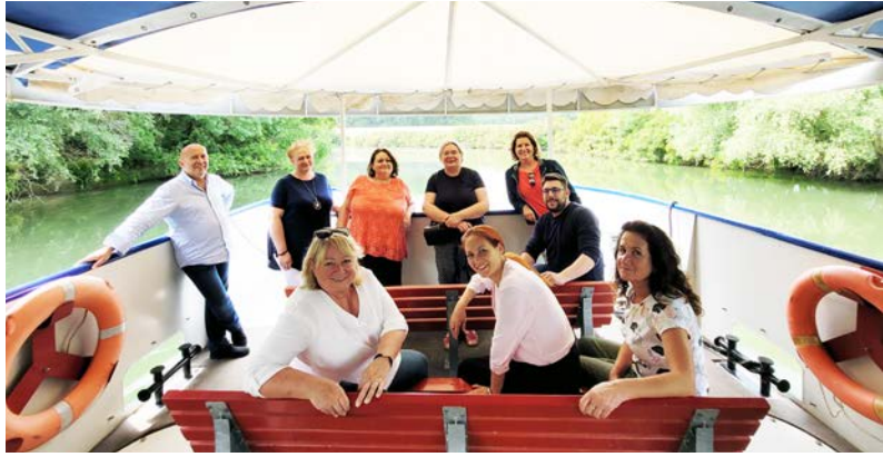
A program során kölcsönös tapasztalatszerésre került sor

A Magyar Közösségépítők Értékszövetsége Egyesület 2021 tavaszán hirdette meg a Látópont Cím pályázatát, melyre példaértékű közösségi tevékenységeket megvalósító szervezetek jelentkezését várták. A Dobozi Községi Ház és Könyvtár munkáját is érdemesnek találták arra a pályázat kiírói, hogy „Látópont” címet adományozzanak intézményünknek.