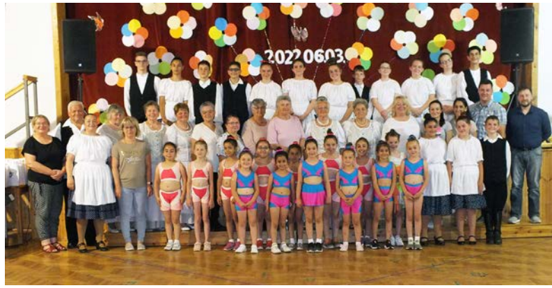
Csoportkép az este fellépőiről, díjazottjairól

A Dobozi Szabadidős és Mozgáskultúra Közhasznú Sportegyesület és a Dobozi Községi Ház és Könyvtár szervezésében, 2022. június 3-án került megrendezésre művészeti csoportjaink évzáró bemutatója, és a 2022. év II. aerobik háziversenye.