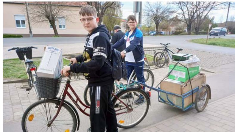
Kellemes időben folyt a munka

A szeptemberi első akció után, idén áprilisban ismét papírgyűjtést szerveztünk iskolánkban. Szerecsére az idő most is kegyeibe fogadta a papírgyűjtőket, hiszen kellemes, nem túl meleg időben folyt a munka. A gyerekek ismét nagy kedvvel és lelkesedéssel járták az utcákat, és gyűjtötték össze családok számára már haszontalaná vált papírokat. Volt, aki táskákban, reklámszatyrokban cipekedve hozta az összegyűjtött papírt. Voltak, akik biciklin, talicskán gurítva. Mások pedig autóval, vagy éppen kisteherautóval érkeztek.