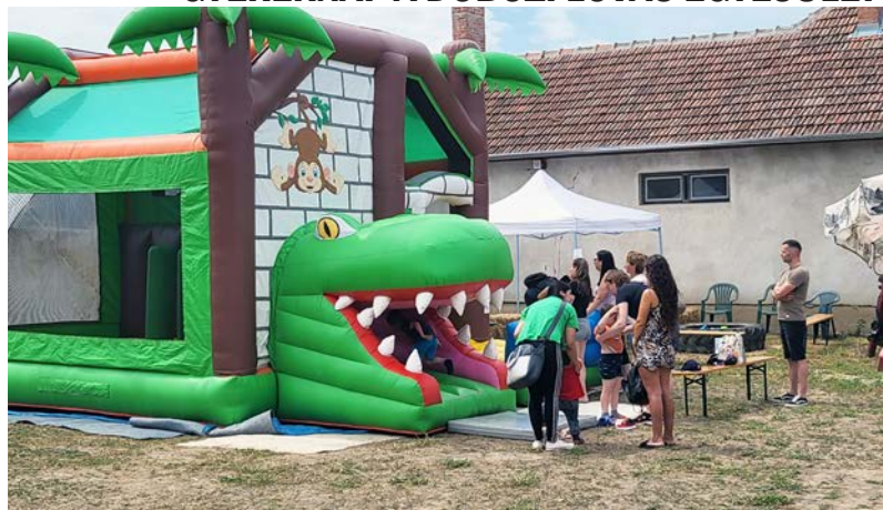
Ugrálóvár is várta a gyerekeket

Immár második alkalommal került megrendezésre a gyereknapi Dobozi Lovas Egyesület szervezésében május 21-én. Az Állatsimogató területén felállított ugrálóvár várta egész nap az örökmozgó gyerekeket. Emellett ügyességi játékokat, lovaglást és csillámtetoválást is kipróbálhattak az érdeklődők. A büfében mindenki talált hűsítő finomságot magának. A simogató