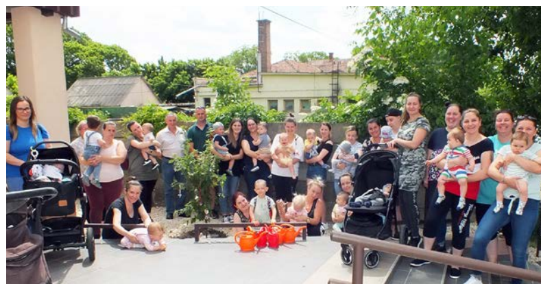
A gyerekekkel közösen ültették el a „cumifát”