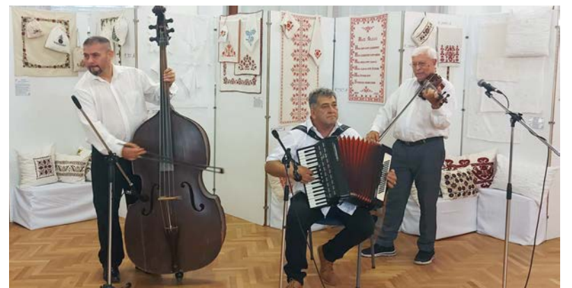
Az este során a dobozi zenészeinket is hallhattuk