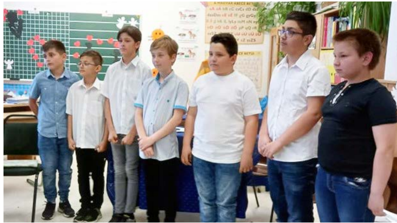
A 4. a osztályosok is készültek az anyáknapra ünnepségre

A legnagyobb kincs egy anya számára a gyermeke, a legnagyobb kincs egy kisgyermek számára az édesanyja. Ezért is tartották fontosnak a 4. a osztály gyermekei,