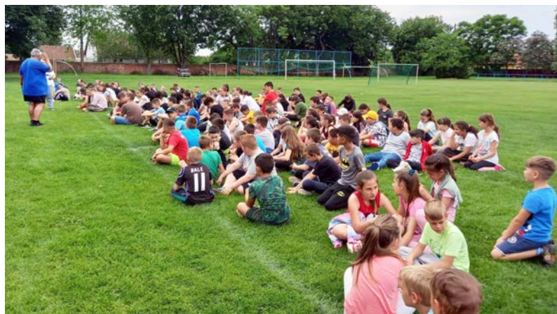
Csapatversenyen vettek részt a tanulók

Az egész napos mozgás volt a mottója a Gyermekek- és sportnapnak, május 25-én. A program zenés reggeli tornával kezdődött, ezzel a megmozdulással a Kihívás napi feladathoz is csatlakoztunk. Nagy örömeinkre az óvodások is elfogadták a meghívásunkat és velünk mozogtak. A délelőtti folyamán játékos csapatversenyen vehettek részt a tanulóink, ahol a végzős osztályunk diákjai megcsillogtathatták csapavezetői készségüket. Azt hiszem, mindegyik vezetőnek kijár a dicséret, bár nem volt könnyű dolguk a kisebb évfolyamosokkal, remekül helyt álltak. A folytatásban foci és kézilabda-mérkőzések zajlottak. A lelkes játékosok és a remek szurkoló gárdának köszönhetően záporoztak a gó-