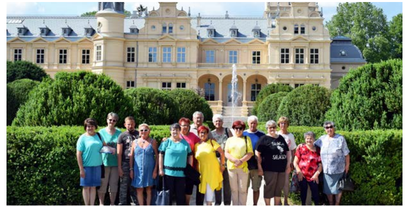
A program csodálatos környezetben, jó hangulatban valósult meg

Az Idősek klubja tagjai látogatást tettek a szabadkigyósi Wenckheim kastélyba, amit kíváncsian vártak, hiszen sokat hallottak már a felújított épületről és a gyönyörű környezetről.