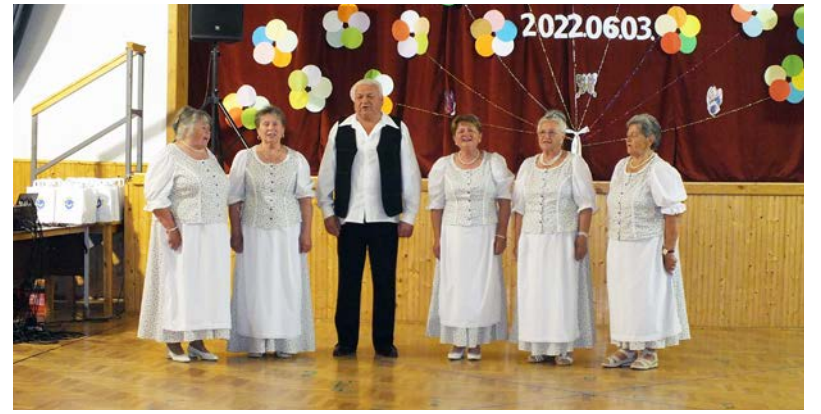
A Dobozi Népdalkör tagjai is részesei voltak a bemutatónak