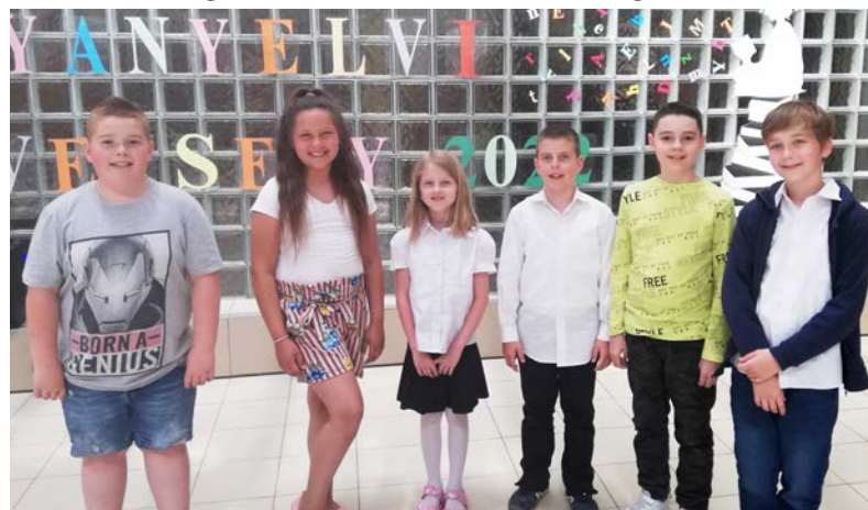
Izgalommal teli próbatétel várt a tanulókra

Komplex anyanyelvi versenyen vettek részt iskolánk tanulói, Újkígyóson a Széchenyi István Általános Iskolában. Mint a versenyt szervező iskola intézményvezetője elmondta, a rendezvény nagykorú lett, 18. alkalommal rendezik meg, vidéki iskolák részvételével. Intézményünk alsó tagozatos diákjai szinte a kezdetektől ringbe szállnak ezen a megmérettetésen. Így volt ez május 19-én is, amikor második, harmadik és negyedik osztályos „kis