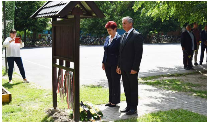
Az iskolai emlékmű megkoszorúzás

Elvászthattak, de szét nem választhatnak – e gondolat szellemében iktatta törvénybe a június 4-i Nemzeti Összetartozás Napját 2010. május 31-én a magyar Országgyűlés. A trianoni békeszerződés történelmünk egyik legnagyobb sorstragédiája, de a nemzeti összetartozás emléknapja nem feltétlenül gyásznap, annak ellenére, hogy szomorú eseményhez kapcsolódik! Hiszen az elmúlt évtizedekben a környező országok magyarsága, még ha kicsit megfogva is, de meg tudott