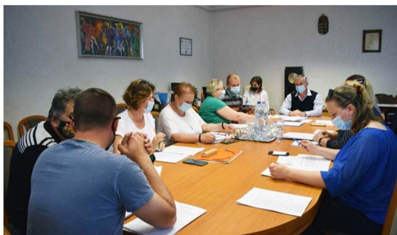
Egyeztető megbeszélés a Képviselő-testület tagjai között

Doboz Nagyközség Önkormányzatának Képviselő-testülete 2021. május 27-én tartotta meg egyeztető megbeszélését. A napirendi pontok a következők voltak: