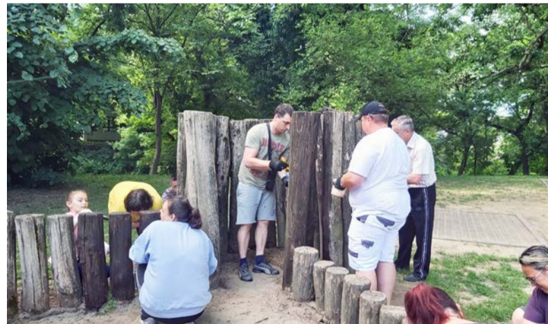
Önkéntesek festették a játszótér

Azoknak az önkénteseknek, képviselőknek, diákoknak, szülők-