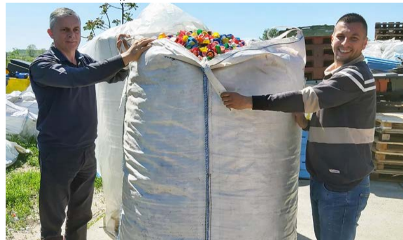
Az összegyűlt kupakok átadása

A Dobozi Községi Ház és Könyvtár főbejárata elé került elhelyezésre 2020. novemberében az a kupagyűjtő szív, melyet az elmúlt hónapokban sok sok kupakkal és jószándékkal töltöttek meg a doboziak.