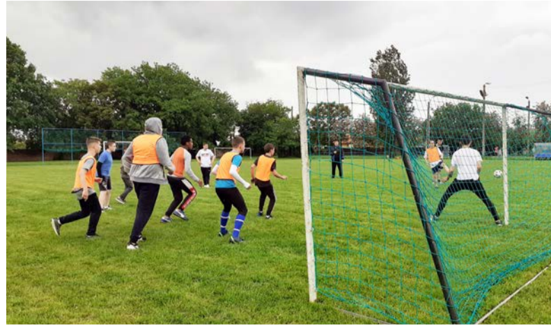
Labdarúgó mérkőzés a sportnapon

2021. május 31-én nagy sikerrel került megrendezésre ismét a sportnap. Tavaly a járvány miatt mindenki bánatára elmaradt. A felsős tanulók már nagyon várták, lelkesen készültek rá egy héten keresztül minden esti órán. A fiúk labdarúgás mérkőzéseken méretetk meg magukat. Vegyes csapatokat alakítottak és körmérkőzéseket játszottak. Nagy volt az izgalom, hogy ki melyik csapatban kerül.