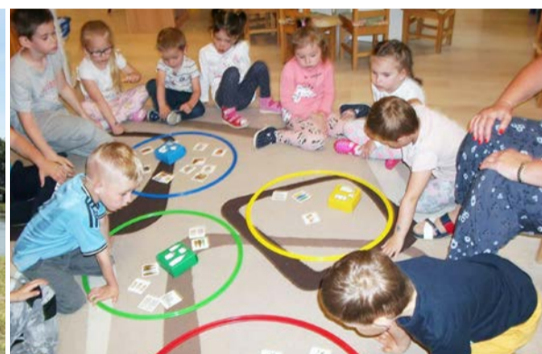
Tudáspróba az óvodában gátást megvalósítani.

a gyerekeknek. Megrendeztük a Három próbát, ahol erő-, ügyesség és tudáspróbán vehettek részt az apróságok. Kipróbálhatták a csuhé pillangőregetést, csillámtetoválást, élvezhették a Liget adta szabadságot, szépséget. Megízlelhették a dobozi lángost és a hideg nyalánkságot, a fagyit is. A nagy kedvenc a Dottó vonatkozás is színesítette a hét programját. Voltak csoportok akik Szanazugba utaztak, a többiek pedig Doboz utcáit fedezték fel. Lehetőség nyílt minden csoport számára a helyi állatsimogatóba is ellátogatni. A Dobozi Óvodáért Alapítvány anyagi támogatásával tudtuk a Dottózást és az állatsimo-