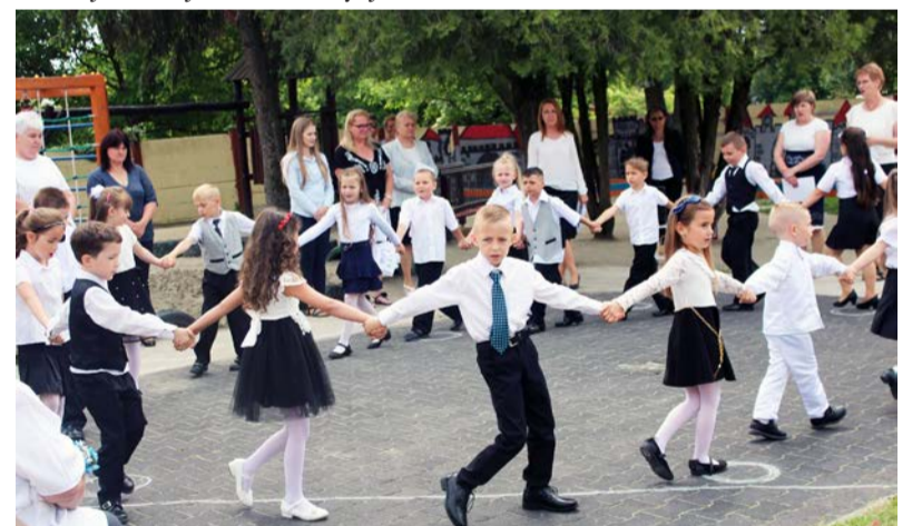
A ballagási műsor