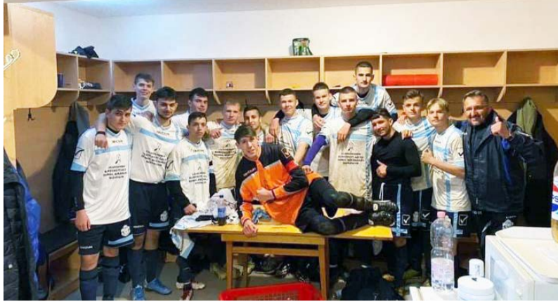
Az ifi csapat