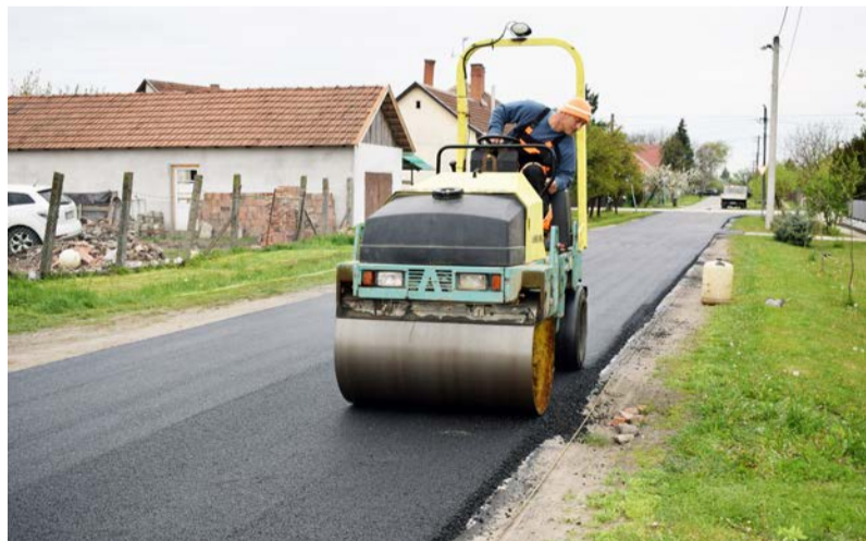
A friss aszfalt

2020-ban nyújtottuk be az önkormányzati fejlesztésekre vonatkozó pályázatunkat, melyről már több alkalommal is tájékoztatást adtunk. Az Áchim utcai útfelújítás 527 méteres szakaszára nyertünk 20 millió Ft-os támogatást, amit 15