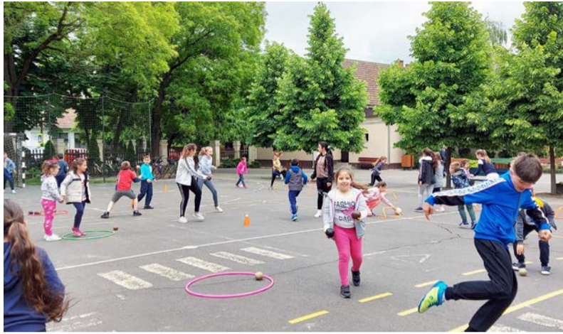
Sportnap az iskola udvarán

Ha sportnapra készülünk, esőre áll az idő... Ez már hagyományná vált nálunk, meg is lepődnénk, ha másként alakulna. De a pozitív hozzáállásnak köszönhetően, és az élményközpontúságra koncentrálnak, próbáltuk megtalálni hétfő délelőtt a csapadékmentes sávot. (Többnyire sikerül.) Az idei sportnapunk lényegét az élményszerzés, a mozgás örömeinek felismerése, a játék adta. Az alsó tagozatosoknak felállított akadálypályák, a versenyek helyett az ösztönös játékot, a mozgáskedvelő felbresztését szolgálta. A gyere-