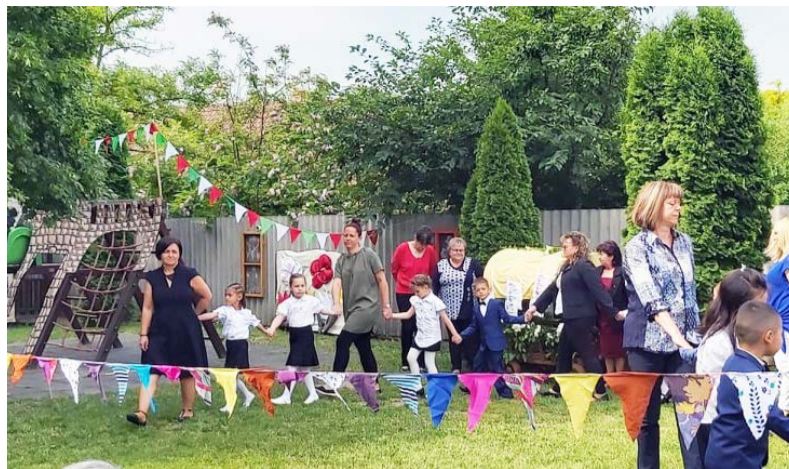
Ballagás az óvoda udvarán