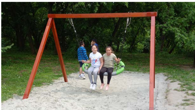
Mindenki örömmel fogadta a megújult játszótér