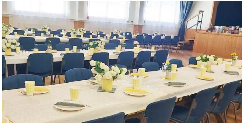
A jótékonyági bálnak a Községi Ház adott otthont

kult egy lelkes csapat, akik izgalommal álltak neki a bál szervezéséhez, hisz oly kockázatos ebben a nehéz helyzetben bált hirdetni, mikor a családok megélhetése is nehéz, de szerencsére itt mindenki a nehézségek ellenére is, azt gondolta, hogy érdemes a gyermekeink második otthonát fejleszteni. Rendkívül büszke vagyok arra, hogy én tudhatom magam mögött ezt a kis csapatot, akik egy-egy program megszervezésében, vagy akár más intézmények rendezvényein, a község rendezvényein való részvételében, a hozzáállásuk és lendületük töretlen.