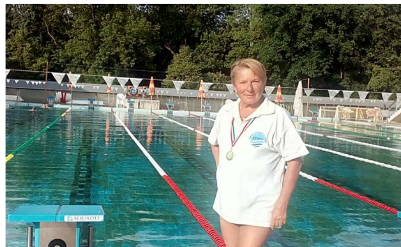
„Sosem késő elkezdeni”