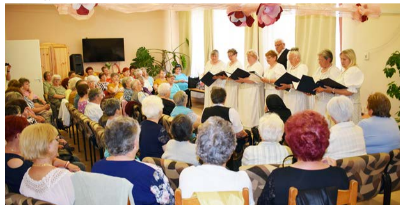
A Dobozi Népdalkör egy csodás nótacsokorral készült