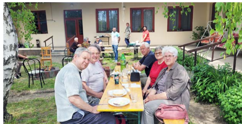
Mindenki lelkesen készült a programra

Nagy örömeinkre sikerült megvalósítani az idei első kültéri összejövetelt. Egy kellemes májusi napon szalonnasütésre hívtuk és vártuk a klubtagokat, mely tökéletes alkalom arra, hogy önfeledten, jókedvűen töltsük együtt az időt. Jó volt látni, ahogy a programra érkeztek az érdeklődők. Az időjárást leszve bíztunk benne, hogy sikerül elkészíteni az ebédet. A nyársak különböző változatai között válogatva mindenki megtalálta a neki megfelelő eszközt, melyre kívánatosabbnál kívánatosabb falatokat