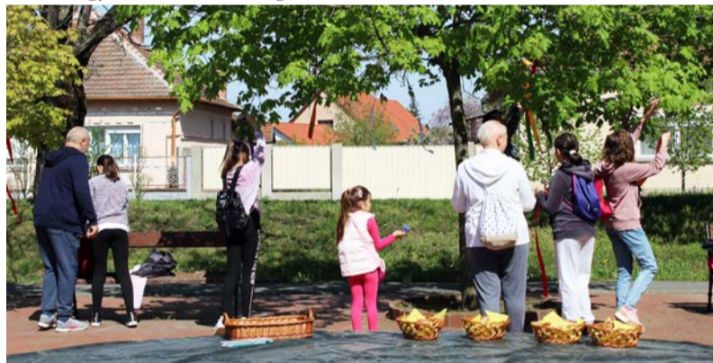
A program a szökőkútnál kezdődött a fák felszalagozásával

A liget árnys fái alatt a Dobozi Lovas Egyesület lovain lovagolhat-