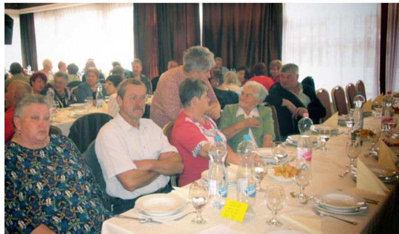
Az évnitő rendezvénynek a Kornélia étterem adott otthont

Mozgáskorlátozottak Békés Megyei Egyesülete