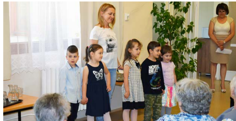
Az óvodások verset szavaltak az ünnepségen

Az anyák napi ünnepség egy bensőséges ünnep itt az idősök körében. Hagyományainkhoz híven a Dobozi népdalkör tagjai egy csodás nótacsokorral készültek, amivel könnyeket csaltak sokak szemébe. Ezúton is köszönjük az előadást. A dobozi óvodából is érkeztek hozzánk gyerekek, akik alkalomhoz illő verseket szavaltak, a vendégek ezt nagy örömmel és szeretettel