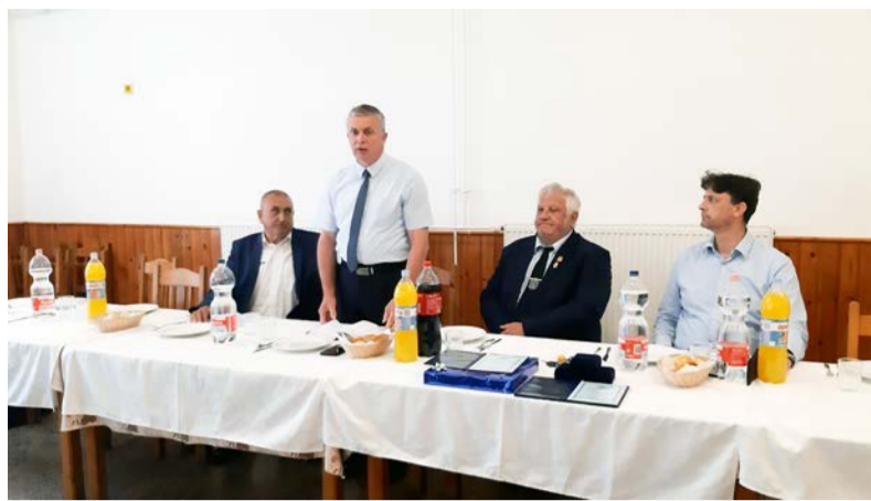
A közgyűlés során részletes beszámolót hallhattak a jelenlévők

Ünnepi, évértékelő közgyűlést tartott 2022. május 15-én a 30 éves Dobozi Polgárőr Egyesület.