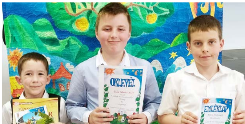
Gratulálunk az elért eredményekhez

2022. április 13-án Füzesgyarmaton került megrendezésre a „Sárrét kis mesemondója” területi mesemondó verseny. A megmérettetésen 1., 2. és 4. évfolyamos