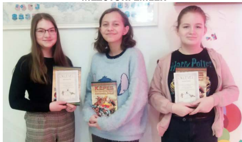
A verseny során rajzokat és prezentációkat is kellett készíteni

„Tiszteled a múltat, hogy érthesd a jelent, és munkálkodhass a jövőn.”