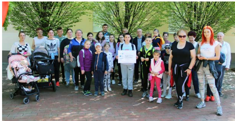
A programon résztvevők a település történetével is megismerkedhettek

Van úgy, hogy az ember tervez. Eltervezi, hogy csodaszép időben, hasonló érdeklődésű emberekkel felfedezi a természet kincseit. Majd az időjárás úgy dönt, hogy az eddig hiányzó csapadékot a program hetében bepótolja és akadályt gördít a tervek elé.