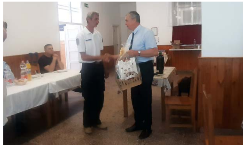
Elismerések és jutalmak átadásra kerültek