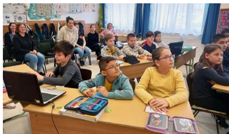
A nyílt napon láthatták, hogy mennyire megfér egymás mellett a technika és a hagyomány

Tartalmas, jó hangulatú, változatos tanóráknak lehettek szemtanúi, akik ellátogattak a Dobozi Általános Iskola nyílt napjára április 11-én. Természetesen elsősorban a beiskolázás előtt álló, nagycsoportos óvodások szüleit vártuk, de szeretettel fogadtunk minden érdeklődőt.