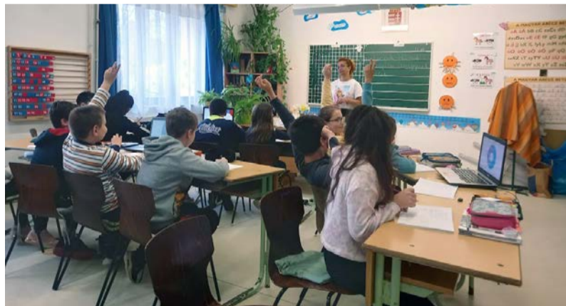
A gyerekek aktívan, lelkesen vettek részt a tanórákon

egyénre szabott oktatást, ösztönzést kapjon, önmagához képest fejlődjön. Ennek voltunk szemtanúi a nyílt órákon, melyeken a gyerekeket nem feszélyezte a sok figyelő szempár: aktívan, lelkesen vettek részt a tanórákon.