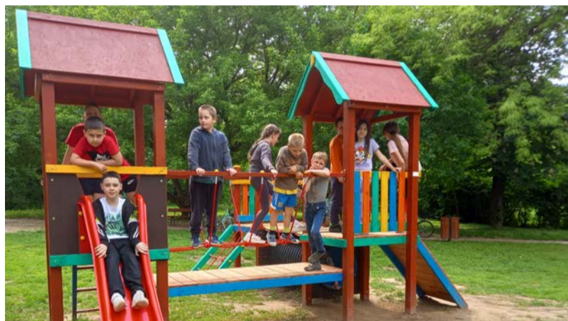
A gyerekek teljes biztonsággal használhatják az eszközöket

Megérkezett a Kastélyparkban lévő játszótér használatba vételi engedélye, így a gyermekek most már teljes biztonsággal használhatják az eszközöket. Fontos kiemelni a játékok rendeltetésszerű használatát, hogy minél tovább élvezhessék a gyerekek a megújult játszótér. A nagyobb biztonság érdekében a területet ketté szelő járda lett helyezve. A közös tulajdon védelmében folyamatban van a biztonsági kamerarendszer kiépítése. Fontos hangsúlyozni, hogy a játé-