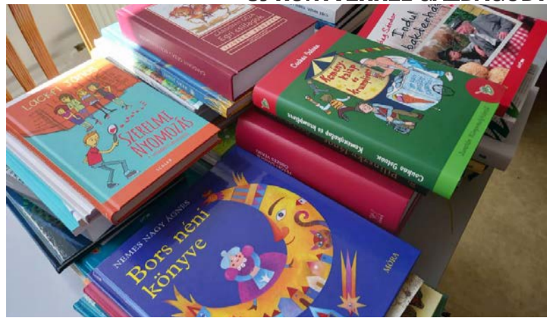
A megnyert könyvcsoport 46 db különböző művet tartalmaz

„Erővel olvasni. Néha nagyobb erővel olvasni, mint amilyen erővel az írás készült, melyet olvasol. Ábítással, szenvedéllyel, figyelemmel és kérelmetlenül olvasni. Az író fecseghet; de te olvass szűkszavúan. Minden szót, egymás után, előre és hátra hallgatódzva a könyvben, látva a nyomokat, melyek a sűrűbe vezetnek, figyelni a titkos jeladásokra, melyeket a könyv írója talán elmulasztott észlelni, mikor előrehaladt műve rengetegében.