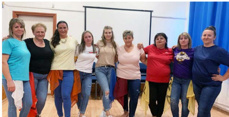
A bölcsőde dolgozói meglepetés műsorral is készültek

Idén sor került a X. Bölcsi Bál megrendezésére. Nagy öröm volt számunkra, hogy ennyien eljöttek, és részt vettek ezen a báli estén. Amikor sorra kerül a bálunk megszervezése, mindig Bőjte Csaba gondolata jut eszembe: „Aki nem hisz abban, hogy mennyi jó ember van, az kezdjen el valami jót csinálni és meglátja milyen sokan mellé állnak.”, ez megerősít abban, hogy hinni és bízni kell mindenben. A bál célja: a bevételt egy közösen meghatározott célra fordítsuk a bölcsődei gyermekek javára.