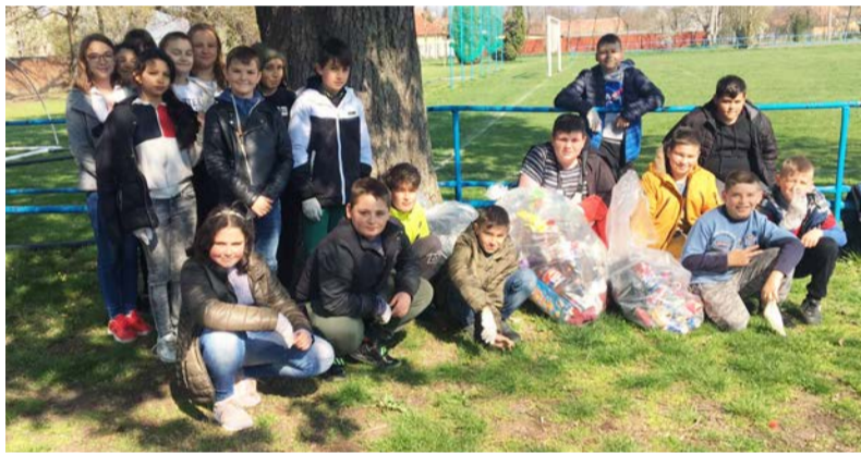
A munkából mindenki kivette a részét