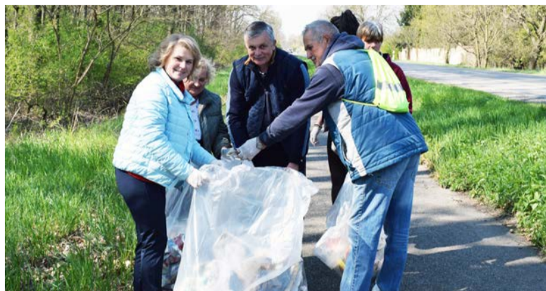
Kül- és belterületen is folyt a munka

Április 21-én Dobozon, ismét megrendezésre került a tavaszi hulladékgyűjtési akció.