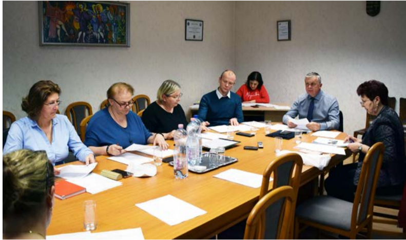
A testület április 28-án tartotta ülését

Doboz Nagyközség Önkormányzatának Képviselő-testülete 2022. április 28-án tartotta munkaterv szerinti testületi ülését, melyen a napirendi pontok a következők voltak: