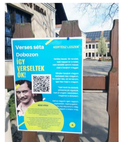
A felhívás plakátja