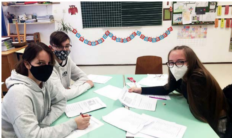
A feladatok megoldása közben

A Körös-Maros Nemzeti Park Igazgatósága az idei évben már a XVIII. Őszirózsza Természetvédelmi Vetélkedőt hirdette meg az általános iskolás diákok részére. A verseny a Dévaványa környéki, szí-