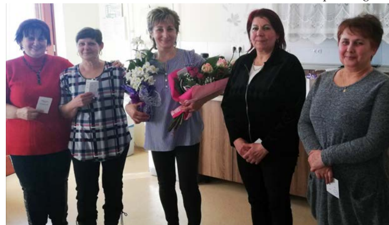
A nyugdíjba vonult munkatársak