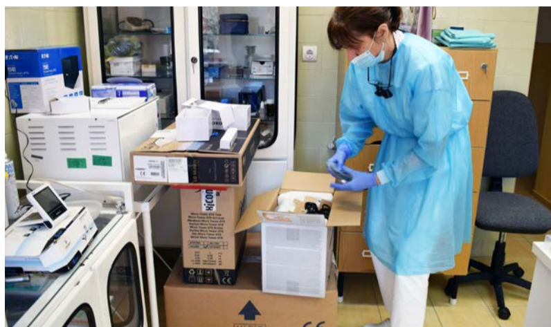
A beszerzett eszközök kicsomagolása

2019-ben Doboz Nagyközség Önkormányzata a Magyar Falu Program „Orvosi eszköz” című MFP-AEE/2019 kódszámú pályázatában 5.066.696 Ft támogatást nyert.