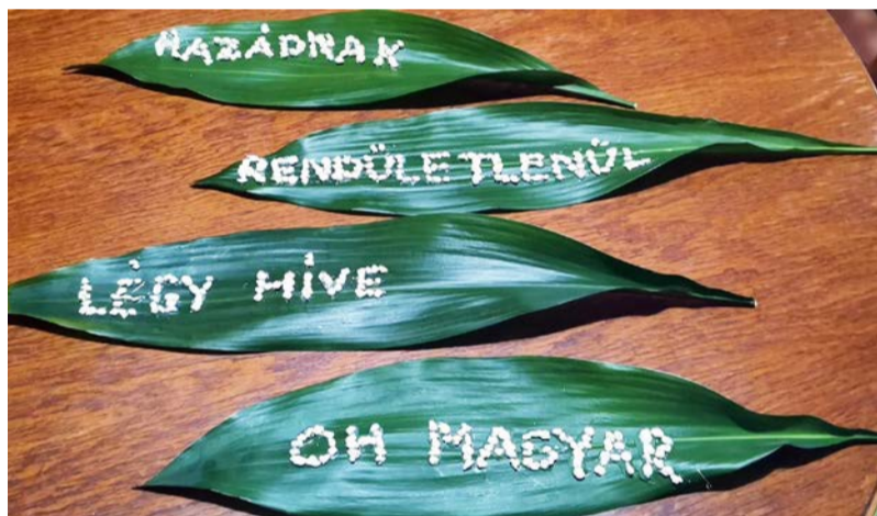
A gyerekek kiélhették kreativitásukat