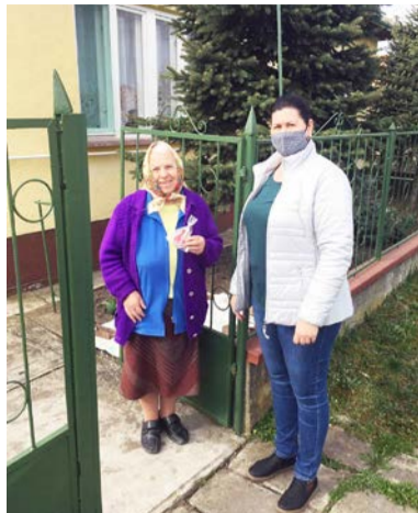
Mézeskalács tojás átadása

Húsvét alkalmából a dolgozók saját kézzel készített mézeskalács tojással kedveskedtek minden ellá-