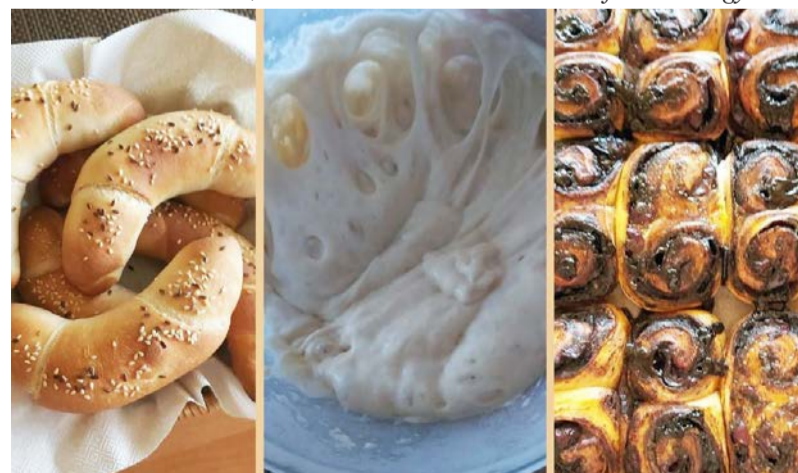
Az elkészült péksütemények

Zárásként egy mondattal szeretném jellemezni a lakóhelyem: mindenünk van, ami szerethető.