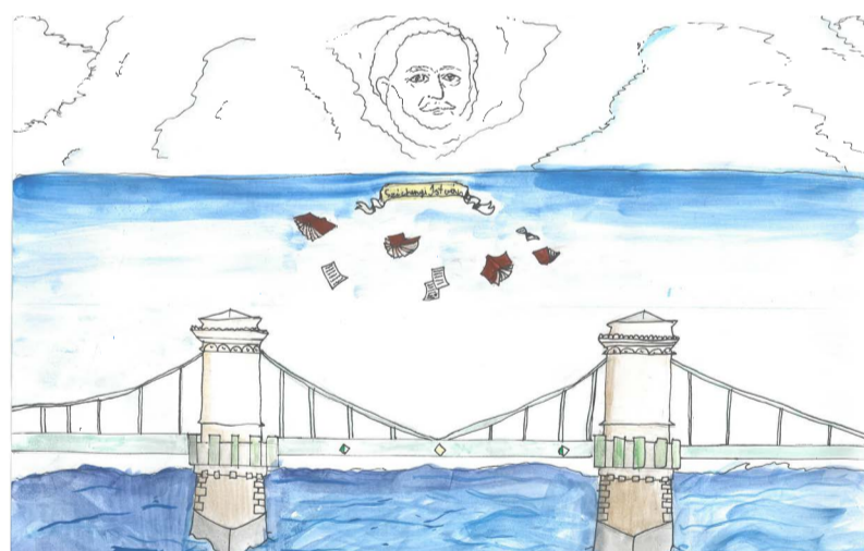
Óré Bojana Panna „Valóra vált álom”