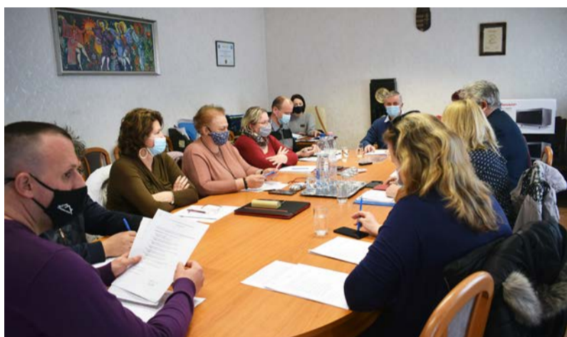
Egyeztető megbeszélés a Képviselő-testület tagjai között

Doboz Nagyközség Önkormányzatának Képviselő-testülete 2021. március 29-én tartotta meg egyeztető megbeszélését. A napirendi pontok a következők voltak: