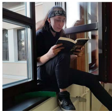
Olvásás minden pozícióban

Különleges pályázatra várta olvasóit a Békés Megyei Könyvtár. „Mutasd meg, milyen vicces pozícióban vagy különleges helyen lehet könyvet olvasni! Készíts fotót, majd küldd el nekünk! Egy személy egy fotóval pályázhat. A legötletesebb felvételt díjazzuk! Kérjük, vigyázz saját és társaid testi épségére!” Az Extrém olvasás fotópályázatra Ór-