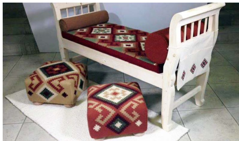
A kreativitás és az alkotás egyfajta terápia