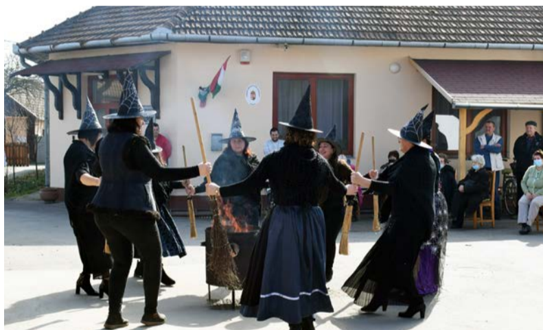
Rendhagyó farsang a Gondozási Központban

Ebben a hónapban az idősöknek megpróbáltunk színes farsangi programokat szervezni. Sajnos a koronavírus járvány megjelenése óta a szokásos nagy rendezvényeket nem tudtuk megtartani, mint az idei farsangot sem. Ezért rendhagyó módon mindenféle járványügyi szabályok betartása mellett három napos programot állítottunk össze számukra. Első nap a régi farsangi videó felvételeket nézhatték meg, második nap farsangi csörögefánkkal vendégeltük meg belátogató klubtagjainkat, harmadik nap pedig az udvaron kiszabáb égetésével üztük el a telet. Fánkot, forró teát és forralt bort fogyaszthattak. Ebben a megpróbáltatásokkal teli időszakban sokat vannak egyedül mindenféle szabályok betartása miatt, egészségük megóvása érdekében. Nagy a veszélye az elmagányosodásnak. Próbáljuk megtartani a közösséget, a korlátozások mellett is fontosnak tartjuk időseink testi-lel-