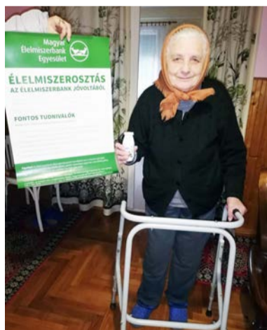
547 csomag került kiosztásra

Örömmel vettük tudomásul, hogy ez év márciusában az Élelmiszerbank jóvoltából ismét tartós élelmiszereket oszthattunk Doboz rászoruló lakosainak. 910.346 Ft értékben kapott a Doboz Gondozási Központ élelmiszer adományt, amit 547 fő részére tudott eljuttatni. Az Élelmiszerbankkal kötött