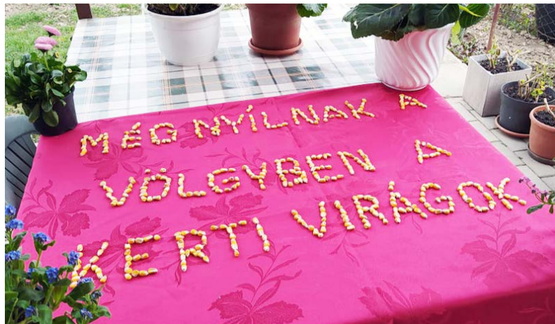
A meglevenedett versek egyike

József Attila születésnapján ünnepeljük a magyar költészet napját. Az esetek többségében szavalóversennyel állítunk emléket a költőnek, tisztelgünk a költészet, a versek előtt. Idén már második alkalommal kellett más utat keresni és találni a költészethez.