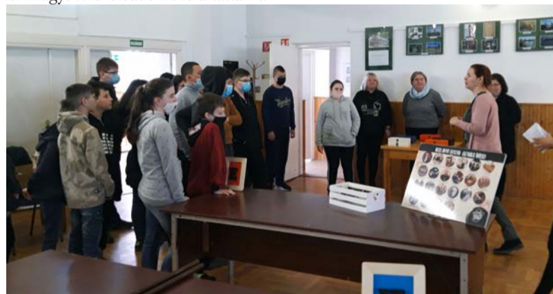
Békés Megyei Geocaching