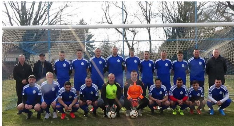
A Dobozói SE felnőtt csapata