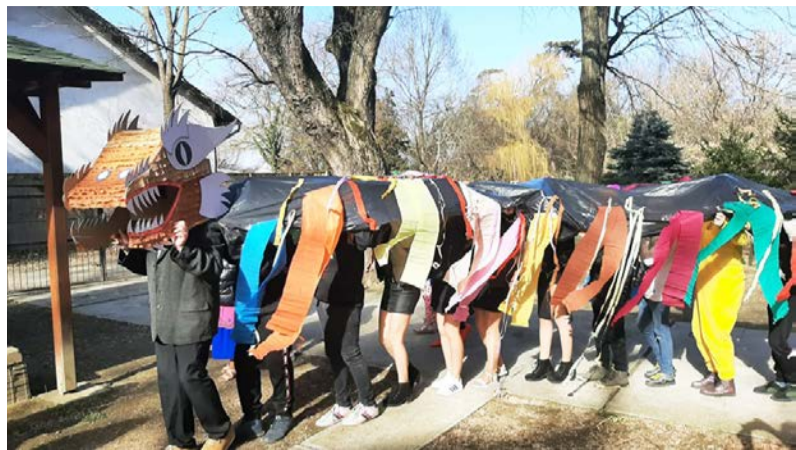
A 6. osztályosok által készített sárkánykígyó

Iskolánkban a korábbi évektől eltérően – de a tavalyihoz hasonlóan – tartottuk meg a gyerekek által egyik leginkább várt és kedvelt eseményt, a farsangot. Február 18-án egy igazán kreatív és hangulatos farsangi napot szerveztünk és valósítottunk meg. Mivel sajnos a még mindig jelen lévő vírushelyzet miatt együtt, nagy létszámban a művelődési házban nem tudtunk ünnepelni, ezért az iskola épülete adott helyt a rendezvénynek.