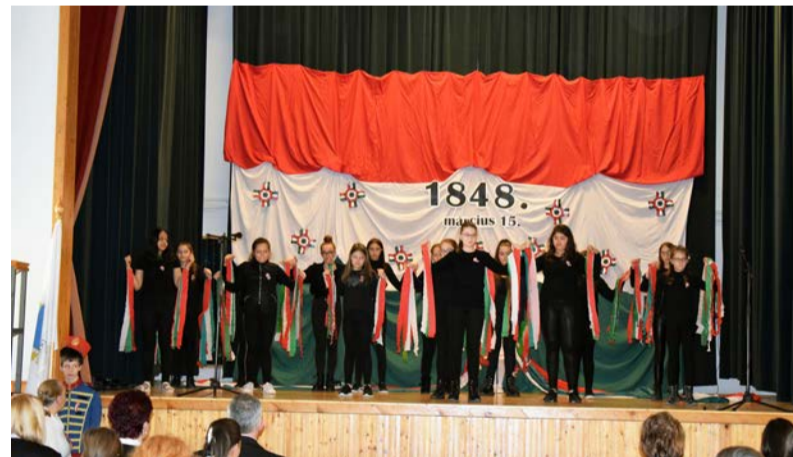
A tanulók ünnepi műsora

emlékezünk, hanem arra is, hogy ezen a napon született meg a modern parlamentáris Magyarország. Csak úgy lehet eredményeket elérni és tetteket véghezvinni, ha a jobbító szándék mögé állva összefogunk és annak