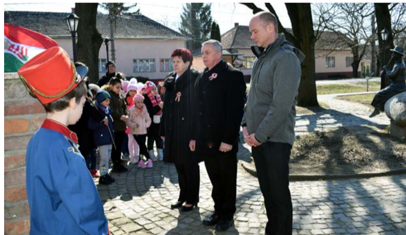
Koszorúzás a Kossuth téren

Idén is megemlékeztünk a magyar történelem egyik legmeghatározóbb eseményéről, az 1848/49-es forradalom és szabadságharc 174. évfordulója alkalmából. Az ünnepségnek a Dobozi Községi Ház és Könyvtár adott otthont, melynek vendégei voltak a Képviselő-testület tagjai, a település intézményeinek vezetői és dolgozói, szülők, valamint az iskola diákjai.