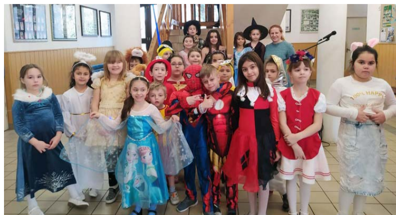
Az alsósok is jelmezbe bújtak

A népi rigmusnak eleget téve maskarába, jelmezbe bújtunk mi is, alsó tagozatosok, a farsang alkalmából. A délelőtt folyamán az osztályterekben kezdtük a télűzést, hangoskodás formájában. Ezt követte a jelmezbemutató, melynek során felvonulhattak a jelmezesek, bemutatva ötletes, színes öltözé-