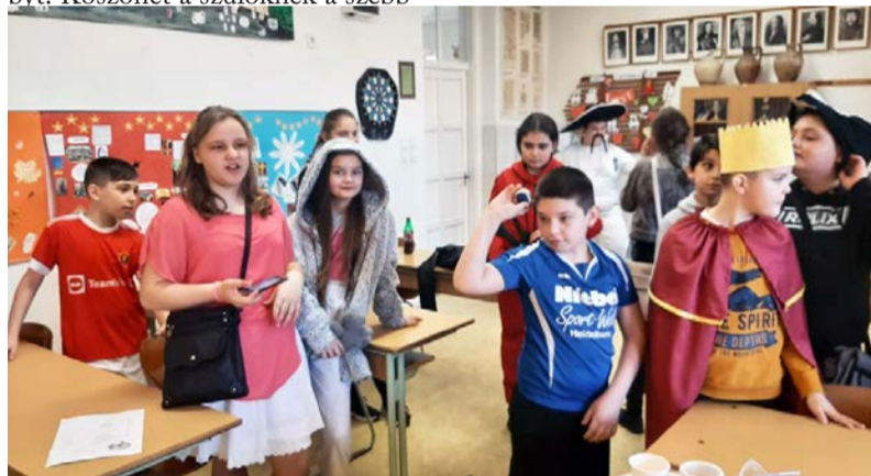
Különbözö feladatok és játékok várták a diákokat

változatos, a diákokat megmozgató feladatok (fánkra dobó verseny, Fánkfaloda társasjáték, álarckészítés, online Kahoot vetélkedő, kvízzjátékok), és természetesen az, hogy jelmez is ölthettek a fiatalok, ami mindig pozitív irányba dobja fel a hangulatot. Voltak hagyományos, megszokott jelmezek (pl. királynő, tündér, ördög), de köszönhetően a gyerekek sorozatimádatának, már modernbb szerkőban is megjelentek néhányan. Például élőben, közvetlen közletről csodálhattuk meg A nagy pénzrablásból vagány Tokiót, és a Peaky Blinders rettegett bandavezérét, Tommy Shelbyt. Köszönet a szülőknek a szebb-