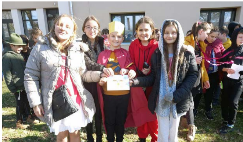
Több csapat vett részt a versenyen