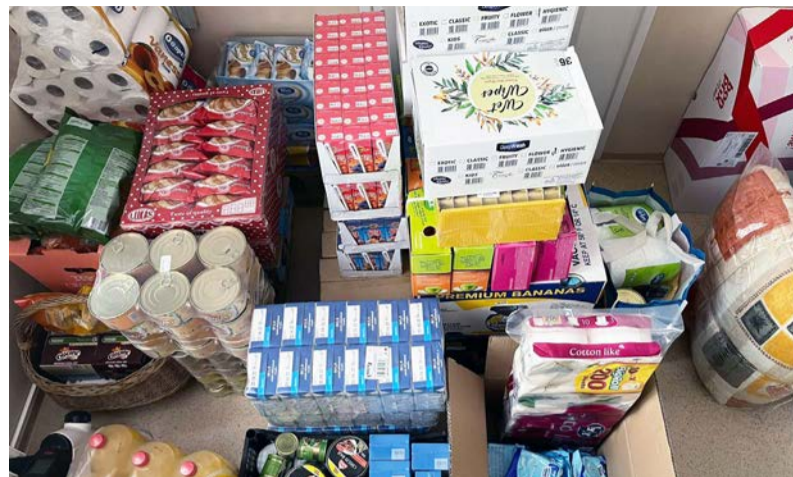
A gyűjtési akció továbbra is tart

Szép számmal gyűlnek az adományok, amit Doboz Nagyközség Önkormányzata az ukrajnai háború miatt menekülni kényszerülő nehéz helyzetben lévő emberek számára gyűjt. A gyűjtési akció első hetében felajánlott adományokat a Református Szeretetszolgálat részére továbbítottunk. A második héttől összegyűlt adományokat a Magyar Vöröskereszt Békés Megyei Szervezete részére adjuk át folyamatosan, akik eljuttatják a bajba jutottakhoz.