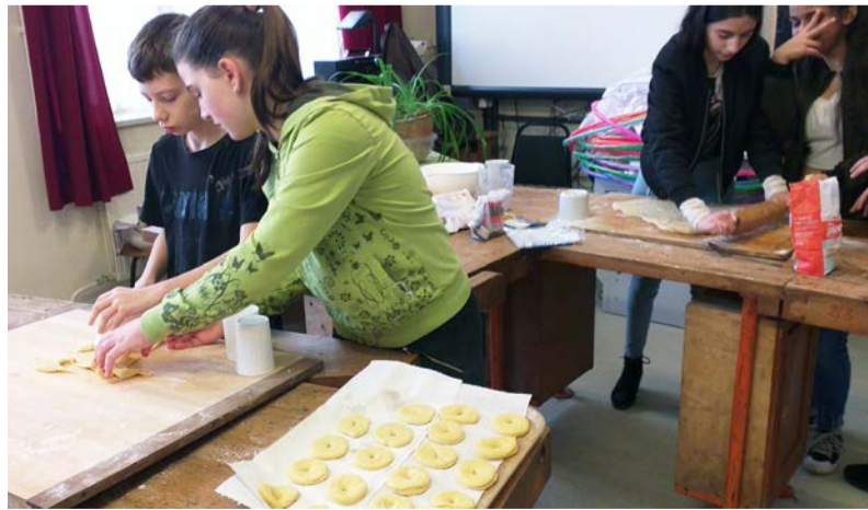
Fánksütő verseny az iskolában

A hatodik fánksütő versenyen – a zsűrizést követően – a következő