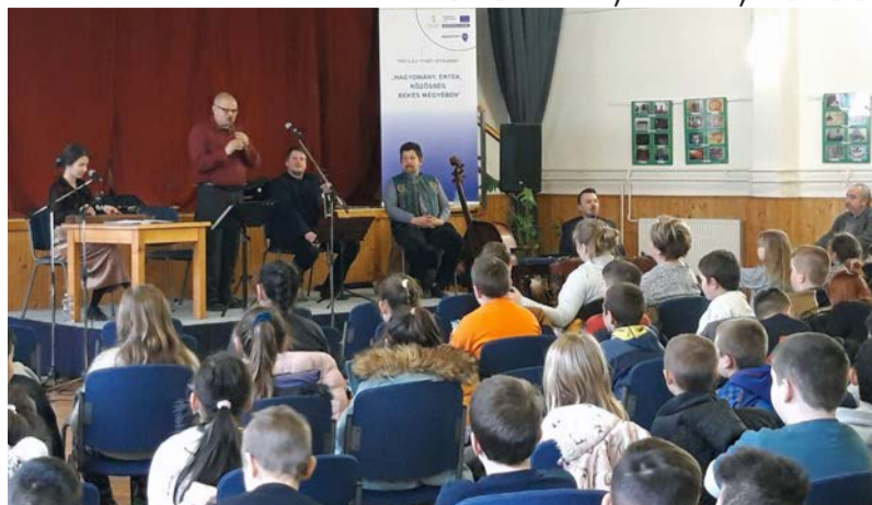
Népzenei koncert a Községi Házban

Hagyomány, Érték, Közösség "Hagyomány, Érték, Közösség Békés megyében" a címe a Békés Megyei Önkormányzat pályázatának, melynek célja a megyei identitás fejlesztése, a megyei közösségek létrehozása, a megyei értékekről bővebb ismeret és információ nyújtása a lakosság számára. A projekt keretében két program valósult meg a Dobozói Községi Ház és Könyvtárban.