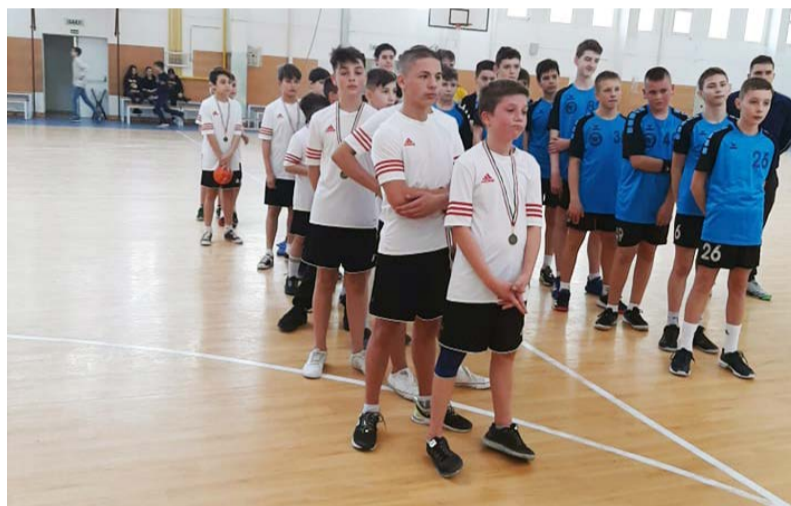
A gyerekek szívvel-lélekkel küzdöttek

A Diákolimpia tavaszi fordulóján vett részt iskolánk kézilabda csapata 2022. február 17-én, Békéscsabán. Izgalmas mérkőzéseket vívtunk, a gyerekek szívvel-lélekkel küzdöttek, nagyon jól érezték magukat.