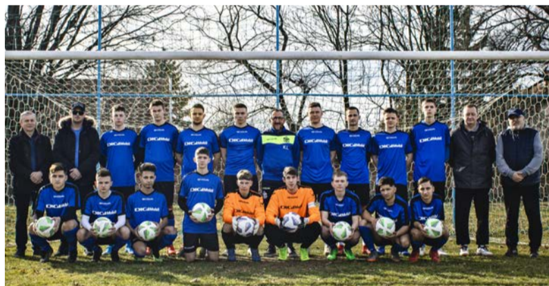
A Dobozói SE ifi csapata

A Dobozói Szabadidős Tömeg- és Versenysport Egyesület mindkét szakosztálya új felszerelésben kezd meg a 2021/22-es versenykiírás tavaszi idényét.