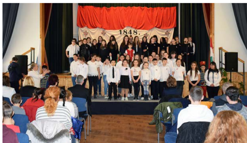
Méltóképpen emlékeztünk az 1848-as eseményekre