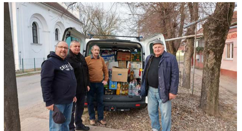
1 tonnányi élelmiszer és vegyiáru gyűlt össze

Az elmúlt hetek szomorú aktualitása, az a történet, ami a szomszédos Ukrajnában zajlik, ami biztonságérzetünket, megszokott életünket, a jövőről való gondolkodásunkat teljesen felborítja. Azt gondolom, mindannyian elmondhatjuk; szeretjük a meglepetéseket, de nem az ilyen jellegűeket. Könnyes szemmel, aggódó lélekkel, és értetlenül állunk az események felett. Szeretnénk valahogy beilleszteni a történeteket a világról alkotott képünkbe. Az iskolai történelem órák világába, még csak valahogy be tudjuk tuszkolni, -igen, a távoli idők világának valahogy része volt, hogy történetek szörnyűségek. De civilizált korunkban, az agresszió, az erőszak nem jelenthet megoldást semmiféle problémára. Mindennek ellenére ez mégis szomorú aktualitás.