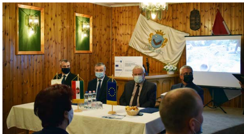
A hivatalos átadó január 26-án került megrendezésre