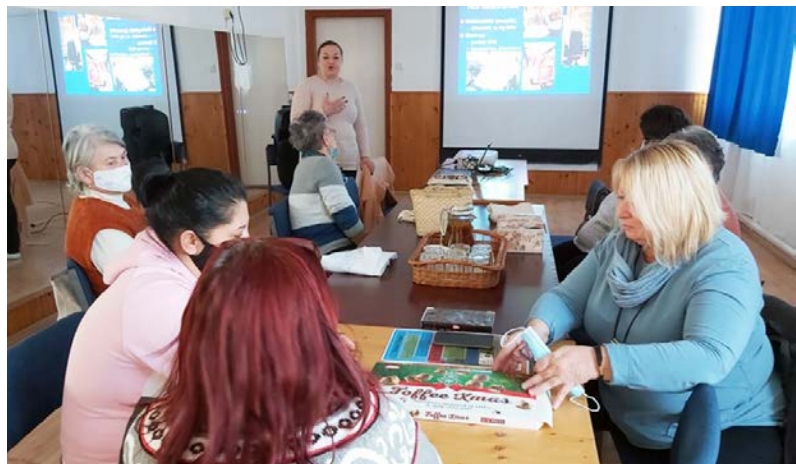
Filmvetítés a Közösségi Házban

Az idén XVIII. alkalommal barangoltunk együtt a magyar kultúra kincsestárában mindazokkal, akik ellátogattak a Dobozi Közösségi Ház és Könyvtárban megrendezett programjainkra.