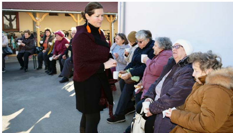
A program látogatói fánkot és teát is fogyaszthattak

Ebben a hónapban az időseknek megpróbáltunk színes farsangi programot szervezni. Sajnos a koronavírus járvány megjelenése óta a szokásos nagy rendezvényeket nem tudtuk megtartani, ezért az idejű farsangot sem.