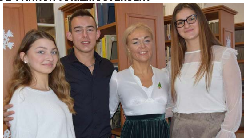
A győztes csapat tagjai

Az egyetem zsűrije a békéscsabai diákok csapatát ítélte a legjobb-