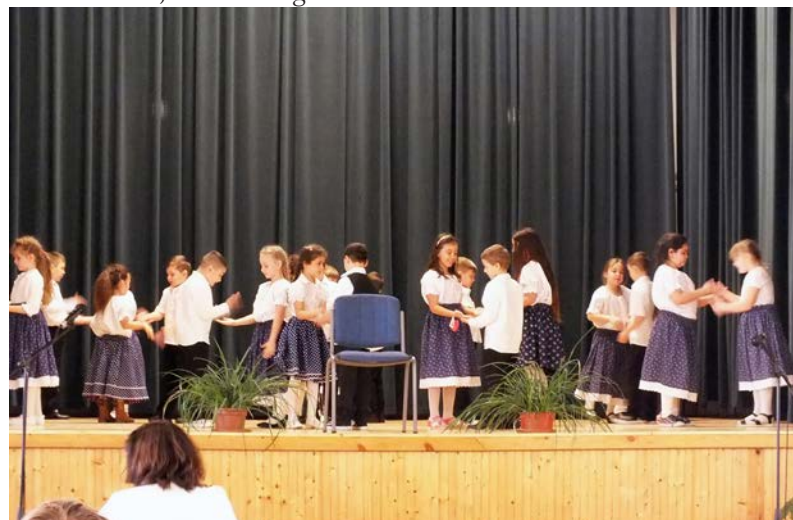
A diákok táncbemutatója