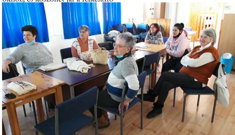
Nyílt nap a hímző szakkör foglalkozásán