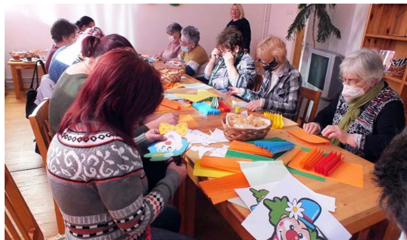
Varázsközök Köre foglalkozás közben

A farsangi időszak legjellegzetesebb édessége és egyben ételle a farsangi fánk. Garantáltan még a legnagyobb akaraterevel rendelkezők sem bírják ki, hogy legalább farsangi időszakban ne csábuljanak