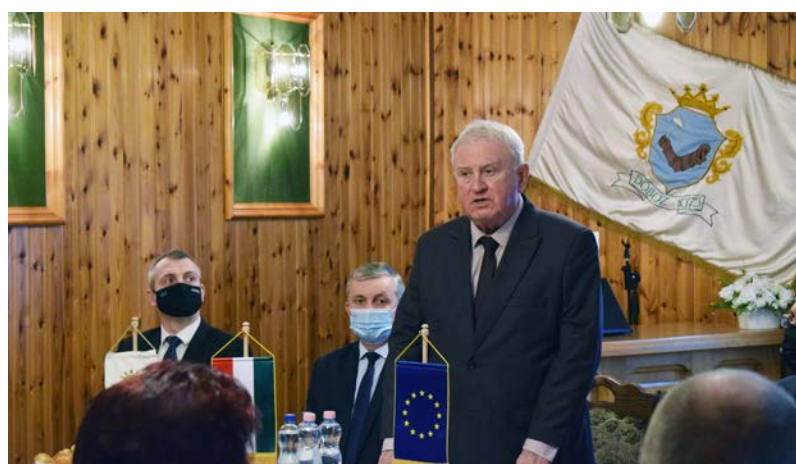
Dr. Kovács József országgyűlési képviselő támogatta a projekt megvalósulását