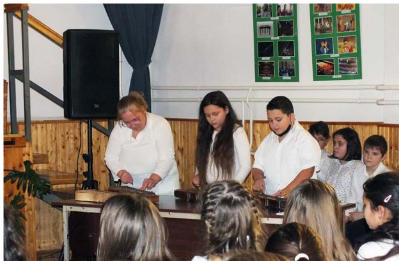
Hangszeres produkciókban is többen jeleskedtek