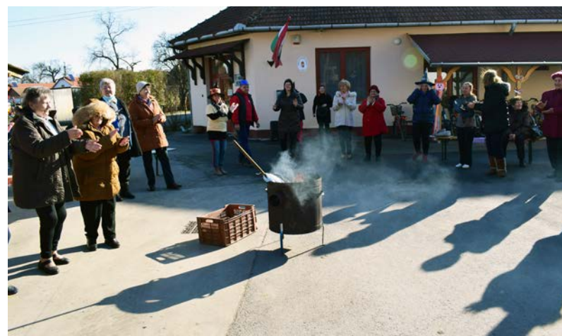
Kiszabáb égetése az udvaron