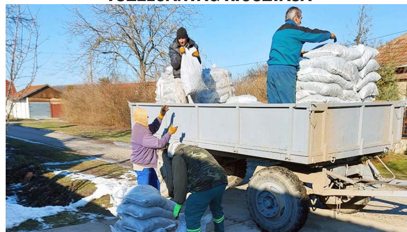
Összesen 1465q szén került kiosztásra