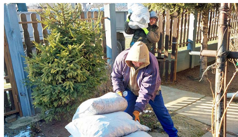
292 fő részesült a támogatásban