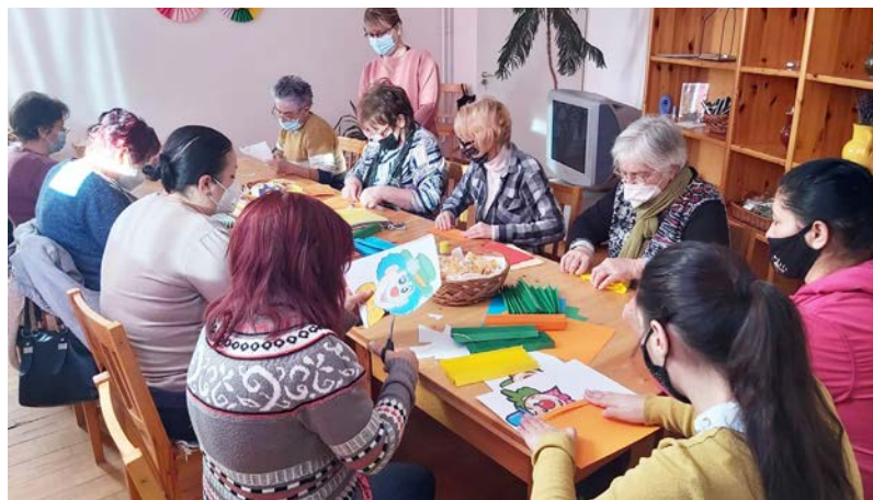
Farsangi díszek készítése

Négynapos eseménysorozatunk keddi napján „Farsangra hangoló varázslat” elnevezésű rendezvényünkön, a Varázsközök