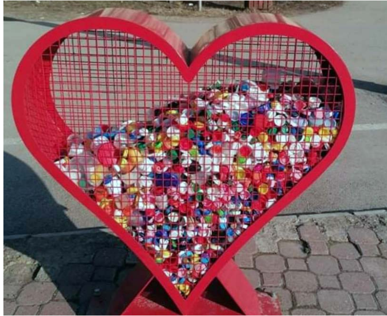
A kupakgyűjtőszív a Dobozi Közösségi Ház és Könyvtár előtt található

Valamiért, ki tudja miért az életünkbe a meseszövés rendszeresen visszatér. Az élet néha olyan feladatot ad az ember fiának, vagy picike lányának, mellyel megküzdeni