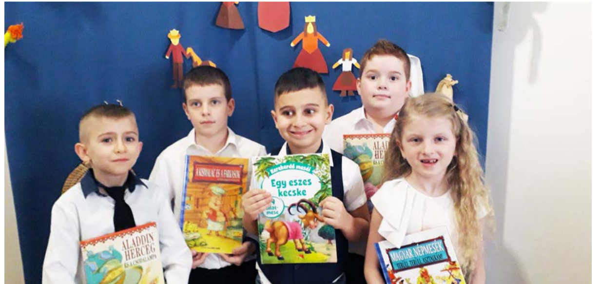
1-2. évfolyam helyezettei

Ebben a tanévben a mesemondó versenyt is nagymértékben befolyásolta a koronavírus okozta különleges helyzet. Nem mehetünk külső helyszínre, ezért az iskola könyvtárában rendeztük meg, sajnos a szülők jelenléte nélkül. Azon igyekeztünk, hogy a gyerekek minél kevésbé érezzék ennek hiányát. A díszletként felállított paravánt benépesítettük meseszereplőkkel (király, királyné, lovacska, kutya, egér, kukac), akik a kis mesemondók közönsége lettek. Fontosnak tartjuk, hogy a többi tanuló is élvezhesse a mesék szépségét, a gyerekek tehetségét, ezért az adott évfolyam tanulóit is helyet kaptak a közönség soraiban.