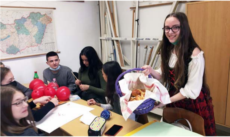
Rendhagyó évhez, rendhagyó program társult

A farsang vízkerezzel kezdődik és a nagybőjt kezdetével zárul. Ezt az időszakot vidám lakomák, mulatságok jellemzik. Idén a farsangi mulatságot is át kellett szervezni, ezért forgószínpadszerű program várta a felsősöket február 5-én a farsang alkalmából. A különböző helyszíneken a farsang eredetével, történetével, céljával,