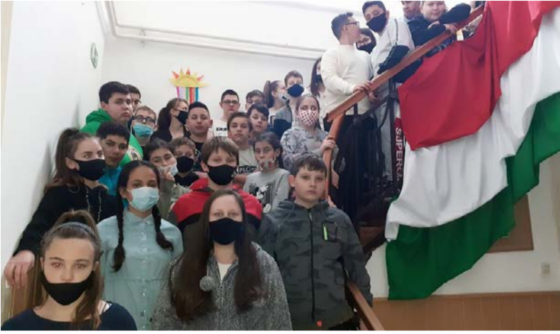
A közös szavalás

Tanulmányainkból tudjuk, hogy Kölcsey Ferenc 1823. január 22-én, csekei birtokán fejezte be a Himnusz írását. Ekkor dátummal látta el, és többé nem változtatott rajta. A Himnusz megírásának évfordulója 1989 óta a magyar kultúra napja. Ez alkalomból a Dobozi Általános Iskola minden tanulója