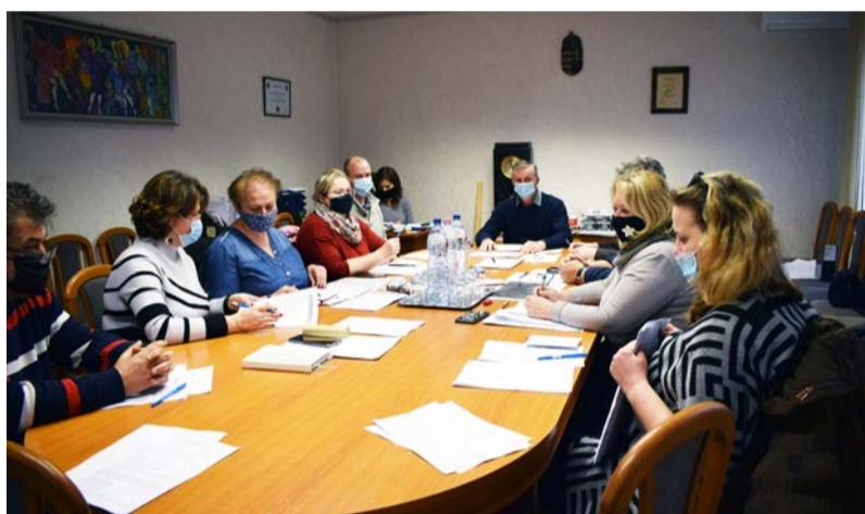
Egyeztető megbeszélés a Képviselő-testület tagjai között

Doboz Nagyközség Önkormányzatának Képviselő-testülete 2021. január 25-én tartotta meg egyeztető megbeszélését. A napirendi pontok a következők voltak: