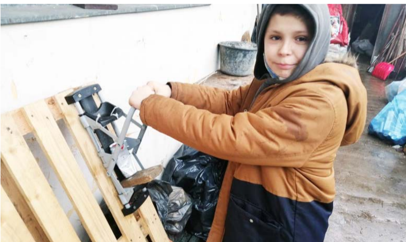
A fémdobozok préselése

A Dobozi Általános Iskola Ökoiskolaként kiemelt figyelmet szentel a környezetvédelemre. Évek óta gyűjtjük a papírt, elemeket, fémhulladékot, mely sok pozitív élménnyel, valamint ajándékokkal gazdagították az intézménybe járó tanulókat. Ennek örömeire a további környezettudatosságra nevelés keretén belül, elindítottuk az alumínium tartalmú fémhulladékok gyűjtését, mely az intézményben már folyamatossá vált. Az iskolába járó gyerekek pozitívan fogadták az új kezdeményezést, és saját energiájukat nem kímélve segítik a fémdobozok préselését. Ennek következtében már nyolc zsák préselt fémhulladék került elszállításra a