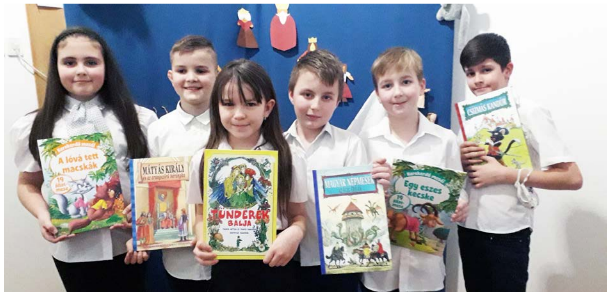
3-4. évfolyam helyezettei