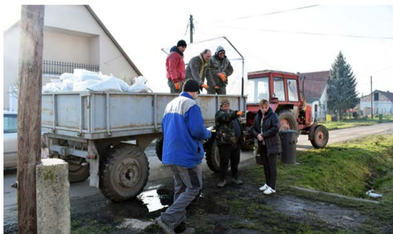
Folyamatos a kiszállítás

2021. január elején megkezdődött a szociális tüzelőanyagok kiszállítása a háztartásokba. Az önkormányzat 1563 mázsa szén vásárlására kapott támogatást, melyből a Szociális és Gyermekek Bizottsága döntése alapján az arra jogosultak 4 mázsát kapnak. A kérelmek beadására, január 25-ig