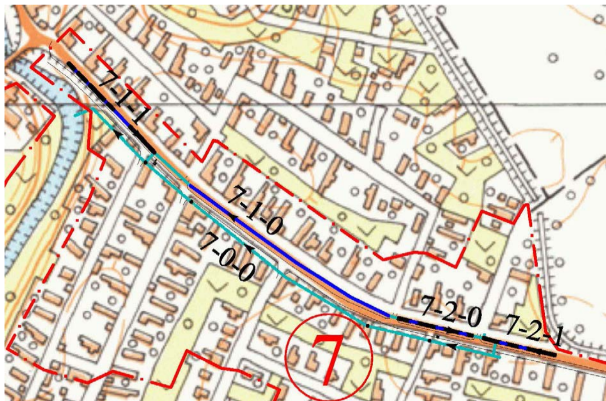
Nagyvárad utca 1-9 sz., 11-27. sz., 29-35. sz., 35-37. sz. közötti szakasz

A 2019-ben meghirdetett Települési környezetvédelmi infrastruktúra-fejlesztések című felhívásra benyújtott, TOP-2.1.3-16-BS1-2019-00034 azonosítószámmal nyilvántartott támogatási kérelmet a Pénzügyminisztérium 127.000.000 Ft. összegű támogatásra érdemesnek ítélte.