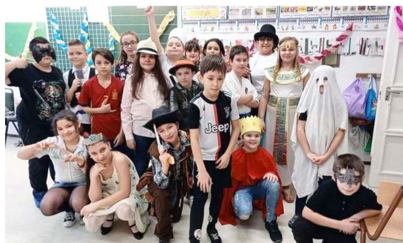
Különféle jelmezekben vonultak fel a gyerekek

A farsangi időszak vízkeresztől húshagyó keddig tart, ebben az időszakban lehet a farsangi multságokat megrendezni. A maszkarázás farsangkor olyan szokás, amire szüksége van mindenkinek, a felnőtteknek és a naponta iskolába járó gyermekeknek is. Ugyanis minden ember szeretne egyszer más bőrébe bújni, másnak lenni. Erre remek alkalom a farsang.