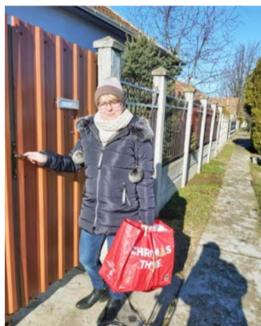
A könyvet kérésre házhoz is kiviszik a könyvtár dolgozói

November 11. óta ismét zárt ajtók mögött dolgozik a Dobozi Községi Ház és Könyvtár is. A nem megszokott munkahelyzet, a közösségek nélküli lét, számunkra sem könnyű, de igyekezünk áthi-