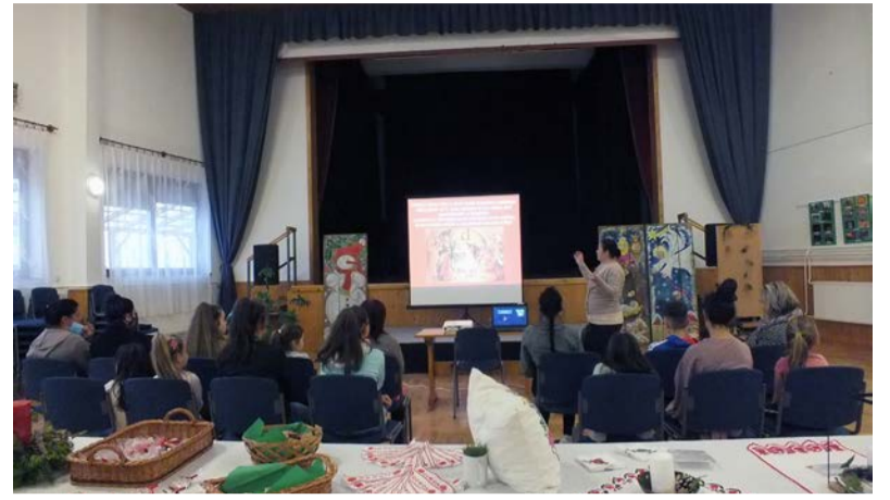
Filmvetítés a Községi Házban

Pénteken került sor az utolsó adventi gyertya meggyújtására az általános iskola udvarán, miután megnéztük az iskolások zenés, fényjátékos előadását. Az este végén a Dobozi Általános Iskola tanulójának gyönyörű zenés ünnepi műsora a Dobozi