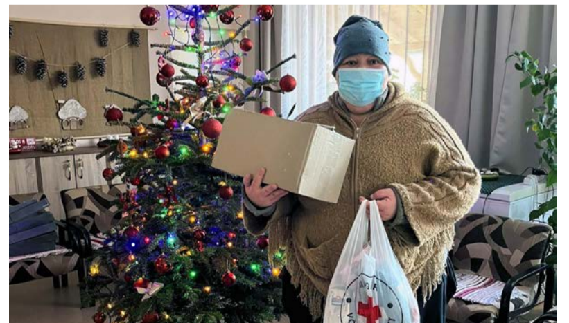
Az adományokat rászoruló családok és a Dobozi Gondozási Központ ügyfelei közt osztottunk szét

Hálásak vagyunk minden kedves vásárlónak, akik részt vettek az idei élelmiszergyűjtő akcióban. A vásárlókat egy lista segítette, amelyen az adományozás szempontjából leghasznosabb termékek voltak feltüntetve.