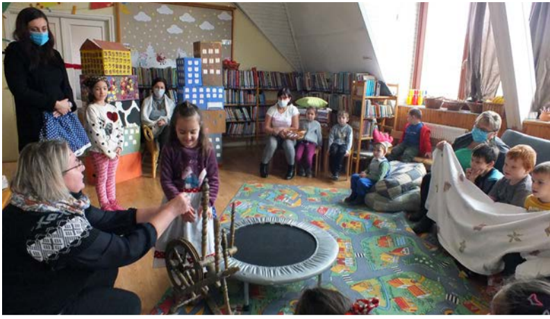
Mosolygós arcok, fergeteges alakítások jellemezték a közös előadást

2021. december 13-17-ig a Dobozi Községi Ház és Könyvtár dolgozói a Karácsony-váró Hét programjaival igyekeztek ünnepi hangulatot varázsolni mindazok szívébe, akik ellátogattak rendezvénysorozatunk eseményeire.