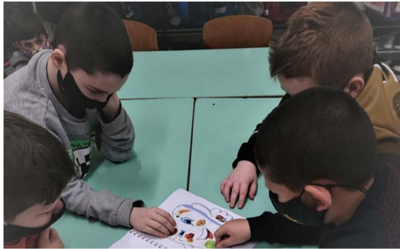
A vetélkedő fő témája az egészséges életmód volt

Immár több éves hagyomány, hogy a Dobozi Általános Iskolában november hónapban megrendezésre kerül az Egészségügyi vetélkedő. Ebben a tanévben a világvárványra való tekintettel az alsós korcsoportban osztályszinten zajlott a közösséget építő, tanórán kívüli tevékenység. A gyerekek életkoruknak megfelelő feladatokat kaptak. A