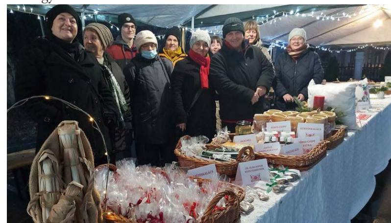
Az ünnepség rendezői

DAREH BÁZIS HULLADÉKGAZDÁLKODÁSI NONPROFIT ZRT.