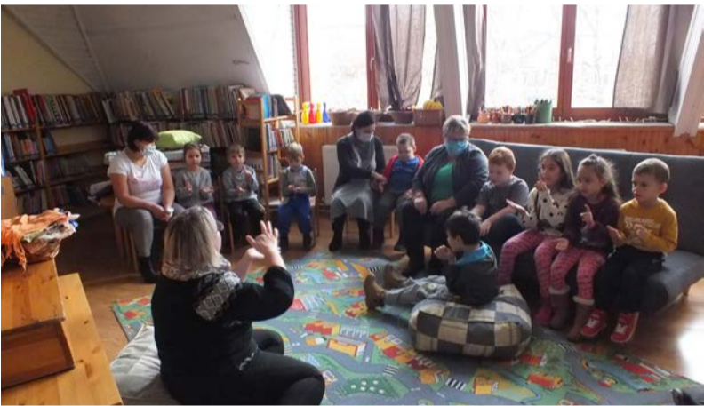
Mesés délelőtt az óvodásokkal

tődő népszokásokat és hiedelmeket ismertettük meg a fiatalokkal. Vetítettünk egy érdekes kisfilmet is hozzá. A gyerkőcök megnézheték a hungarikum fotó-, a kalocsa és matyó hímzésünkéből készült kiállításunkat is. Majd a hétfői program záróakkordjaként elültettük mi is a szerencsehozó, bőségvarázsló Luca búzáunkat a fiatalokkal közösen.