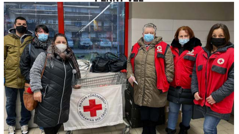
250 kg tartós élelmiszert, édességet, valamint tisztító- és tisztálkodószert gyűjtöttek össze

A Magyar Vöröskereszt idén is folytatja az élelmiszereket és tisztálkodási szereket gyűjtő kampányait és immár második alkalommal partnere ebben a PENNY. A karitatív szervezet lelkes önkéntesei ezüstvasárnap előtt két napon át, az ország számos megyéjében várták a vásárlók adományait a PENNY 119 áruházánál elhelyezett gyűjtő pontokon.