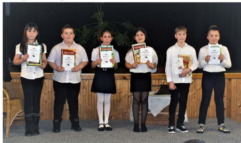
Az 3-4. osztályos tanulók díjazottjai

Ezekkel a gondolatokkal indult az idei iskolai mesemondó verseny 2022. január 20-án a Dobozi Közösségi Ház és Könyvtár nagy termében a magyar kulturális hét keretén belül, melynek címe: Barangolás a magyar kultúra kin-