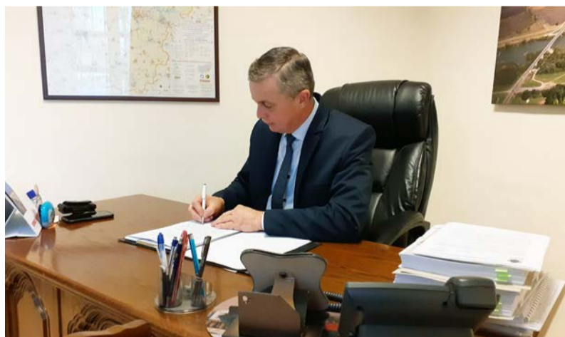
Interjú Köves Mibály polgármesterrel