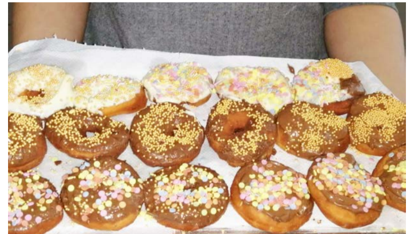
Az elkészült fánkok