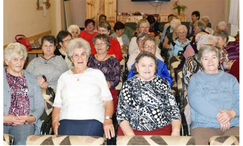
Idősek klubja találkozó

A 2020-as év a mi munkánkban is sok változást hozott. Voltak az évek boldog és szomorú szakaszai is. A járvány miatt sokban változtak a már megszokott programjaink. A hagyományos nagy rendezvényeink közül volt, ami sajnos elmaradt, de helyette más időpontban új helyszínen tartottunk rendezvényeket. Ilyen volt a Szanazugban megtartott zenés összejövetel, amire már mindenki nagyon vágyott, valamint az idősek világnapja alkalmából a Libás tanyán tartott ünnepségünk. Mindkét helyszínen betartottuk az aktuális járványügyi szabályokat.