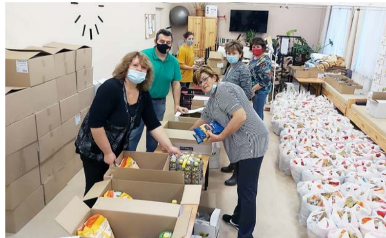
Az adományosztás pillanatai

Intézményünk több lépcsőben pályázott a Magyar Élelmiszerbank Egyesületénél, tartós élelmiszer adományra. A feltételeknek sikerült megfelelnünk, ezért évente többször lesz lehetőségünk tartós élelmiszer csomagot osztani. Az összeállított csomagok nem lejárt szavatosságú termékeket tartalmaznak, az is előfordulhat, hogy nem az aktuális ünnepkörnek megfelelő csokoládé figurákkal találjuk szembe magunkat. Az ünnepek előtt 508 ilyen csomag került kiosztásra. Nem kevés szervező munka és logisztika előzte meg ezt az akciót. A termékeket minden esetben Budapestre kell Dobozra szállítani. Az útiköltséget Doboz Nagyközség Önkormányzata, a megfelelő nagyságú járművet pedig egy magán-személy biztosította. Kollégáink