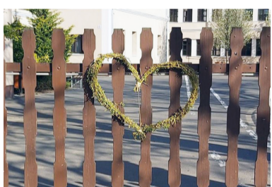
A kapura tett szívvel erőt, bátortást igyekeztünk nyújtani tanulóinknak

A Dobozi Általános Iskola rajz és versíró pályázatának eredményeiről májusban számoltunk be. Akkor bemutattuk a dobogós alkotásokat. Azonban a zsűri hangsúlyozta, hogy a további pályamunkák is érdemesek arra, hogy mindenki megismerkedhessen velük.