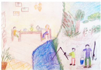
Pribojszki Zsombor 3. a rajz