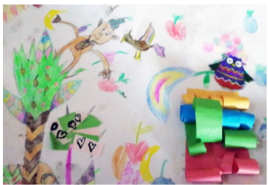
Behrami Amélia 2. a rajz