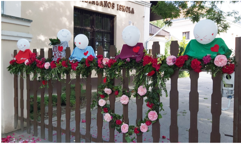
A feldíszített iskolakapu