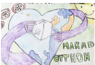
Simon Szelina 2. a rajz