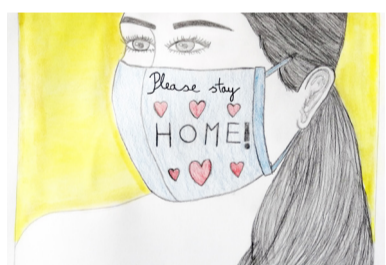
Szatmári Eszter 8. a rajz