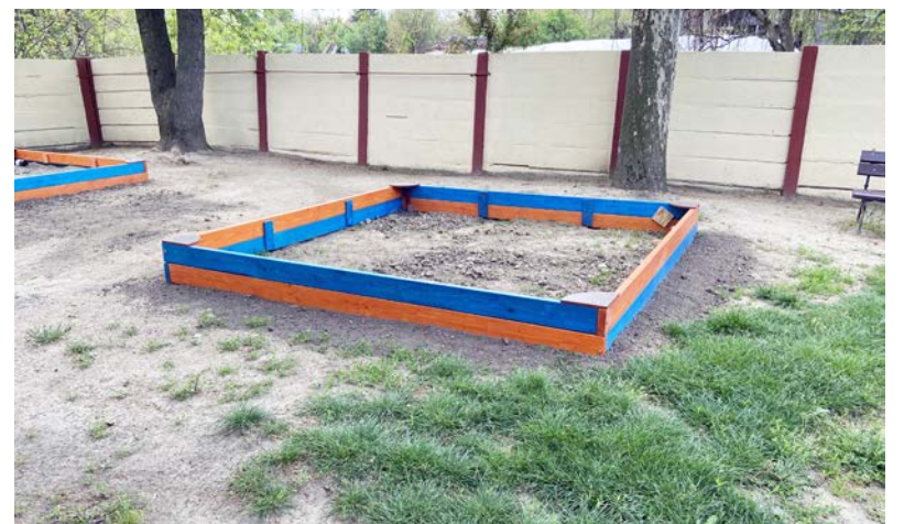
Egyedi gyártású homokozó az óvoda igényeire szabva