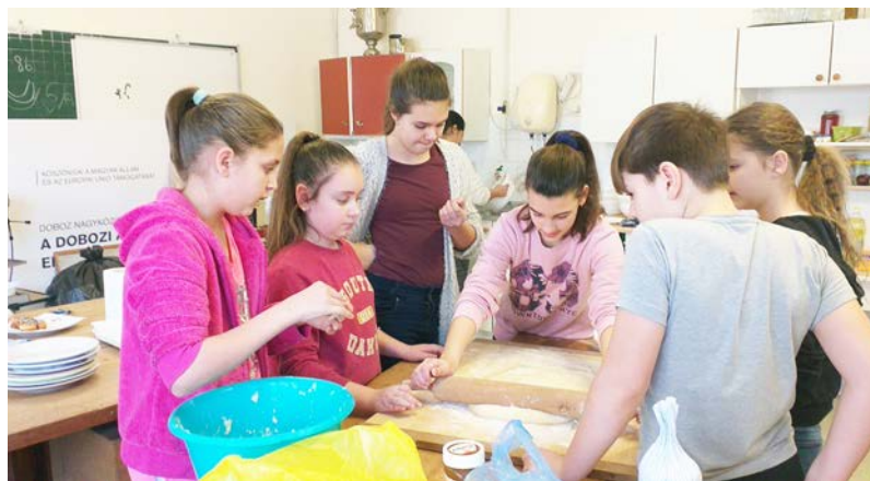
A gyerekek tesztgyúrás közben