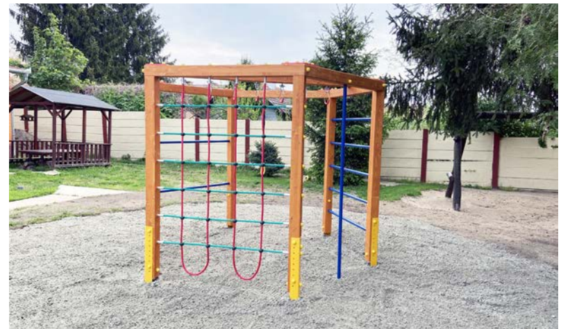
Modern tervezésű mászóka került beszerzésre

A TOP-1.4.1-16-BS1-2017-0020 azonosítószámú „Dobozi Mesekert Óvoda fejlesztése a foglalkoztatás és az életminőség javítása érdekében” című pályázat 2017-ben indult el.