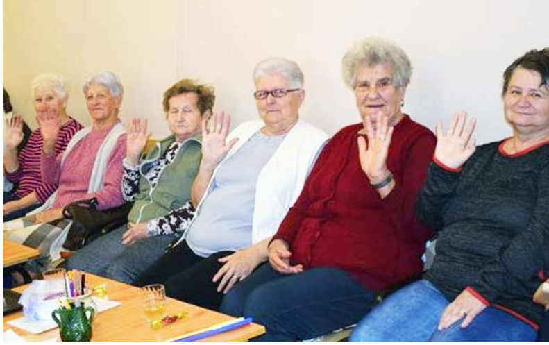
A járvány előtti kép a csoport egyik programján

Rendhagyó módon zajlik nálunk az élet. Ilyenkor tavasszal normál esetben kreatív foglalkozások keretében virágokat, tavaszi díszeket készítünk. Nagyközt sétálunk a természetben, ligetben, Szanazugban. Egy évvel ezelőtt készültünk a Megyei Nyugdíjas találkozóra. Ezek most sajnos elmaradnak. Hiányzik a zsongás a klubszobából. A közös beszélgetések, nótázások. Csak a telefonvonalon keresztül hallhatjuk egymás hangját. Azért