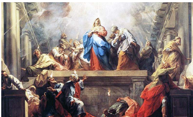
Az összesereglett nép