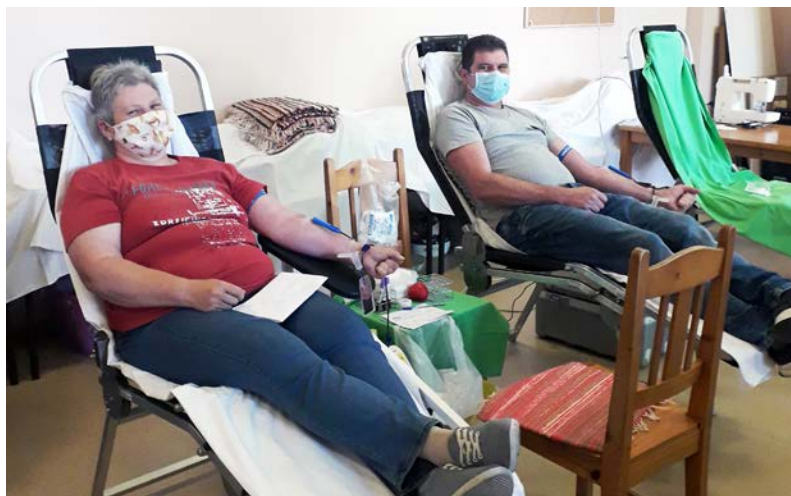
A veszélyhelyzet ideje alatt is fontos a véradás

A koronavírus járvány ideje alatt is szükség van a vérkészítményekre, elsődlegesen a sürgősségi ellátás-