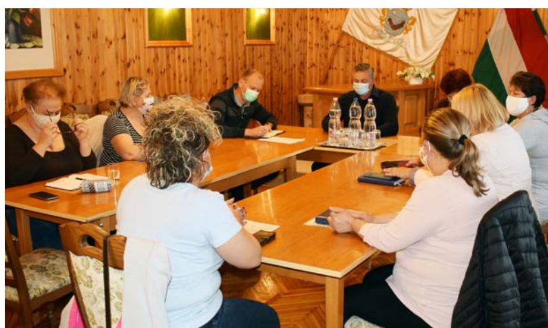
Egyeztető megbeszélés a Képviselő-testület tagjai között

A koronavírus járvány nem múlt el. A veszélyhelyzetet még nem szüntette meg a Kormány. Ennek megfelelően kell, hogy éljük mindennapjainkat. Hozzá kellett szoknunk a távolságtartáshoz, az emberi kapcsolatok változásaihoz. Igaz a megállapítás: már semmi sem lesz olyan, mint eddig. Az első és legfontosabb az emberi élet és az egészség védelme. Ezután kell a gazdaság újra indításához, a termelés és a szolgáltatások bővüléséhez szükséges intézkedéseket megtenni. A szakemberek véleménye alapján hosszú hónapok állnak előttünk bizonytalanságban, bizonyos mértékű félelemben. Vannak biztató jelek a megbetegedések, halálos esetek számának kedvező alakulásáról. A legfontosabb, hogy tartsuk be a központi és helyi intézkedéseket, szabályokat.