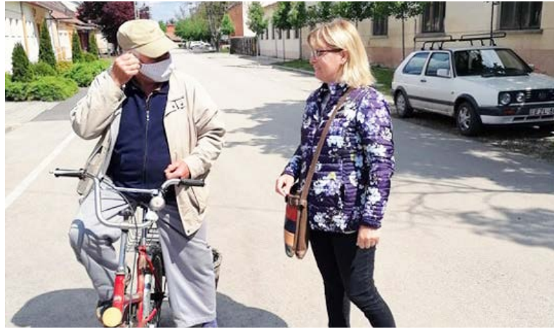
A helyiek szívesen fogadták a maszkokat

Május 4-től lépett életbe az a védelmi intézkedésről szóló kormányrendelet, mely szerint mindenki köteles az üzletben, tömegközlekedési eszközön száját és orrot eltakaró sálát, kendőt vagy orvosi maszkot viselni.