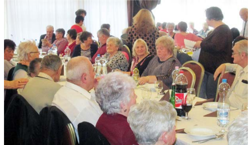
A rendezvény iránt nagy volt az érdeklődés

Újult erővel kezdtük el a 2020-as évet és még egyszer mindenkinek erőt, egészséget az új évben. A fogadóórát a Gondozási Központban tartjuk hétfőként 9-11-ig, amíg nem kapunk egy külön helyiséget a Polgármesteri Hivatalban. Tagsági díj még nem változik, marad a 2000 Ft. Várjuk tagjainkat és leendő új tagjainkat is. Rendezvényeinkről és programjavaslatainkról a Hírmondóban mindig tájékoztatást adunk.