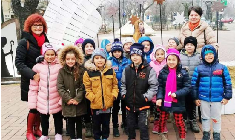
A gyerekek megismerkedtek különböző szakmák fortélyaival

Idén 2. alkalommal rendeztük meg iskolánkban a pályorientációs napot 2019. december 14-én.