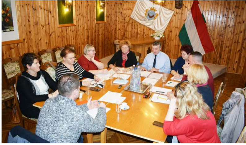
A testület január 30-án tartotta ülését

A Képviselő-testület január 30-án tartotta munkaterv szerinti ülését, melynek napirendi pontjain az alábbiak szerepeltek: