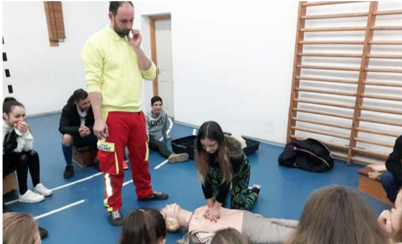
Pályorientációs nap a felső tagozatosoknak

2019. december 14-én pályorientációs nap volt a Dobozi Általános Iskolában. A felső tagozatos tanulók 4 helyszínen tíznél is több szakma rejtelmeibe nyerhettek bepillantást. Ebben vendégeink voltak segítségünkre: az Ady Endre- Bay Zoltán Szakgimnázium és Szakközépiskola, a Gál Ferenc Főiskola Békési Szakképző Iskola, Gimnázium és Kollégium, valamint az Alföld Ambulance Emergency Rescue Team.