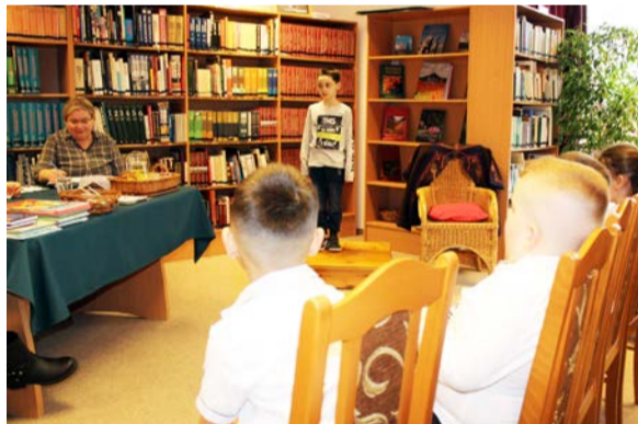
22 mesemondó készült a versenyre