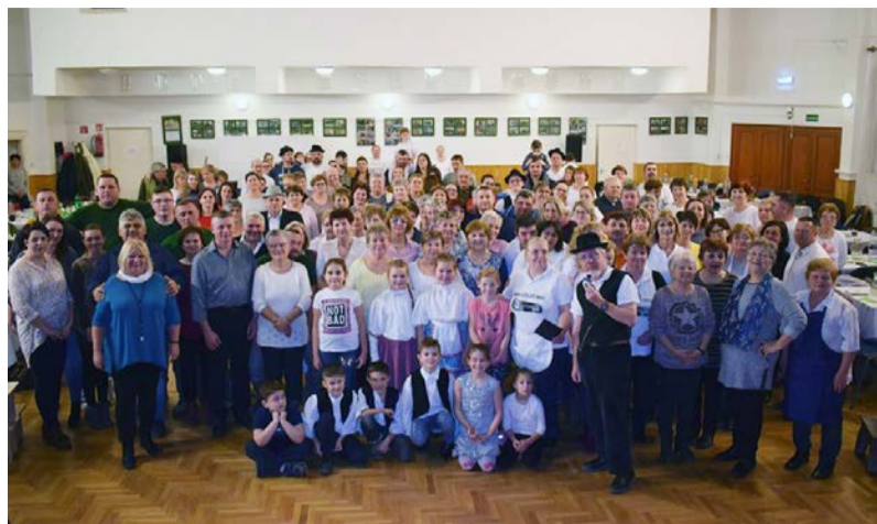
A vetélkedőn közel 170 fő vett részt

Az idén XVII. alkalommal barangoltunk együtt a magyar kultúra kincsestárában mindazokkal, akik ellátogattak a Dobozi Községi Ház és Könyvtárban megrendezett programjainkra.