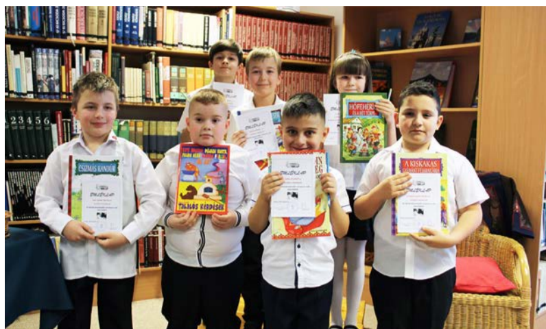
Az 1-2. évfolyam díjazottjai

A hagyományokat őrizve az idei évben január 21-én, ismét megrendeztük iskolánk alsósa számára a mesemondó versenyt, a magyar kultúra napjához csatlakozva.