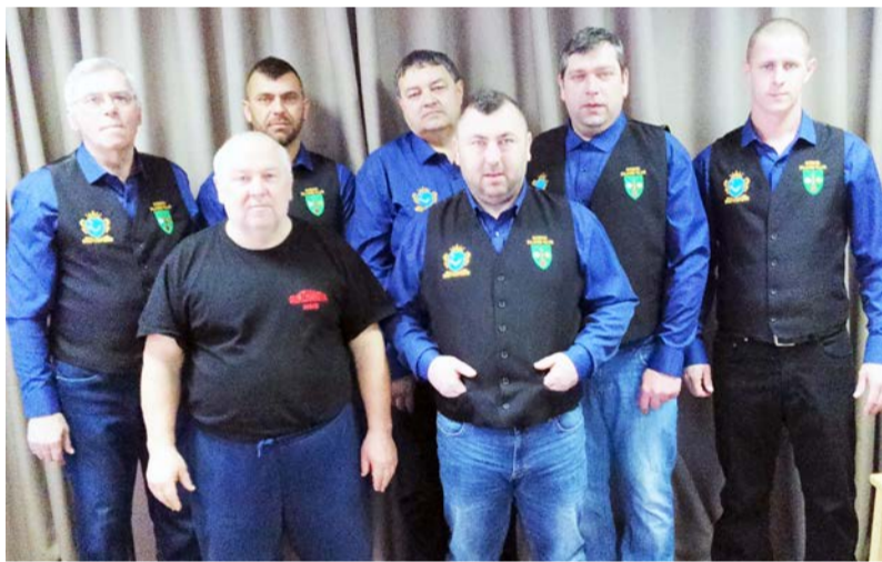
Az egyesület tagjai aktívan részt vettek a sportág népszerűsítésében