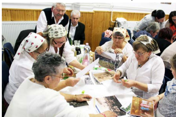
A vetélkedő közel 4 órán keresztül tartott