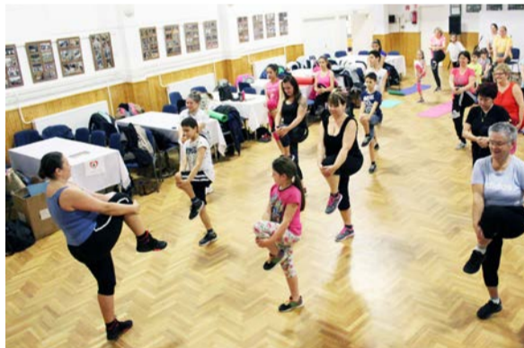
Családi aerobik edzés a Községi Házban

egy esély, és talán egy csipetnyi varázs is, amely valahol a reggelen túl vár.” mondja J. B. Priestley angol író. Milyen jó is így kezdeni egy napot! Látni a reményt, az esélyt a jóra, a gyarapodásra és milyen jó úgy zárni egy napot, hogy ez az üde varázslat be is teljesül. Valami hasonló érzés fogalmazódik meg az emberben, mikor részese lehet annak a pillanatnak, amikor 22 lelkes kisdíák napról, napra arra készül, hogy megajándékozzon téged egy mesével. Mert mesét mondani, szépen és jól nehéz feladat, a közönség érdeklődését felkelteni és figyelmét megtartani hatalmas kihívás. Akárcsak a mesehősöknek a mesében. Áldás volt az a 22 gyermek, akik a könyvtárban az „Egyszer volt” mesemondó verseny keretében vállalkoztak erre a feladatra. Szeretettel hallgattuk történeteiket a bölcs pásztorfiúról, a három testvérről vagy a pletykás asszonyokról. Könyvtárosként is és szülőként is hálásan gondolok azokra a pedagógusokra és szülőkre, akik heteken át készítettek fel a gyerekeket, erősítették a lelküket, hogy magabiztosan álljanak ki és szerepeljenek.