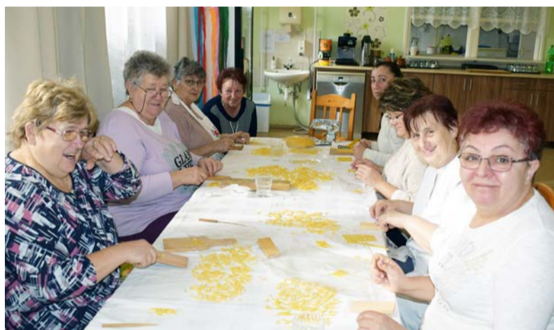
Hétfői csigatészta készítés

Az év első hónapja hirtelen tova szállt, hiszen rengeteg program színesítette az intézmény életét. 9-én a békési Kárpátia kör munkatársai tartottak egy beszélgetős délutánt az időseknek. A dobozi árvíz volt a beszélgetés témája és kérték az idősektől, hogy osszák meg ezzel kapcsolatos átélt érzelmeiket, tapasztal-