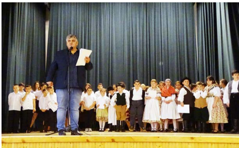
Az iskola diákjai csillogtatták meg ügyességüket