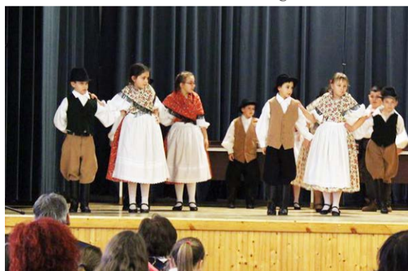
Tehetségeink a színpadon