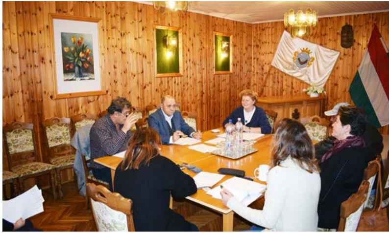
A Nemzetiségi Önkormányzat január 20-án tartotta ülését

A Dobozi Cigány Nemzetiségi Önkormányzat 2020. január 21-én tartotta testületi ülését.