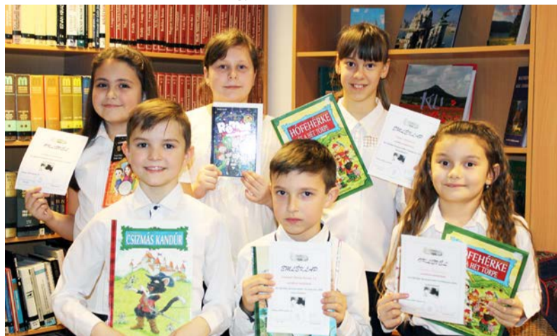
A 3-4. évfolyam díjazottjai