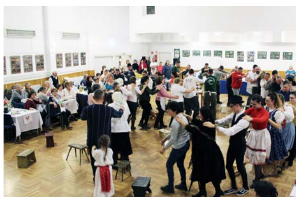
Változatos feladatok várták a résztvevőket