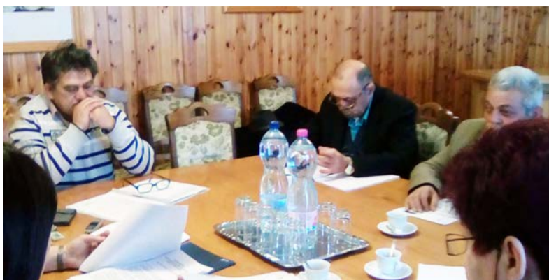
A Nemzetiségi Önkormányzat jóváhagyta a 2016. évi zárszámadását

A Dobozi Cigány Nemzetiségi Önkormányzat Képviselő-testülete 2017. április 25-én tartott testületi ülést.