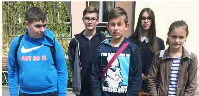
A matematika verseny résztvevői

Iskolánk matematikából jeleskedő tanulóink már ötödik éve vesznek részt Sarkadon a „Hagyományörző” Matematika Versenyen, melyet már 15 éve minden évben a tavaszi szünet előtti utolsó tanítási napon rendeznek meg. Ilyenkor a gyerekeknek – azon kívül, hogy 60 percük van a feladatok megoldására – egész délelőtt játékos programokkal, vendéglátással kedveskednek a szervezők. A feladatok, –bár szükség van az órán tanult ismeretekre, – most sem voltak szokványosak. Annak, aki részt vett ezen a versenyen szüksége volt a magasabb szintű logikai, kombinatív, problémameg-