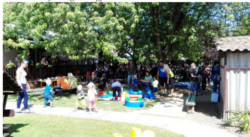
Gyereknapi is megtelt a bölcsi udvara

A megbízható embert még ellensége is tiszteli.