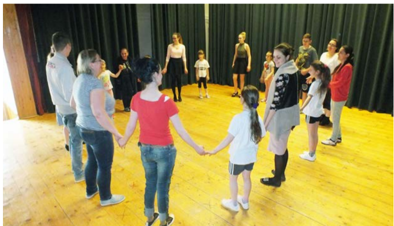
A népzene szárnyán utazás a Rábaközbe