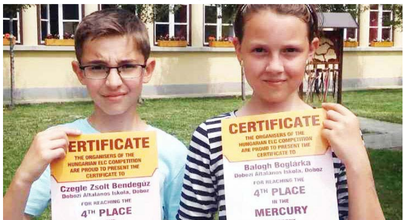
Kiemelkedő teljesítmény az alsós angol versenyen

Ebben a tanévben is több alsósoknak meghirdetett angol versenyre neveztem be érdeklődő, ügyes tanítványaimat. Ezek közül az egyik verseny az English Language Competition.