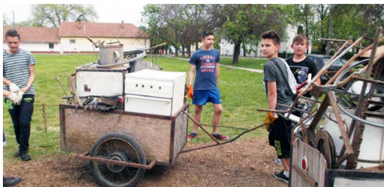
Aktív munka folyt a fémgyűjtésen

Aki szervezett már valamilyen rendezvényt, az tudja, hogy néha a „lebonyolítás” kifejezés illik az eseményhez. Sőt, az is előfordul néha, hogy a részletes szervezés ellenére sem úgy sikerülnek a dolgok, ahogyan azt előre eltervezték. Nos, ezek az ideji fémgyűjtésre igazán illő jellemzők. Nagyon dögösen kezdődött. Ezúton is szeretnék azoktól a szülőktől elnézést kérni, akiknek várakozniuk kellett a mázsánál. A későbbiekben viszont gördülékenyen folyt a munka. Az önkormányzat biztosított felnőtt segítséget a pakoláshoz, de a „mi fiaink” (a 8. oszt. fiúk) is tiszteleggel helytálltak a munka frontján. Az alsósok részéről a szülők vettek részt az akcióban. A felsős gyerekek maguk rótták Doboz utcáit. Mondhatnánk fáradhatatlannak, de ez nem lenne igaz! Amikor a második konténert is elvitték, és haza indultak az utolsó talicska után az 5.a osztályos tanulók, ak-