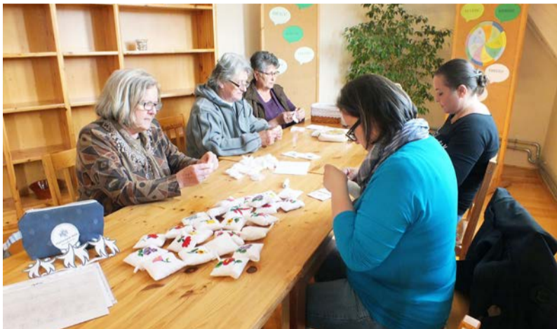
A Dobozi Nefelejcs Hímző Szakkör alkotó munkában

2017. május 8. és 14. között hagyományteremtő céllal országos rendezvénysorozat indult a Cselekvő közösségek – aktív közösségi szerepvállalás EFOP-1.3.1-15-2016-00001 kiemelt projekt keretében. A projekt a Szabadtéri Néprajzi Múzeum, a Nemzeti Művelődési Intézet és az Országos Széchényi Könyvtár konzorciumi együttműködésében valósul meg.