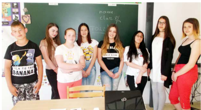
A versenyek résztvevői

A Mezőberényi Petőfi Sándor Evangélikus Általános Iskola, Gimnázium és Kollégium a 2016/2017-es tanévben is meghirdette levelező versenyét hetedik és nyolcadikos