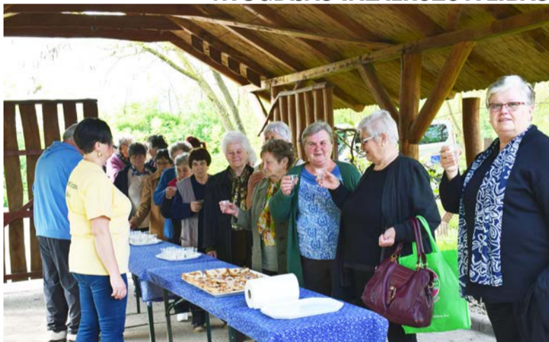
Nyugdíjas találkozón a doboziak

Május 3-án immár harmadik alkalommal került megrendezésre a Megyei Nyugdíjas Találkozó a Dobozi Gondozási Központ szervezésében. A rendezvénynek, mint eddig mindig, most is a Libás tanya adott otthont. Érkezőkor a kapuban kínálták a vendégeket pálinkával és libaszíros, lilahagymás kenyérral. A meghívottak között volt a békési, tarhosi, orosházi, gyulai, kétsopronyi és telekgerendási idő-