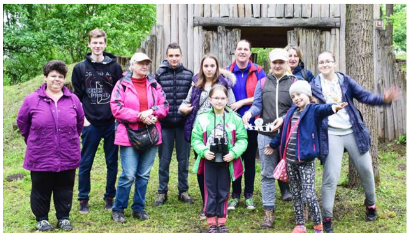
Zöld túra résztvevői