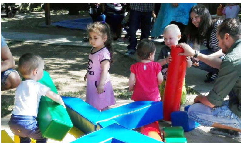
Kicsik és nagyok együtt játszottak

Idén május 20-án került megrendezésre a Bölcsődei Gyereknapi az apróságok nagy öröme. Az esemény színtere a ragyogó napsütésnek köszönhetően az intézmény udvara volt. A Bölcsőde dolgozói szívesen fogadták a bölcsiseket, leendő bölcsiseket, testvéreiket és hozzátartozóikat. A szervezők ugrálóvárakkal, trambulinnal, arcfestéssel, udvari játékok széles kínálatával várták az oda látogató gyerekeket. Hogy telt az idő egyre több színesebbél színesebb, főként állatarc szaladgált az udvaron. Terített asztalok fogadták a kicsiket és nagyokat egyaránt. Üdítővel és apró