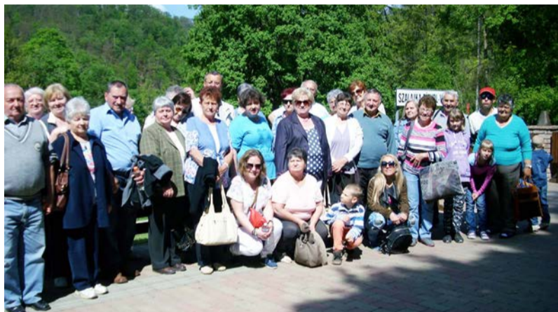
Szilvásváradon a mozgáskorlátozott egyesület

Május 18-án Szilvásváradra szerveztünk kirándulást. Korai kelés miatt kissé álmosan indultunk útnak, de hamar feloldódott a tagság és pár kilométer után már nyoma sem volt a bágyadságnak. Terv szerint értünk Szilvásváradra, ahol a kisvasút várt ránk. Többeségünk vonattal indult el a Fátyol