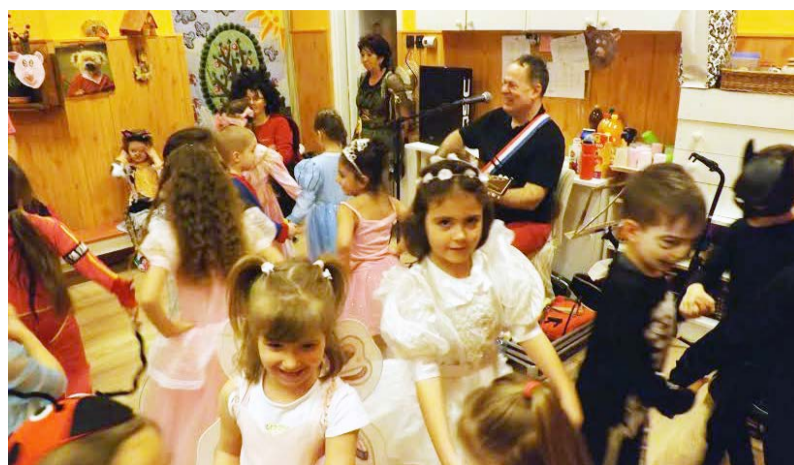
Itt a farsang áll a bál....