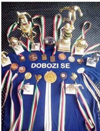
Díjak és elismerések

Gratulálunk ehhez a nagyon szép elismeréshez! További jó játékok és sok győztes meccset kívánunk!