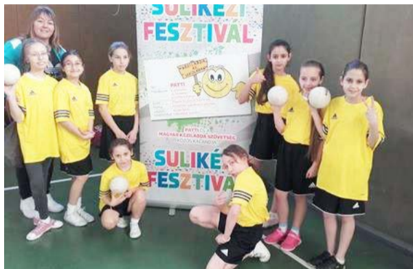
Iskolánk lány kézilabda csapata