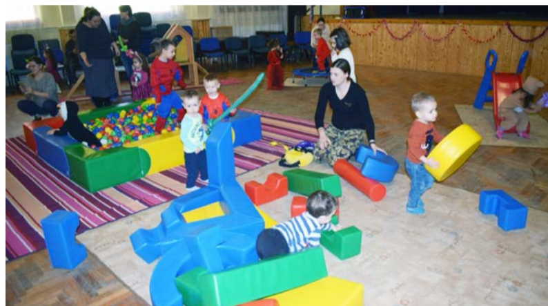
A legkisebbek is igyekeztek elűzni a telet

Itt a farsang, áll a bál, keringőzik a kanál, Csárdást jár a habverő, bokázik a máktörő. Dirreg, durrog a mozsár, táncosra vár a kosár. A kávészem int neki, míg az örlő pergeti. Heje-huja vigalom! Habos fánk a jutalom Mákos patkó, babkávé, ez aztán a parádé.