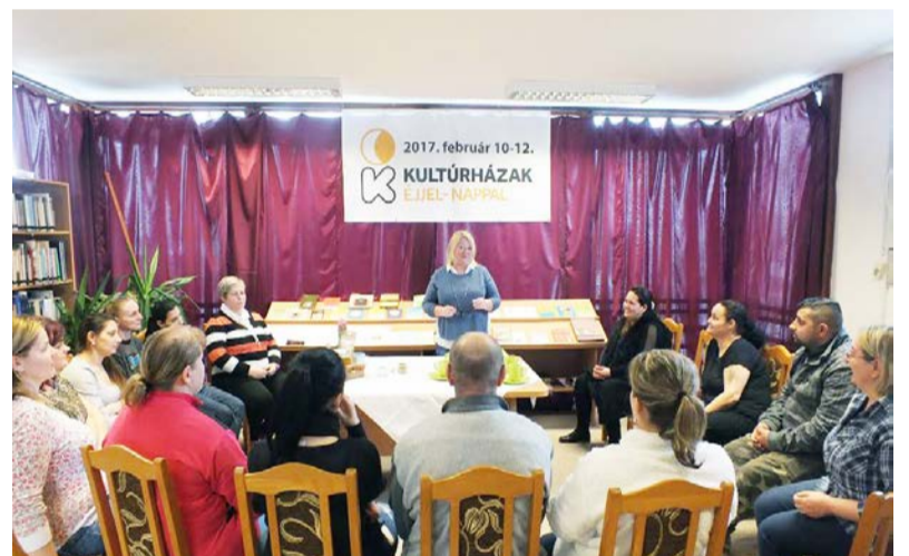
Kulturházak éjjel - nappal rendezvény Dobozon