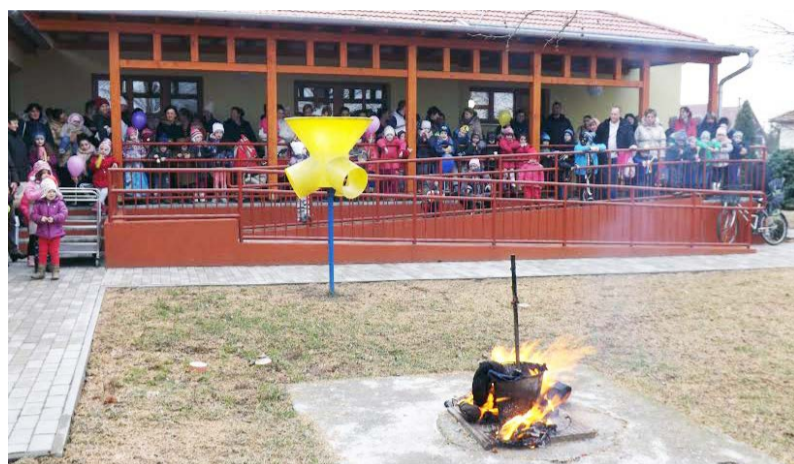
Ég a kiske lánkkal ég, tavasz legyen mielőbb....