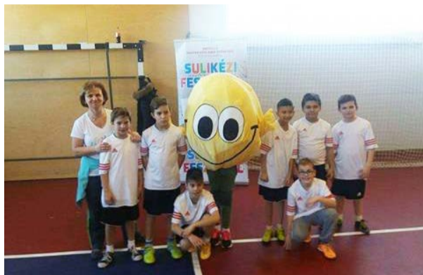
Iskolánk fiú kézilabda csapata

2017. február 4-5-én nagy sikerrel rendezték meg ismét a Sulikézi Fesztivált, ezúttal Budapesten a Vasas Sportcentrumban. A fesztiválon az MKSZ Kézilabda az iskolában programjában részt vevő iskolák, valamint azon iskolai csapatok vehettek részt, amelyek nem szerepelnek a Magyar Kézilabda Szövetség által kiírt Kisiskolás versenyeken.