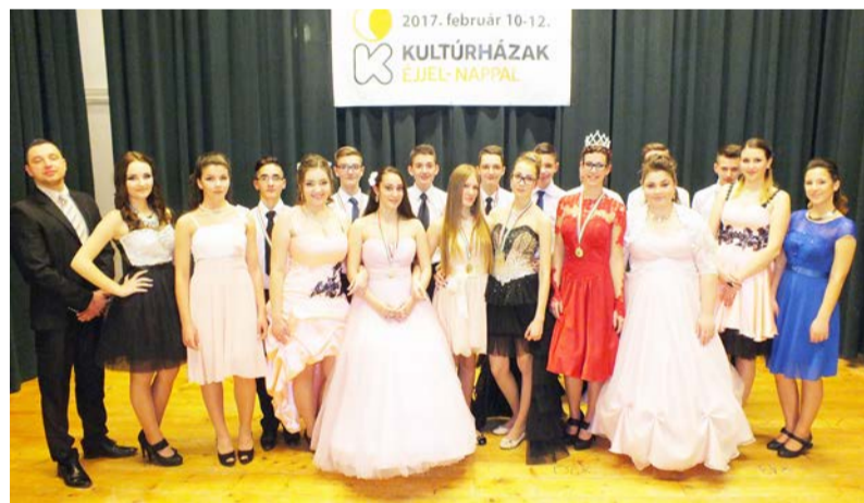
A szombat esti táncvizsgázók