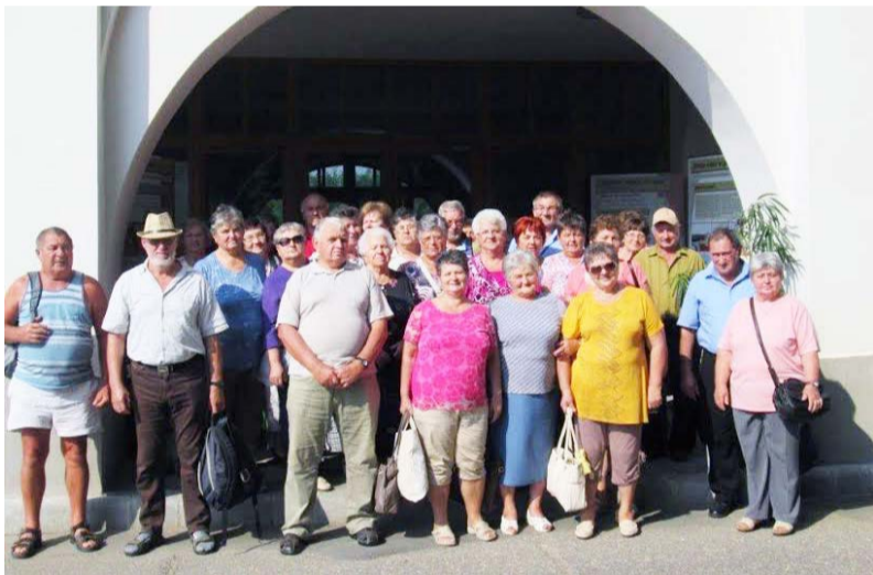
A mozgáskorlátozott egyesület tagjai