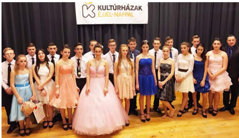
A péntek esti táncvizsgázók

Több évtizedes hagyomány már Dobozon, hogy nagyközségünk 8. osztályos tanulói számára minden év októberétől társastánc tanfolyamot indítunk. Majd a négyhónapos szorgalmas táncstudás után be is mutatják a fiatalok a társastáncstudásukat a nagyközség előtt, ezzel bizonyítva, hogy nemcsak az iskolában állják meg a helyüket, hanem a táncparketten is. A tanfolyam októbertől február elejéig tartott, amely végén az idén is társastánc vizsgabálakat rendeztünk február 10-én és 11-én, a Dobozi Községi Ház és Könyvtár nagytermében.