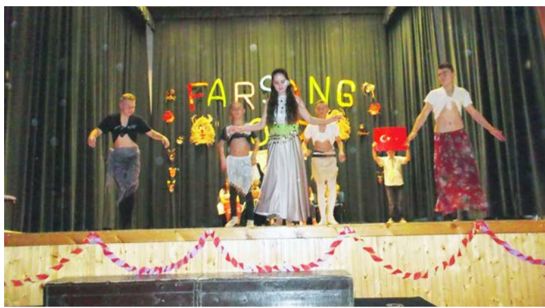
A hetedikesek télűző műsora

A februárt, azaz a tél záró hónapját a vigasság és jókedv tölti meg. A farsangi időszak lényege a nevetés és a színek, mi színes műsorral akartuk elűzni a telet.