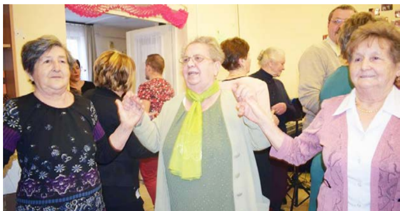
Farsang a Gondozási Központban