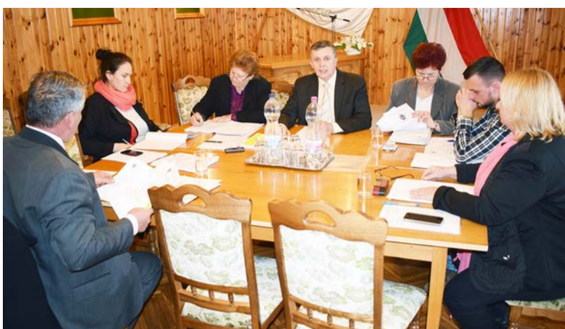
A testület döntött a 2017. évi költségvetésről