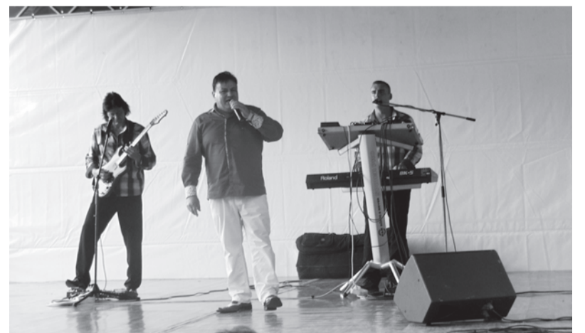
A sztárvendég Csocsesz