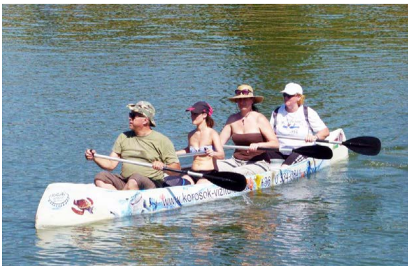
Egyhajóban a dobozi csapat

2016. augusztus 27-28-án immár tizedik alkalommal rendezték meg az Egy hajóban evezünk vízitúrát a Kettős-Körösön.