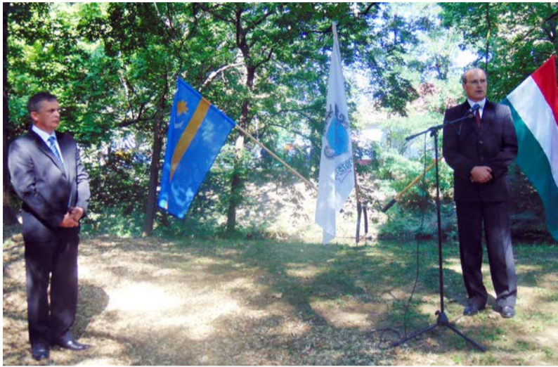
Ozsdola polgármestere Dobozon ünnepelt

Idén is megemlékeztünk államalapító királyunk Szent István ünnepéről. 1083. augusztus 20-án avatták szentté I. István királyt. Erre a napra emlékezve ünnepeljük minden évben Szent István királyt és a keresztény magyar államalapítást, valamint az új kenyeret.