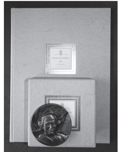
Az állami díjak