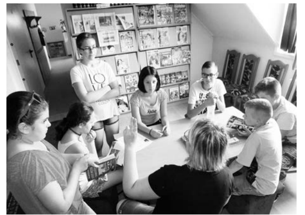
Játékos feladatok a csillagászatról