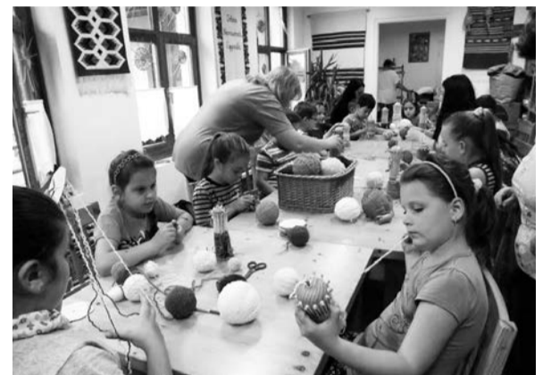
Alkotó foglalkozások a táborban