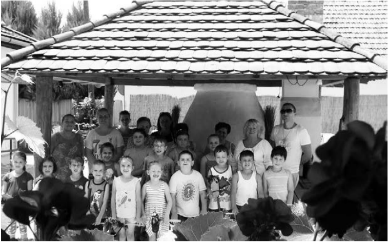
Kézműves tábor résztvevői

A suli éppen hogy befejeződött, máris lehetett táborozni Dobozon. A szokott időben és helyen vártuk az alkotni vágyó vakációzókat.