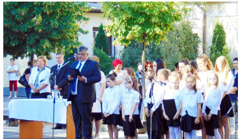
A tanévnyitó ünnepség szereplői

Sok-sok diák, akiket már nagyon vártunk! Reméljük, mindenki kipihente magát, hisz számtalan feladat, program, esemény vár ránk. A folyosók, az osztálytermek nyáron felfrissültek, új ruhát kaptak, vidáman várják az új tanévet, ami szeptember 1-jén kezdődött.