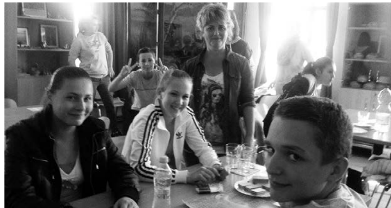
Természetvédelmi vetélkedőn iskolánk diákjai

A Körös-Maros Nemzeti Park igen nagy hangsúlyt fektet a természetvédelemre. E munka része az iskolásokat megmozgató Őszirózsa Természetvédelmi Vetélkedő. A Dobozi Általános Iskola tavaly már szép eredményt ért el ezen a versenyen, és egyértelmű volt, hogy idén is kiveszik részüket a feladatokból.