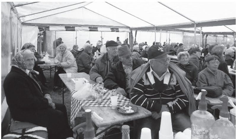
A Libás Tanya adott otthont a nyugdíjas találkozóknak

Egy évvel ezelőtt pattant ki az ötlet az intézményvezető asszony fejéből, hogy jó lenne egy megye szintű Nyugdíjas találkozót szervezni a Libás Tanyán.