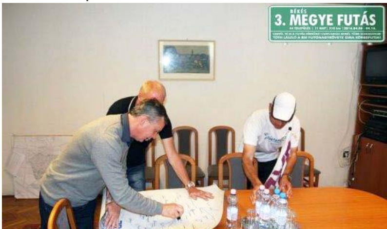
A Megye Futás térképének ünnepélyes aláírása

A Dobozói Hírmondó szerkesztősége arra kéri a sportolókat, sport barátokat, ha bármilyen sporteseményről tudnak, azon részt vettek, jelezzék szerkesztőségünknek, így mi is be tudunk számolni ezekről a történésekről. E-mail: hirmondo@doboz.hu ; Tel.: 06/20 288-5862