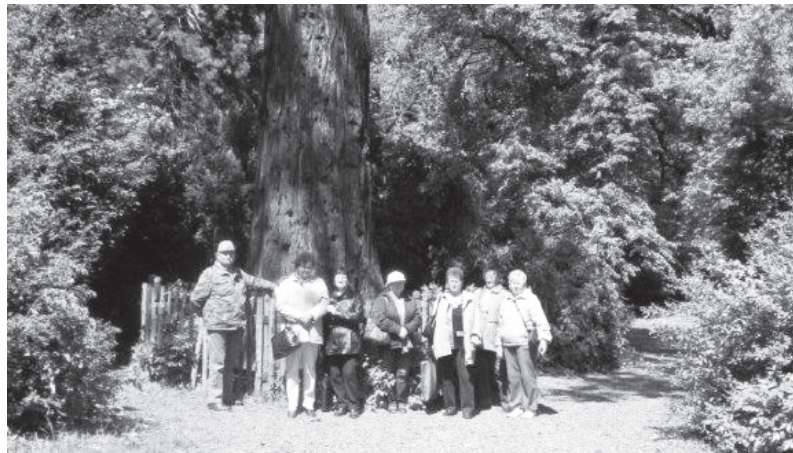
Szarvason járt a Mozgáskorlátozott egyesület

Az elmúlt hónapban Szarvasra látogattunk el. Megnéztük az Arborétum csodálatos növényvilágát és az ország nevezetesebb