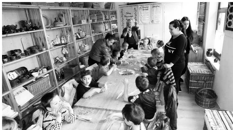
Használati tárgyak készítése természetes anyagokból