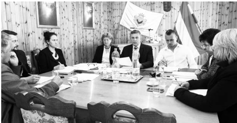
A Képviselő-testület döntött a beadandó pályázatokról

Doboz Nagyközség Önkormányzatának Képviselő-testülete 2016. április 27-én tartott nyílt ülést.