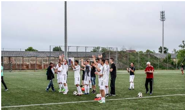
A csapat megköszönte a sok szurkolónak, hogy elkísérte az Atletico Békéscsaba elleni mérkőzésre