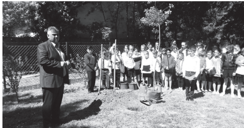
Faültetés az iskola udvarán

Arra kérek mindenkit, értő fülekkel és látó szemekkel kísérje figyelemmel a következő műsort.”