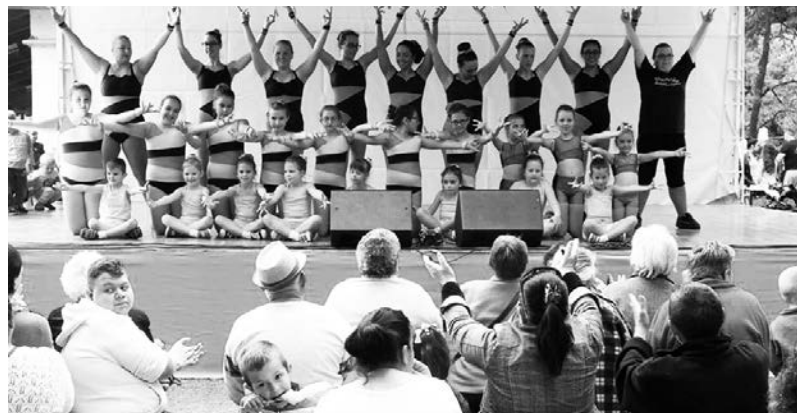
Aerobikosaink a színpadon