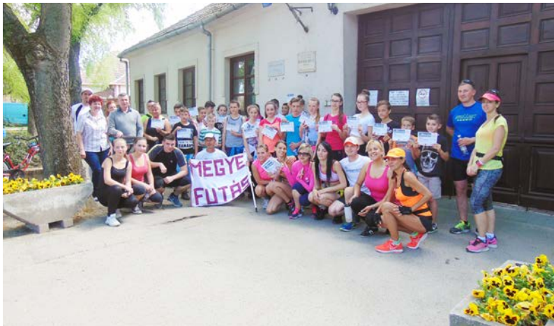
A Megye Futás dobozi résztvevői