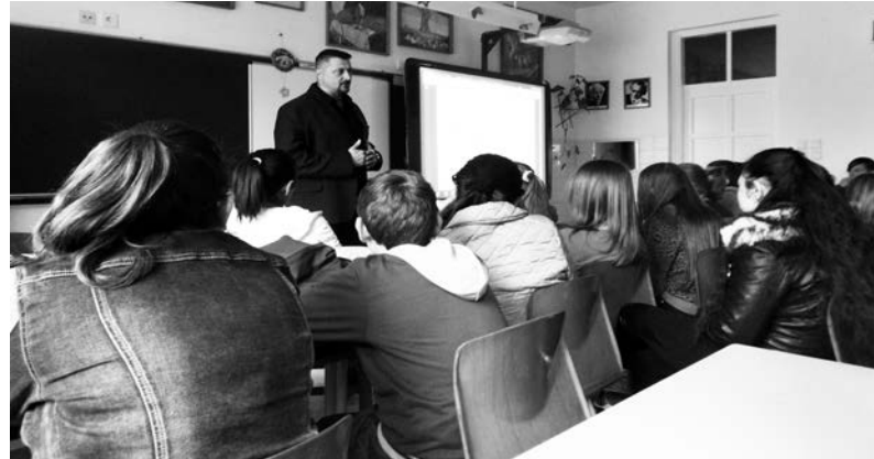
Előadás a tudatmódosító szerek hatásairól

Ez a cím egy projektet takar, melynek célja az egészség, az életminőség fejlesztése, egyik célcsoportja pedig az általános iskolába járó tanulók. Így nem volt kérdés, hogy csatlakozunk a programhoz, mely az egészségnevelésről, a betegségek megelőzési módjairól is tájékoztatást ad.