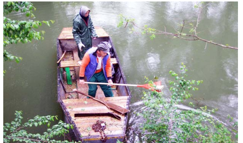
Idén először a vízen is gyűjtötték a szemetet

Csatlakoztunk az országos szinten megrendezésre kerülő „TeSzedd! – Önkéntesen a tiszta Magyarországot” hulladékgyűjtési kezdeményezéshez. A TeSzedd! elnevezésű akció ma hazánk legnagyobb önkéntes mozgalmá. Idén immár hatodik alkalommal valósult meg. A szemetgyűjtési akció keretében szerte az országban „tavaszi nagytakarítanak” a TeSzedd! önkéntesei. Azért szervezik meg ezt a mozgalmat minden évben, hogy közösen megtisztítsuk szűkebb-tágabb környezetünket. Dobozon 2016. április 29-én 8 órakor kezdődött az akció. Sajnos az időjárás nem kedvezett, de a szitáló eső ellenére sokan részt vettek a szemetgyűjtésben.