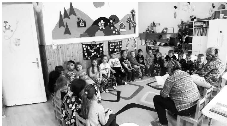
Versek a természetről

Programsorozatunk zárásaként április 22-én a Föld napján