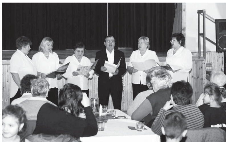
A Dobozi Népdalkör tagjai karácsonyi dalsokrukkal minden jelenlévő szívét megérintette