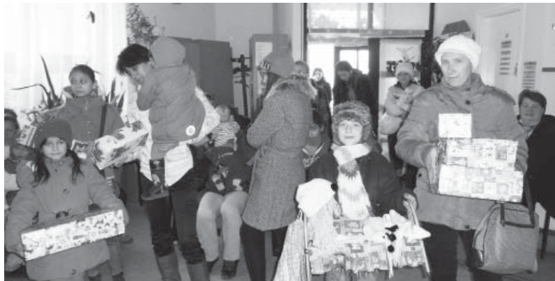
Sok családot támogattak a doboziak

Ha mérlegre kellene állítanunk, hogy mennyi szeretet fér el egy cipős dobozban, akkor a következő összegzést tudnánk leírni; 73 gyermek 31 család 11 idős 115 boldog arc, és a levegőben áradó mérhetetlen szeretet. Idén első alkalommal került megrendezésre a