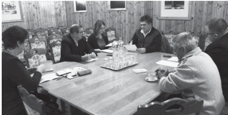
A Nemzetiségi Önkormányzat testülete megtartotta az év utolsó testületi ülését