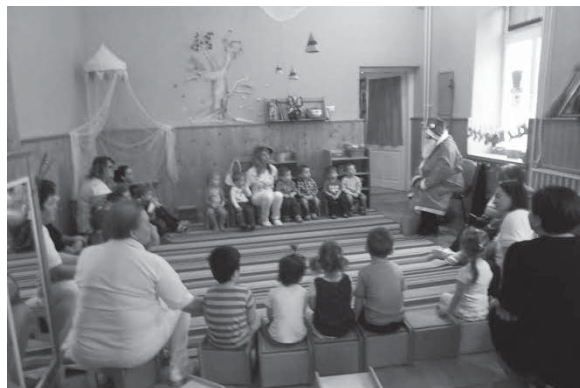
A Mikulás körében

„Szívünk rég ide vár, Téliapó gyere már...”