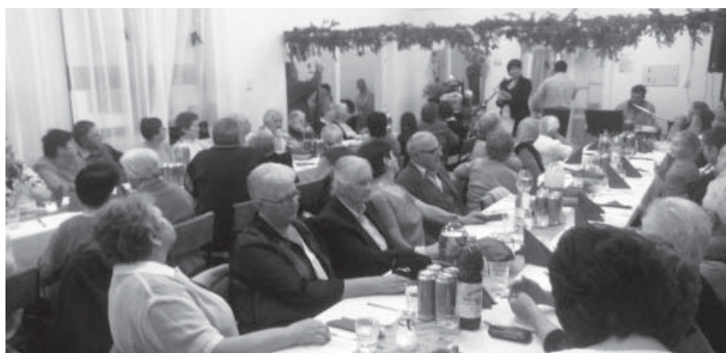
Karácsonyvárás az idősek klubjában

„Mindazokért, kiket nem láttunk már régen, Akik velünk ünnepelnek az égben, Kiknek őrizgetjük szellemét, Mindenkiért egy-egy gyertya égjen”