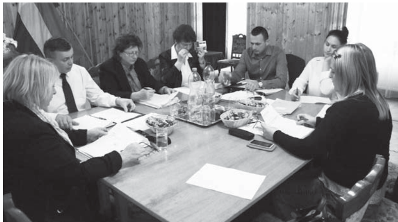
A Képviselő-testülete döntött az átmeneti gazdálkodásról is