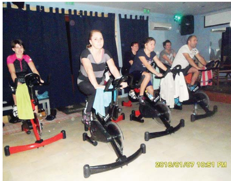
A SpinRacinget jótékonyan hat az emberi szervezetre

A Dobozi Hírmondó szerkesztősége arra kéri a sportolókat, sport barátokat, ha bármilyen sporteseményről tudnak, azon részt vettek, jelezzék szerkesztőségünknek, így mi is be tudunk számolni ezekről a történekekről.