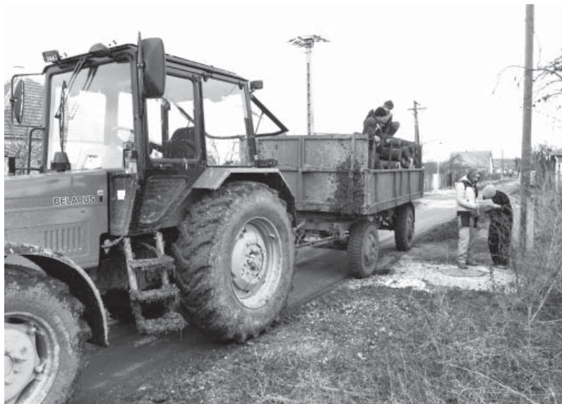
Elkezdődött a szociális tűzifa kiszállítása

Az előző számunkban tájékoztattuk olvasóinkat, hogy Doboz Nagyközség Önkormányzata idén 9.192.260 Ft támogatást nyert a települési önkormányzatok szociális célú tüzelőanyag vásárláshoz kapcsolódó Belügyminisztérium által kiírt pályázaton, mely összegből 517 m 3 keménylombos tűzifát vásárolt.