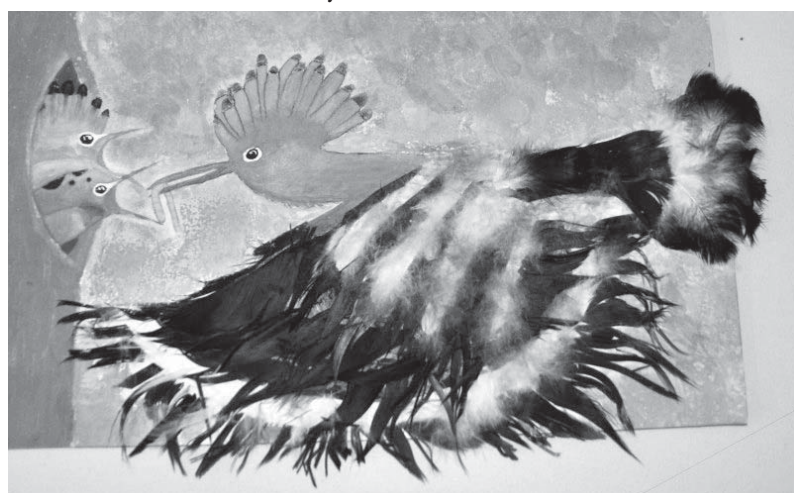
A nyertes pályamű