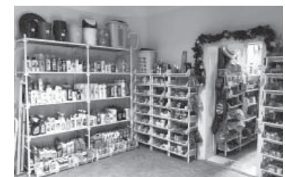
Háztartási és vegyi áruk

Kedves Doboziak! Továbbra is számítunk meglévő, és leendő új vásárlóinkra!