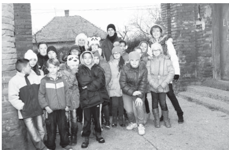
Helytörténeti séta a helyi általános iskola diákjaival