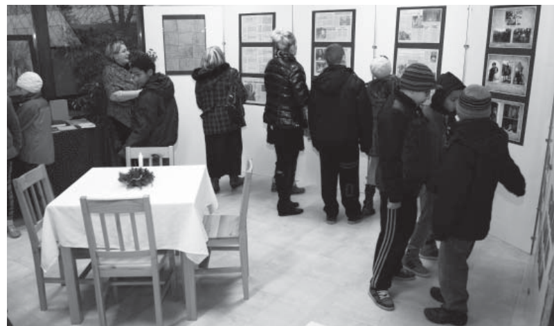
A kiállítás megtekintése

Mint minden évben, így az idén is megrendezte a Dobozi Közösségi Ház és Könyvtár kollektívája a „Karácsonyváró Hetet”, 2015. december 14-18-ig.