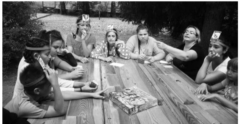
Játékos feladatok a táborban

A Dobozi Cigány Nemzeti-égi Önkormányzat „Hagyományok Szárnyán” nemzetiségi tábort szervezett Szanazugban, 2016. augusztus 1-jétől 7-ig.