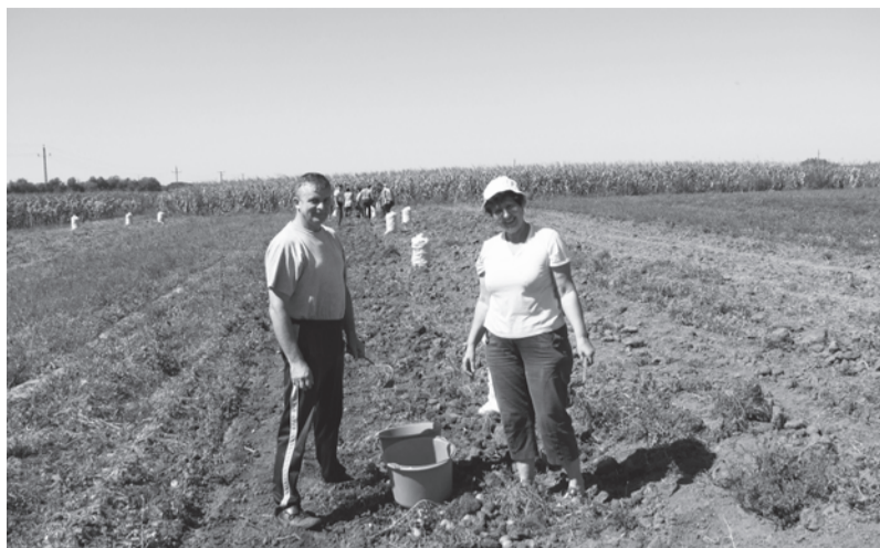
A település vezetői is segítettek a betakarításban

Összesen 49 hektáron folytat mezőgazdasági termelést Dobozy Nagyközség Önkormányzata. A nagyközség földterületeinek művelését elsősorban a közfoglalkoztatók végzik.