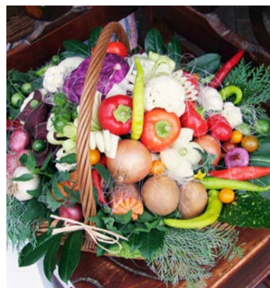
Terményeink egy kosárban

„Jobb a helyes úton sántikálva haladni, mint szilárd léptekkel téves irányba tartani.”