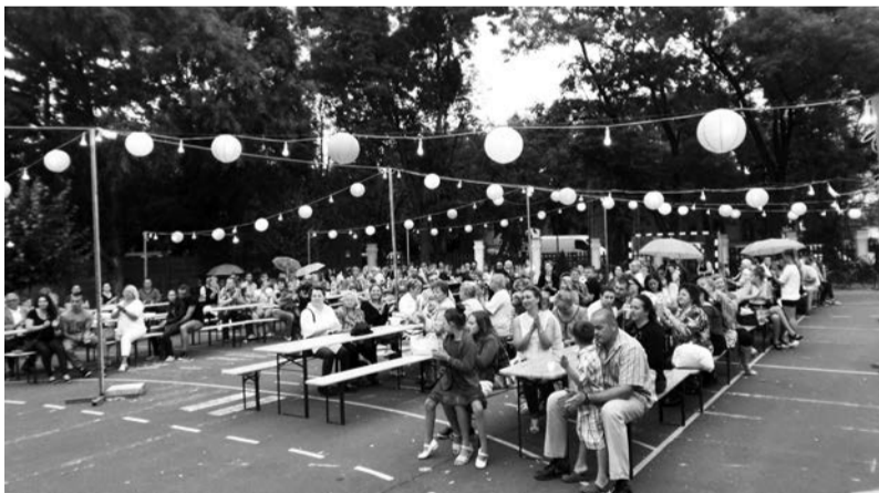
Idén is sokan támogatták a iskolánkat