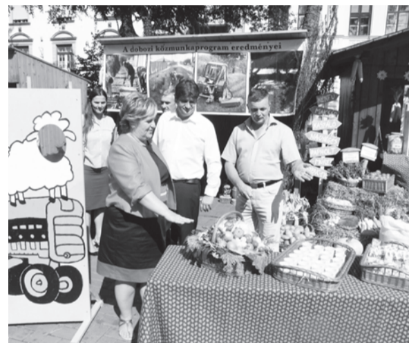
Településünk vezetője mutatja be a kiállított termékeket