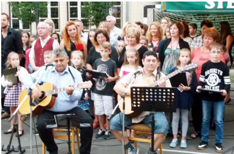
A tantestület kórusával kiegészített énekkar szórakoztatta a közönséget

Ismét jutott az égi áldásból, de ez sem zavarta azt a mintegy kétszáz embert, aki ellátogatott a Dobozói Általános Iskola Jótékonyági báljára. Idén ötödik alkalommal vártuk azokat, akik támogatják elképzeléseinket. Az elmúlt évek báljainak bevételéből vásároltuk meg a digitális naplót és a dallamcsengőt, parkosítottunk, sportudvart alakítottunk ki, korszerűsítettük a hangosító berendezésünket. A megjelenteknek köszönhetően folytathatjuk a sort. Köszönet érte!