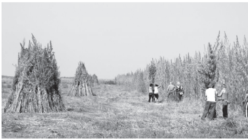
Leartatták a kender Dobozyon

Újraindult az ipari kendertermesztés megyénkben. A program több önkormányzat bevonásával valósul meg, melyhez településünk is csatlakozott. Békés megyében kísérleti jelleggel, a közfoglalkoztatás keretében kezdték meg a kendertermesztését.