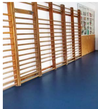
Új padlózatot kapott iskolánk tornaterme