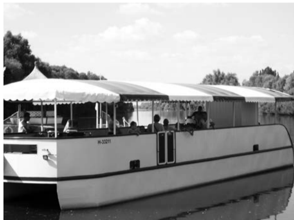
A gyerekek több programon vehettek részt

A Dobozi Gondozási Központ Család- és Gyermekejéltéi Szolgálat az idei nyáron három alkalommal szervezett gyerekek számára kirándulást. A programokon összesen 43 gyermek vett részt. Július és augusztus hónapokban 1-1 alkalommal strandoltunk a Békéscsabai Árpád fürdőben, ahol az egész napos pancsolást és csúszdázást csak délben szakítottuk félbe egy ebéd erejéig.