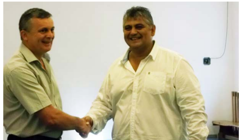
Átadták a felújított tornatermet

Megújult a Dobozói Általános Iskola tornatermének padlózata. A beruházás csaknem egymillió forintból valósult meg. A felújítás során teljesen kicserélték a korábbi, betonra ragasztott műanyag borítást.