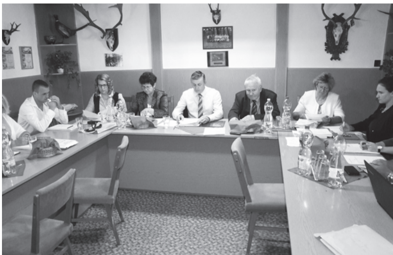
A Képviselő-testület a dobozi Vadászházban tartotta soros ülését

Doboz Nagyközség Önkormányzatának Képviselő-testülete 2016. szeptember 21-én tartotta soros, kihelyezett ülését a dobozi Vadászházban.