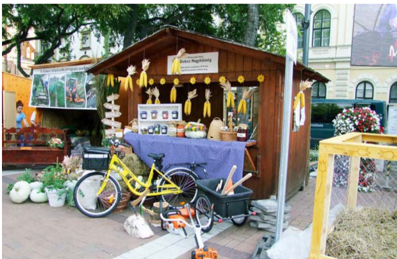
A Közfoglalkoztatási Kiállítás dobozi standja

A Békés Megyei Kormányhivatal szervezésében 2016. szeptember 8-án, immár negyedik alkalommal rendezték meg a Közfoglalkoztatási Kiállítást, Békéscsaba főterén, melyen településünk is részt vett. A rendezvényen látványos keretek között mutatkoztak be a Békés megye települései által megvalósított közfoglalkoztatási programok eredményei.