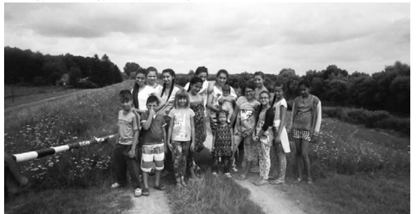
A tábor résztvevői