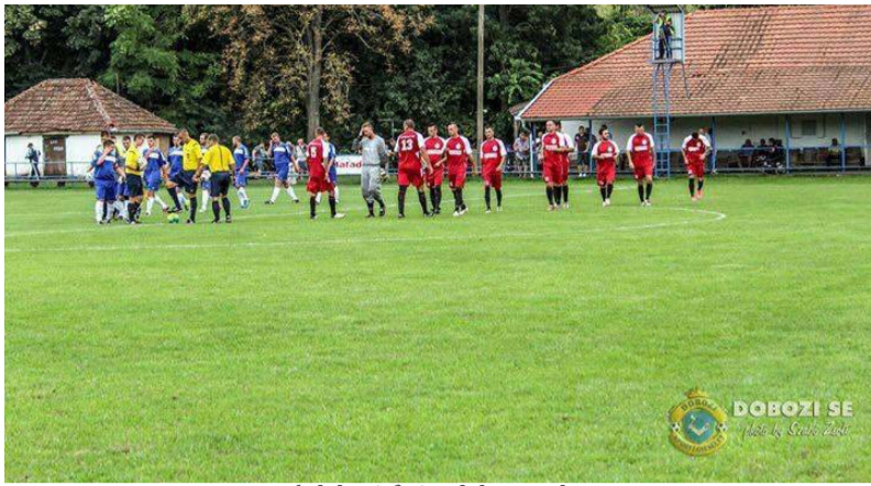
A dobozi focisták bevonulása