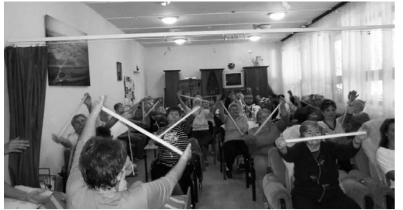
A családtagok betekintheztek a klub mindennapjaiba