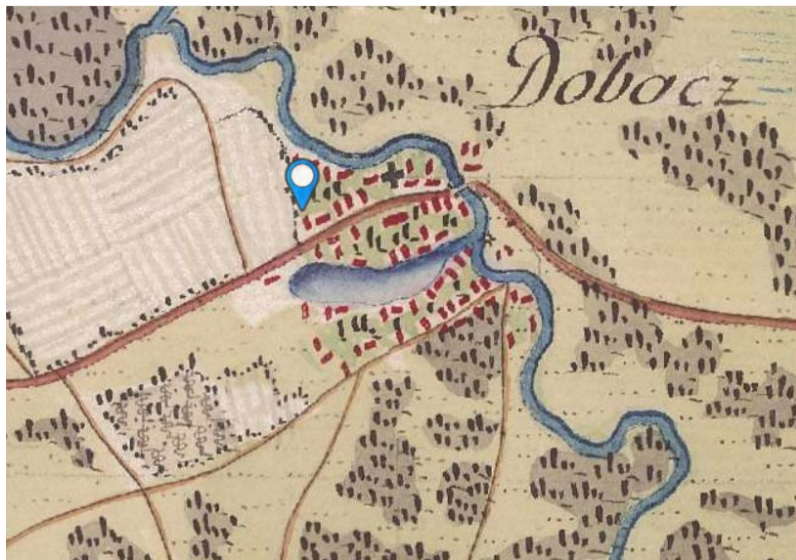
Dobozi szőlőtermesztés térképe

Szeptember 26. - október 1. között szervezte meg a Dobozi Községi Ház és Könyvtár a XIX. Dobozi Szüreti Napokat. A paraszti szőlők manapság szinte eltűntek, pedig a nem történelmi borvidékeken, így a Körösök mentén is nagy kiterjedésű szőlőskertek voltak. Elsősorban ott honosodtak meg, ahol az egyház is jelen volt, a papok jól ismerték a szőlőművelést és a borkészítést. A környéken a mágori dombon alapított monostor maga termelhette meg a szertartásokhoz szükséges bort. A Wenckheimék a XVIII. század végén a templom dombjára 1810-1812 között borospincét építettek.