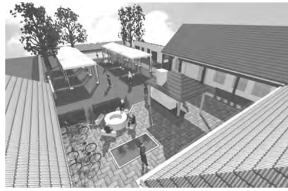
A rendezett udvaron kerékpártároló, pavilonok és zöldterület is várja a látogatókat

A Dobozi Népművészeti Egyesület - a Körösök Völgye Vidékfejlesztési Közhasznú Egyesület LEADER HACS közreműködésével, támogatásával és Dobozy Nagyközség Önkormányzatának előfinanszírozásával, hozzájárulásával és támogatásával pályázatot nyert a Széchy Tamás Emlékház hagyományőrző udvarának létrehozására.