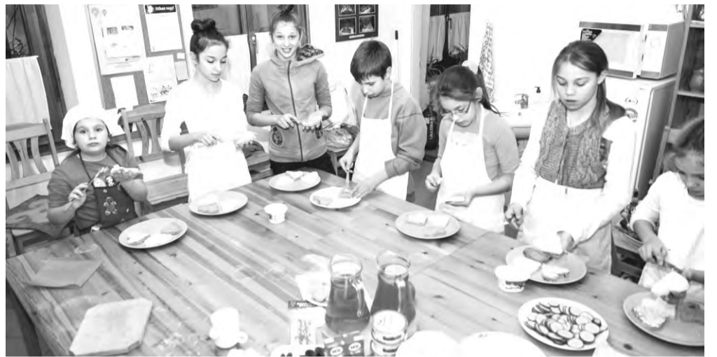
A játszóbázis keretén belül a konyhában is kipróbálhatták tudásukat a gyerekek