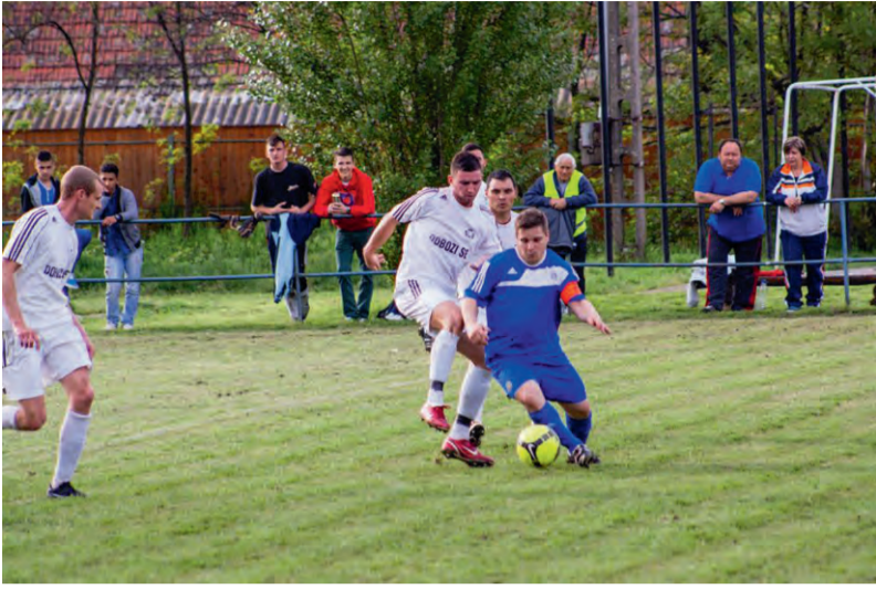
A Dobozi SE csapata várja a szurkolókat

Újabb győzelmet aratott a Dobozi SE csapata a Békés megyei II. osztályú pontvadászat 21. fordulójában.