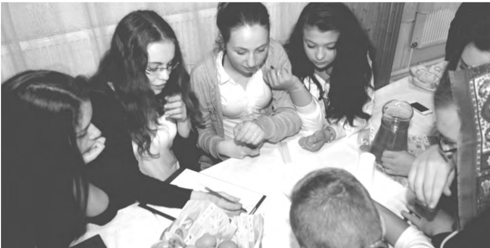
A Helytörténeti Vetélkedőn a feladatok településünk múltjáról és jelenéről szóltak