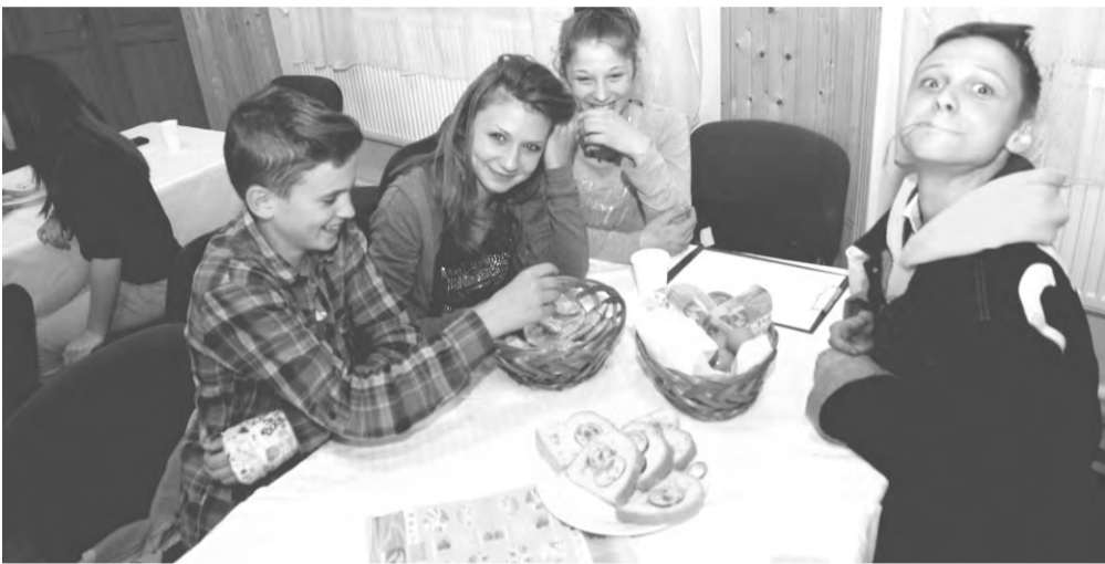
A záró rendezvényen ezúttal az iskolások mérték össze tudásukat