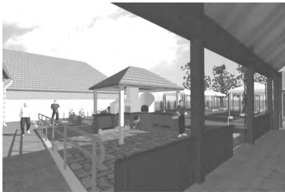
A tervek szerint szabadtéri fedett kemence, bográcszózó épül az udvaron