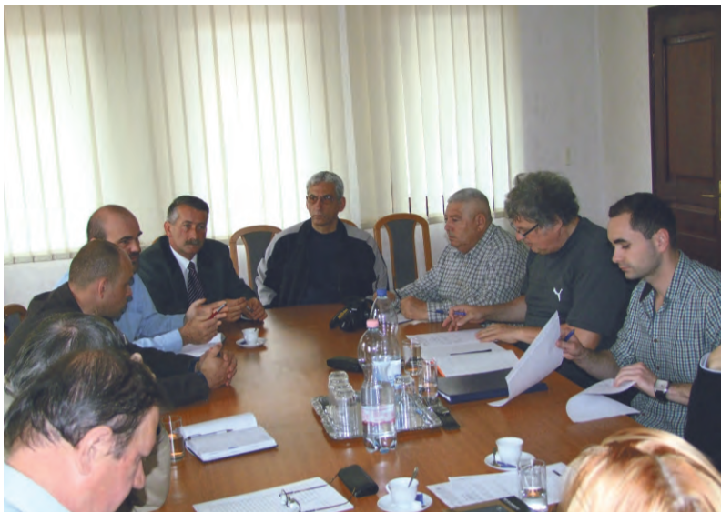
Településünk átadta a munkaterületet, megkezdődnek az előkészítő munkálatok