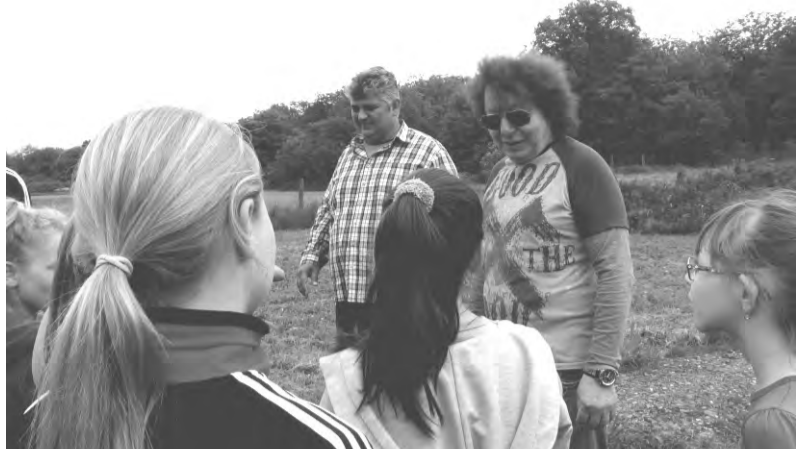
A gyerekek műsorral készültek, majd beszélgetés következett