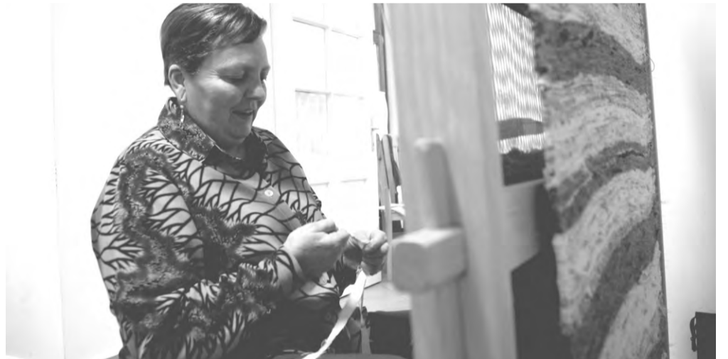
Az egyik népi kismesterség szépségeivel, a szövésseel ismerkedhettek az érdeklődők

2014. április 7-én 10 órakor nyitottuk meg rajzkiállításunkat, „Tavasz van, milyen szép tavasz van...” címmel. A gyerekek nagyon sok színes, vidám és fantázia-dús alkotást küldtek be a rajzversenyünkre. A hétfői rajzkiállítás megnyitóján hirdettünk eredményt.