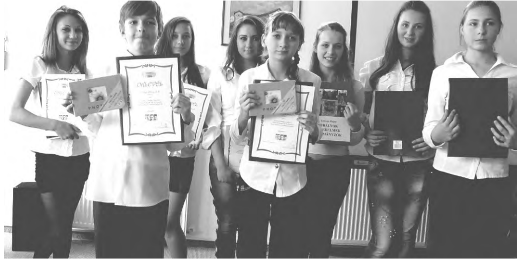
A Dobozi Általános Iskola felsős szavalóversenyének díjazottjai