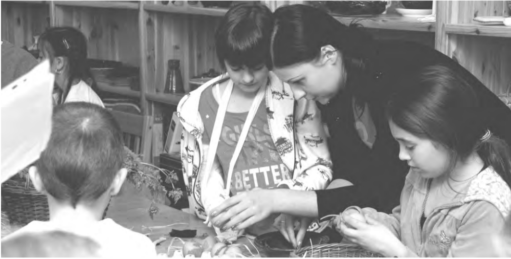
A játszóbázisban természetes anyagokból készültek a tárgyak