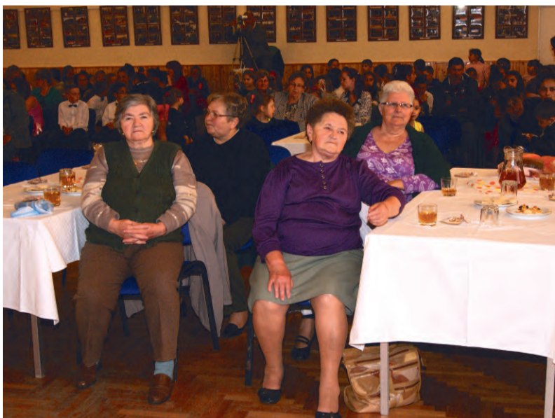
A Tehetségek bemutatóján tiszteletbeli vendégek voltak az Idősek Klubjának tagjai

A Dobozi Községi Ház és Könyvtár 2014. április 7. és 11. között rendezte meg témnapjait, mely a Művelődő gyermekközösségek a kulturális örökség szolgálatában a Körösök mentén, a TÁMOP-3.2.13-12/1-2012-0060 pályázat keretén belül valósult meg.