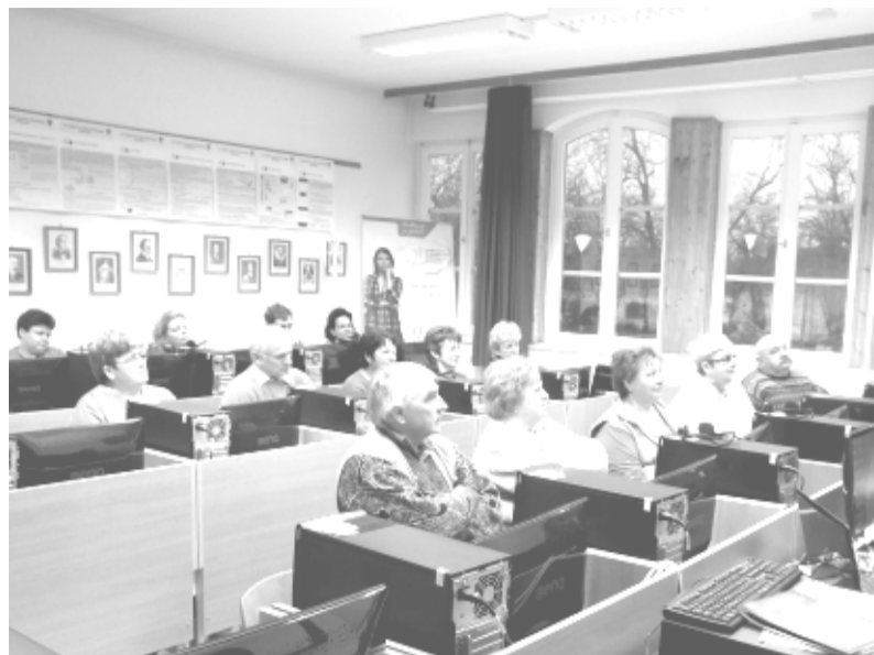
A TámoP 2.1.2. Idegennyelvi és Informatikai kompetenciák fejlesztése című projekt első dobozi képzésének hallgatói láthatók a képen. "Informatika a mindennapokban

Dobozon" címmel indult el a 78 órás tanfolyam. A cél, hogy a jelentkezők a számítógépen, a világhálón önállóan tájékozódni tudjanak, képesek legyenek emailt küldeni és információt keresni, a megszerzett tudást pedig eredményesen felhasználni mindennapjaikban.