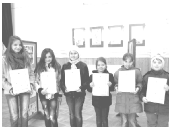
A rajzversenyre több mint 50 alkotás érkezett, a legjobbakat díjazta a zsűri