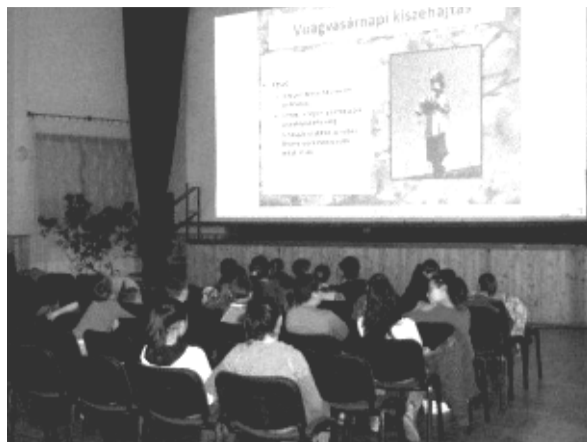
Húsvétal kapcsolatos filmvetítés színesítette a programsorozatot