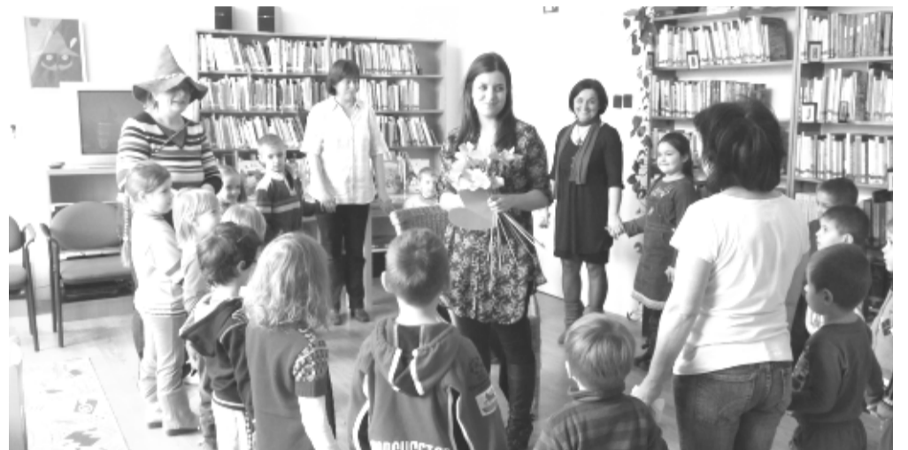
A Micimackó csoport Mesebirodalomba utazott