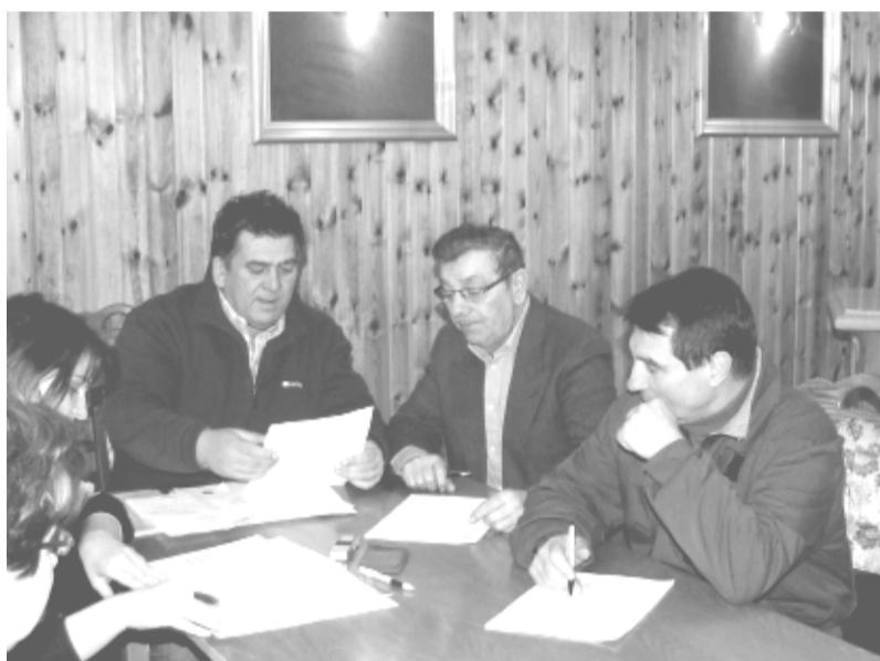
A 2012. évi költségvetésről tárgyalt a Dobozi Cigány Nemzetiségi Önkormányzat