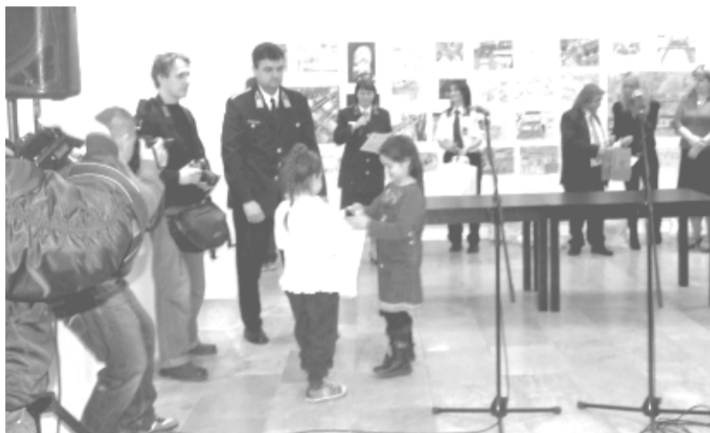
A Békés Megyei Rendőr-Főkapitányság Megyei Balesetmegelőzési Bizottsága „Közlekedésbiztonság Gyermekszemmel” címmel ebben az évben is meghirdette gyermekrajz pályázatát. E nemes verseny célja, hogy a gyermekek figyelmét felhívja a közlekedés veszélyeire, a helyes közlekedési magatartás formáira.