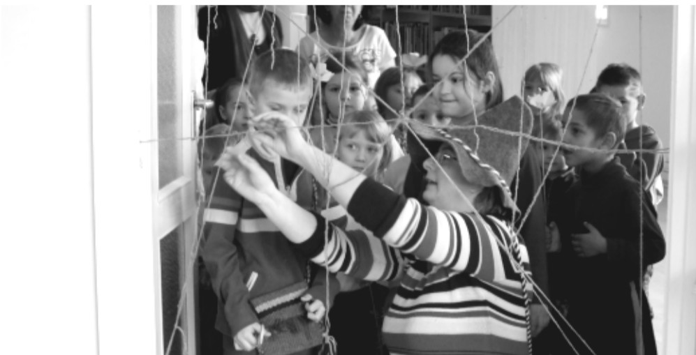
A nagy pókhálón át vezetett az út a boszorkához