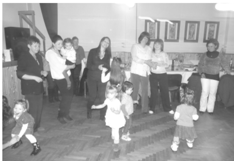
Kicsik és nagyok egyaránt jól érezték magukat