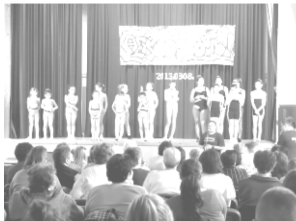
Bemutatóval egybekötött háziversennyel zárták a félévet az aerobik csoportok. Mintegy 40 sportoló mutatkozott be az eseményen.

2013. március 8-án szerveztük meg a félévi aerobik bemutatókat és az év első háziversenyét is, a Dobozi Községi Ház és Könyvtár nagytermében. A sportolók bemutatott koreográfiákat a szülőknél, családtagjaiknál és a kedves érdeklődőknél. Jelenleg 6 aerobik csoportunk működik 40 fővel, név szerint: a Little Babys, a Jumping Girls kicsik és nagyok csoportja, a Funny Kids, a Fit Kids és a Fantázia csapatok. Minden csoportnak tanítók az év során egy aerobikos, egy steppados, egy tánccos és egy közös formációt. A sportolóim ügyesen felkészültek és nagyon szépen szerepeltek, elégedett vagyok a munkájukkal.