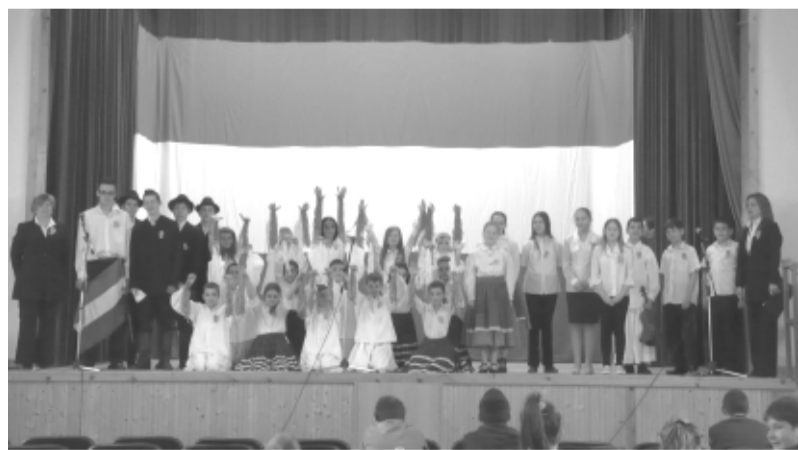
A megemlékezés szereplői a Gilikotti és az Ünneporoló szakkör tagjai voltak

„Haza. Rövid szó, mindössze négy betű. De talán nincs még szó, ami mögött annyi emlék, annyi érzés és annyi tett húzódik meg. Azt mondom: haza, s látom a falut, ahol születtem. Azt mondjuk: haza, és képzeletünkben megelevenednek