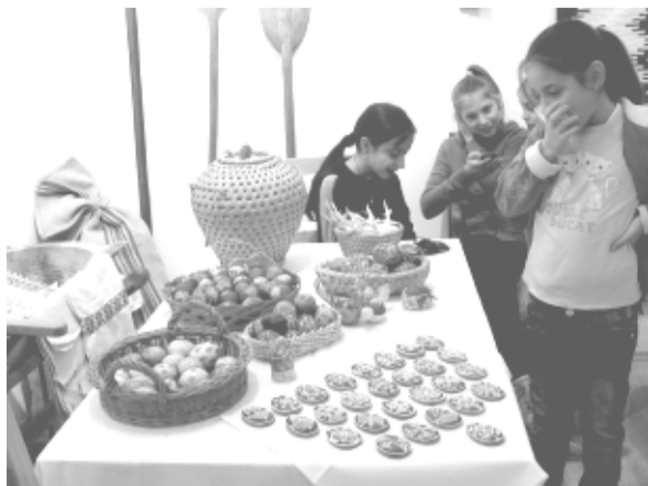
A népi játszótér témája ezúttal a húsvét volt