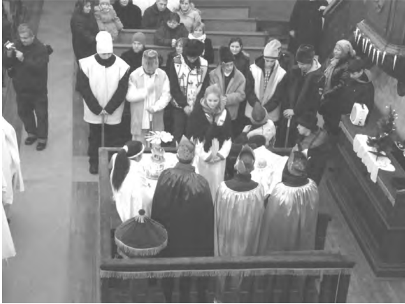
Betlehemes játék elevenedett meg a gyerekek által

Mindezzel korántsem ért véget a nap: az adventi ünnepség-sorozat negyedik alkalma a katolikus templom falai között, a nyolcadikosok betlehemes játékaival zárult. Öt órára díszbe öltöztettük a szívnket, a templom ódon falait, s a szavak, a versek megteltek a szeretet, a karácsony várásának meghitt hangulatával. A falu lakossága együtt ünnepelt, együtt néztük végig a kis Jézus megszületésének történetét. A negyedikesek verse, a Dalkör éneke, a Nagytiszteletű Úr