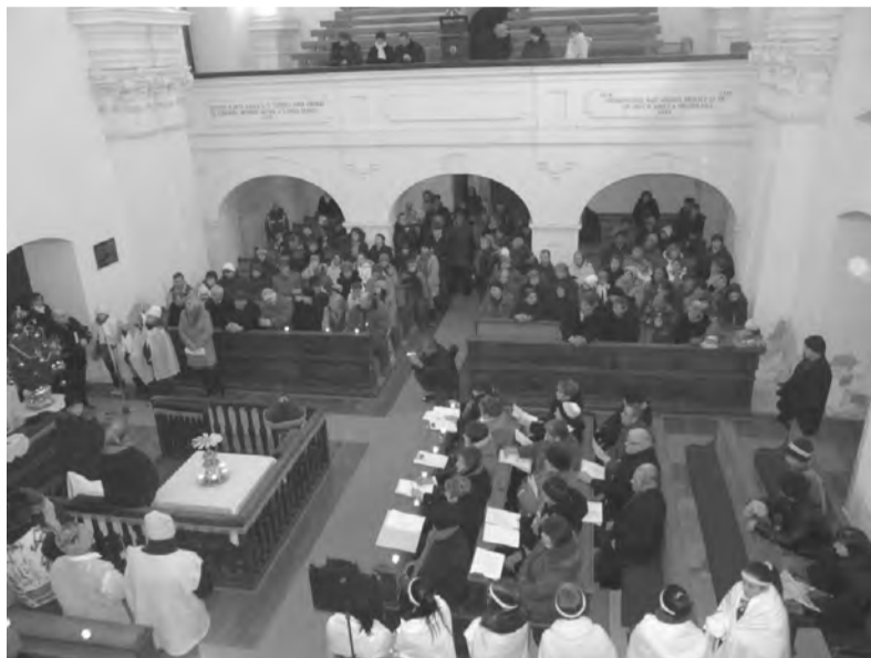
A dobozi református templomban sokan gyűltek össze karácsony előtt