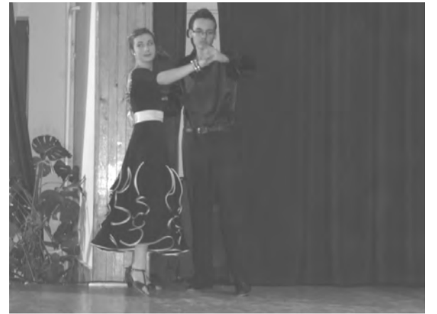
A Korda Vince Alapfokú Művészetoktatási Intézmény társastáncosai

2012 decemberében rendeztük meg ötnapos ünnepi rendezvény-sorozatunkat, amely az idén a „Karácsonyváro Hét” elnevezést kapta. Igyekeztünk sok színes és változatos programmal kedveskedni minden gyereknek és a programjainkra ellátogató kedves érdeklődőnek.