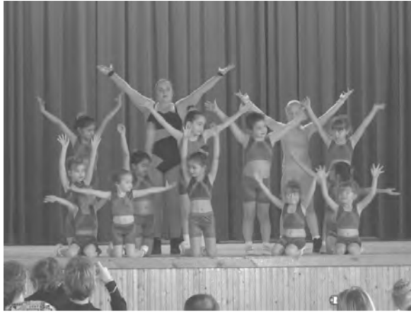
Kulich Gyula Művelődési Ház aerobikos csoportja