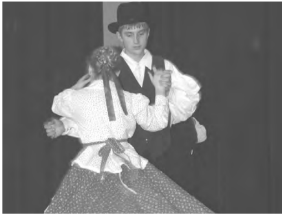
A Leg a láb Alapfokú Művészetoktatási Intézmény néptáncosai