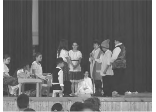
A Gilikoti színjátszó szakkör tagjai betlehemezték