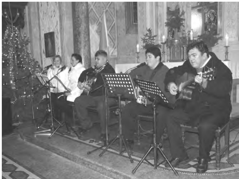
Ünnepi hangulatban telt a koncert

Az oktató és nevelő munka elengedhetetlen része a hagyományok ápolása. Fontos, hogy a gyerekekkel megtanítsuk az ősi szokásokat, megismertessük a közös ünnepelés szépségeit, s talán nekünk felnőt-