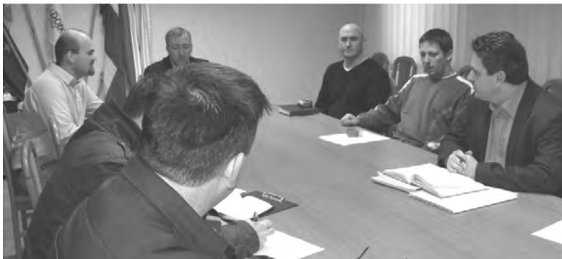
Megbeszélés terepmunka előtt

A Komplex belvízrendezési program 2 milliárd forint összköltségvetésű kiemelt uniós projekt, amely az Európai Unió 85%-os támogatását élvezi. A most induló beruházásoknak köszönhetően az érintett települések belterületén megszűnnek a belvízkárok és az utakat, valamint a felszín alatti közműveket sem rongálja tovább a belvíz. Több mint 106 ezer lakos életkörülményei javulnak, és jelentősen csökkennek a települések vé-