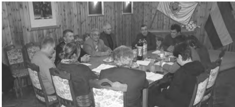
A Dobozi Cigány Nemzetiségi Önkormányzat decemberben is

A Dobozi Cigány Nemzetiségi Önkormányzat Képviselő-testülete 2012. december 10-én testületi ülést tartott, melyen több közeli településen lévő cigány nemzetiségi önkormányzattal történő együttműködési megállapodás felülvizsgálata és megújítása is napirendre került. A Képviselő-testület megtárgyalta a 2013. évi éves munkatervét, mivel a Dobozi Ci-