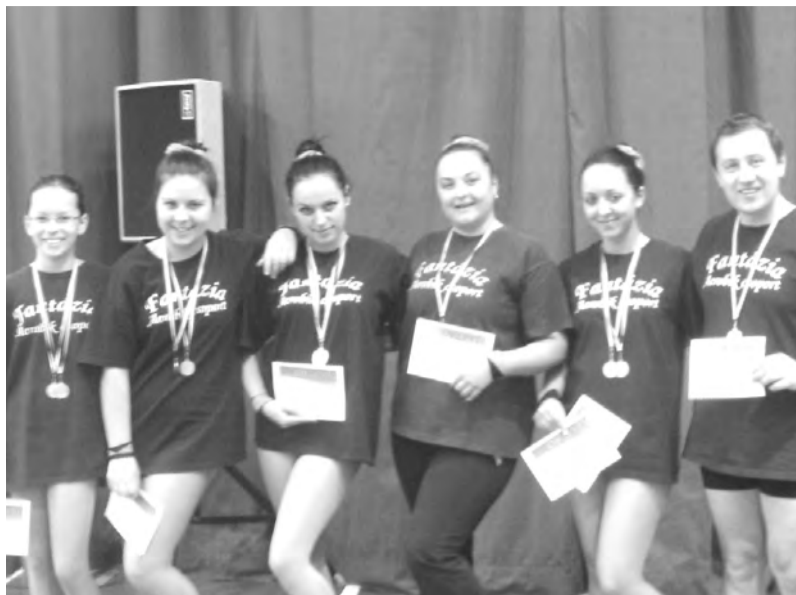
Az aerobikosok két aranyéremmel tértek haza Budaörsről

2012. december 8-án a dobozi Művelődési Ház aerobikosai Budaörsön versenyeztek, a 2012/2013-as év Országos Amatőr Dance és Step Aerobik Bajnokság II. fordulóján. Az idei év utolsó aerobikos megmérettetésére a Fantázia aerobik csapattal neveztünk.