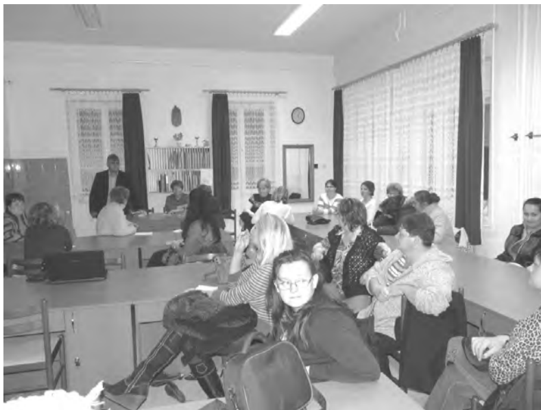
A szülői szervezet tagjai az elmúlt időszakról és a tervekről egyaránt hallhattak a találkozón

Szülőként egyik legfontosabb feladatunk, hogy úgy éljünk és tevékenykedjünk, hogy gyermekeinket boldognak és elégedettnek lássuk. Mivel ők 6 éves koruktól életük nagy részét intézményes keretek között töltik, ez a boldogság és elégedettség itt is meg kell, hogy nyilvánuljon, mert ha a gyerek az iskolában jól érzi magát, ez kihat az otthoni életére is; élményekkel gazdagon hazatérve még a vacsora is jobban ízlik, és a szülő sem baj, ha érzi és tudja, hogy csemetéje a lehető legjobb kezekben van, nyugodtan engedheti el a „tudás palotájába”.