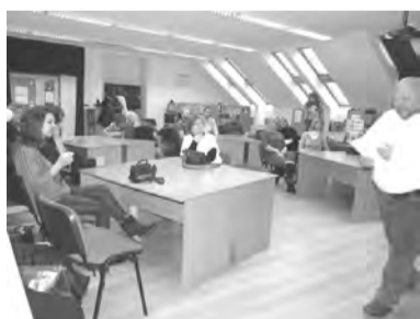
A Dobozi Általános Iskola pedagógusai tanulmányi úton vettek részt Sátoraljaiúj helyen, a Kazinczy Ferenc Általános Iskolában, ahol az integrációs oktatással kapcsolatos ismereteiket bővítették.