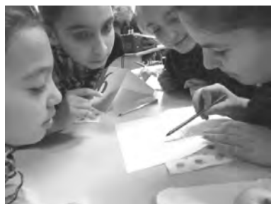
Számtalan új és hasznos információval gazdagodtak a résztvevők

Tavaly november végén egészségügyi vetélkedőt rendeztek a Dobozi Általános Iskolában. Aki nem