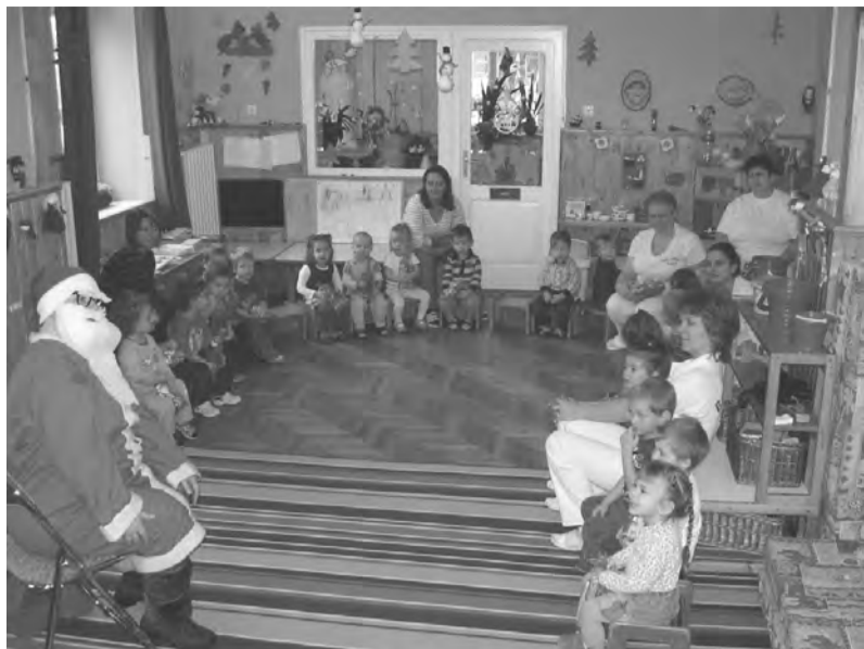
A legkisebbek várják talán a leginkább, hogy december elején meglátogassa őket a Mikulás

Idén december 16-án érkezett meg a télapó bölcsődénkbe. A kisgyermeknevelők napokkal előbb már dallal, verssel, rövid mondókaival, képnézegetéssel készültek az ünnepre, és várták a Mikulást, illetve a cukorral, csokoládéval, gyümölcscsel, játékokkal megrakott szánját!