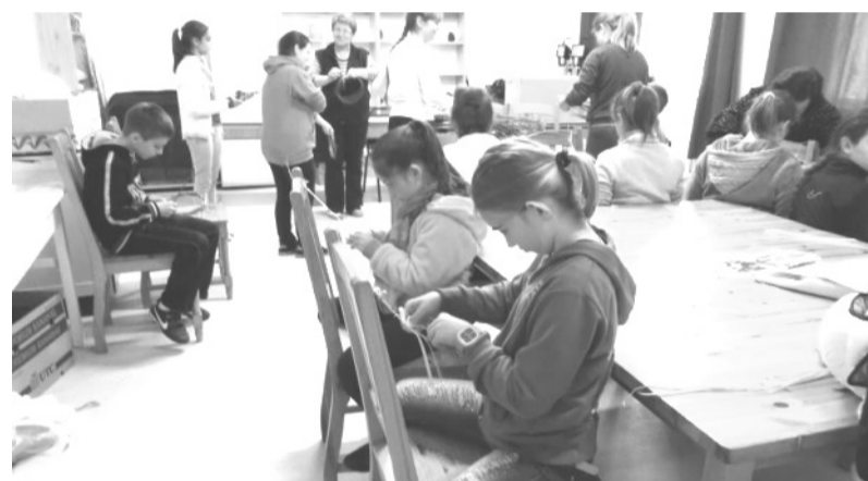
Hagyományos népi kismesterségekkel ismerkednek a tanulók

Községünkben hagyománya van a népi kismesterségek művelésének. Ezeknek a csírát már próbáltuk belopni a rendszeresen szervezett játszóházainkba. A projekt folyamán szeretnénk, hogy minél közelebb kerüljenek tanulóink ezekhez a tevékenységekhez. Hozzanak létre olyan alkotásokat, amelyek többféleképpen is értéket jelentenek.