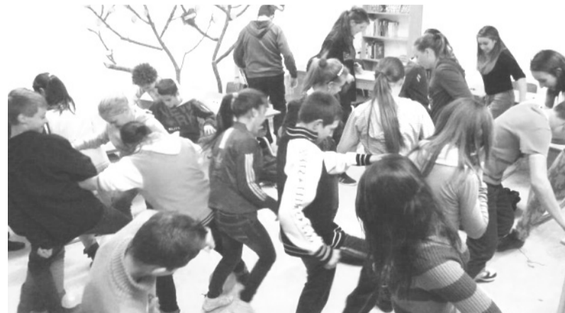
Az egészséges életmódhoz a mozgás is hozzátartozik