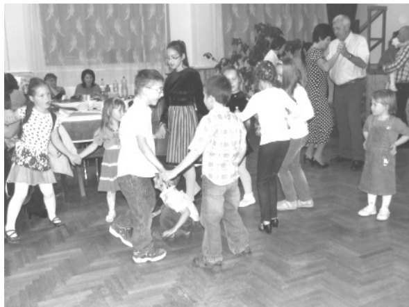
Azért bál a bál, hogy táncoljunk – a gyerekek táncoltak