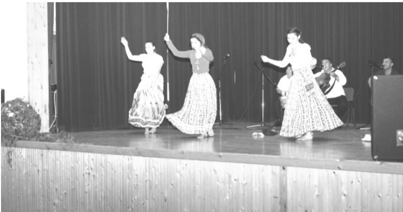
A Fekete Gyémántok zenekar mősora táncosokkal egészült ki