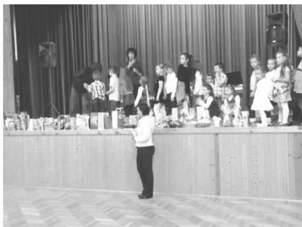
A gyerekek nagy örömmel húzták a tombolát

A következőkben az alapítvány tevékenységéről hallhattunk néhány szót, melyet az érdeklődők képek formájában is megtekinthettek az előtérben rendezett fotókiállításon. Láthatták a vidám arcokat a gyerekek hete rendezvényei során, a Mikulás érkezésekor, az új csúszda birtokbavételekor, valamint a szülők is láthatták magukat, amikor tevékenyen részt vettek munkánkban, ezzel támogatva a gyerekeket. Örülünk annak, hogy egyre több család jön el a bálba kisgyermekestül, és annak is nagyon örülünk, hogy egyre nagyobb a bizalom alapítványunk és munkánk iránt; jelzi ezt az adók egy százalékának minden évben egyre magasabb összege. Kérjük, tartsák meg jó szokásukat, s ezen túl is gon-