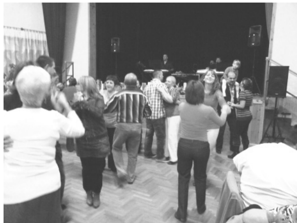
Könnyen megtelt a táncparkett