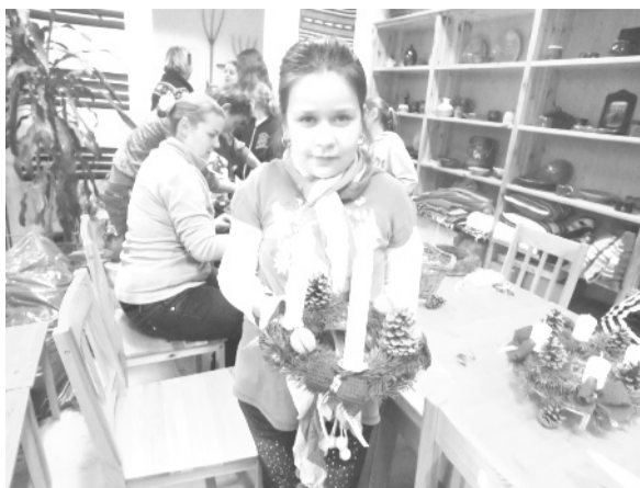
Elkészült az adventi koszorú