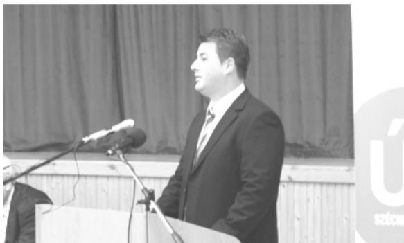
Erdős Norbert országgyűlési képviselő, Békés megyei kormány megbízott