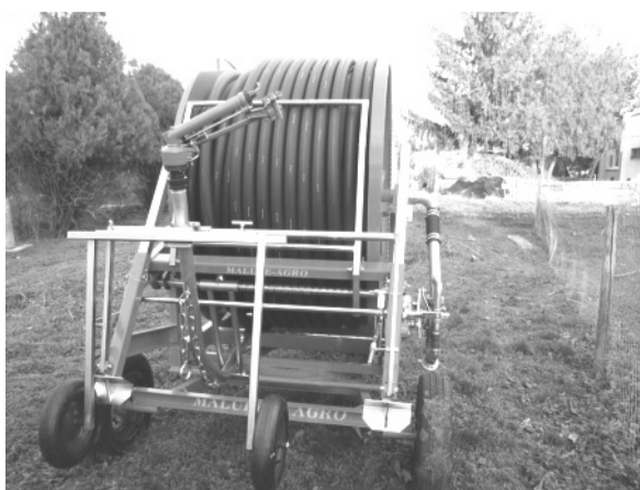
Az önkormányzat a mezőgazdasági közmunkaprogram keretében automata öntözőrendszert vásárolt, mellyel a 2014-es évben már sokkal eredményesebb konyhákerti növénytermesztést tud folytatni.