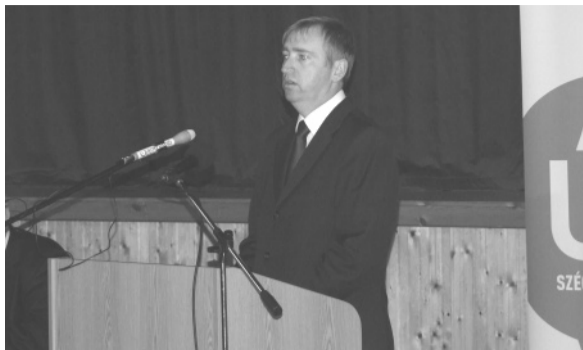
Simon István Tamás polgármester köszöntötte a megjelenteket