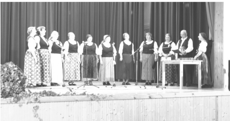
A délután során egymás kultúrájába nyertek bepillantást a résztvevők

A rendezvény szervezői, a Nemzeti Művelődési Intézet Békés Megyei Irodájának munkatársai elmondták: