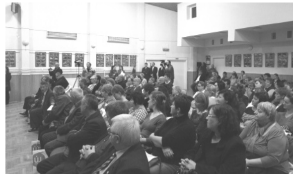
Településünk történetének legnagyobb beruházását ünnepélyes keretek között nyitották meg