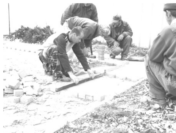
Parkoló épül a Dobozi Községi Ház és Könyvtár udvarán az Önkormányzatunknál foglalkoztatottak bevonásával.