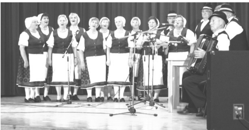
A konferenciát követően a Békés Megyei Nemzetiségi Gála várta az érdeklődőket