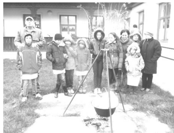
Halászlé rottyogott a bográcsban

A Dobozi Községi Ház és Könyvtár 2013. november 26-tól december 1-ig megvalósuló témnapjai a Művelődő gyermekközösségek a kulturális örökség szolgálatában a Körösök mentén, a TÁMOP-3.2.13-12/1-2012-0060 pályázat keretei belül valósult meg.