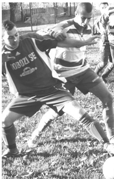
Nagyszerű csel hazai pályán

A megyei II. osztályban játszó Dobozi SE októberi-novemberi mérkőzéseinek eredményei: