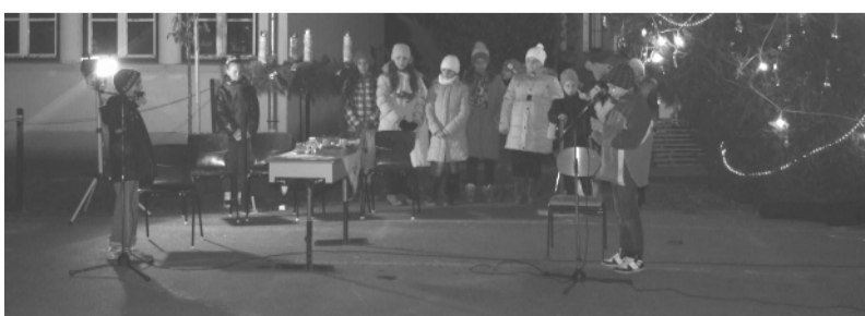
A Gilikotti szakkör karácsonyi műsorát advent első vasárnapján láthattuk