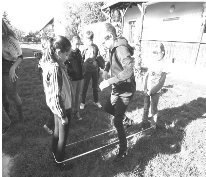
Régen játszott játékokat is kipróbáltak a gyerekek