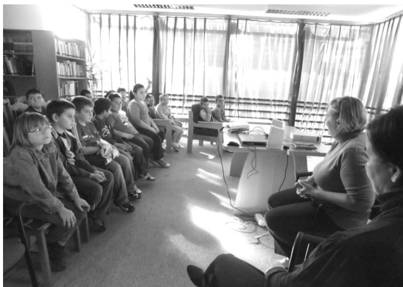
Az önzetlenségről és önkéntes munkáról esett szó

Tartalmas hetet tudhatunk magunk mögött, melynek során az emberi kapcsolatok lehetséges módjait térképeztük fel. Jártunk családi körben, voltunk egymás barátai, dolgoztunk a közösségért, nemes célok érdekében, felelevenítettünk nyári közös élményeket, együtt élveztük az zene és az irodalom „szerelmi-dallamát” és egy honfitársunk révén nemzetközi kapcsolatokra is szert tehattunk, még ha csak átvitt értelemben is. Együtt és meglátásom szerint kellemesen töltöttük el az