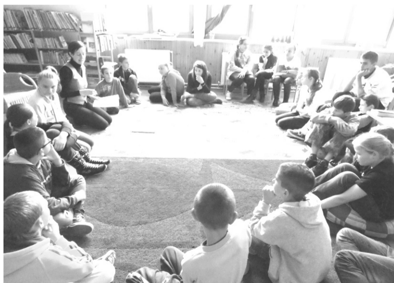
Erőszakmentes problémakezelésre kaptak tanácsot a résztvevők

„Könyvtárak az emberi kapcsola- tokért” - Országos Könyvtári Napok rendezvénysorozatát tartottunk a Do- bozi Községi Ház és Könyvtárban.