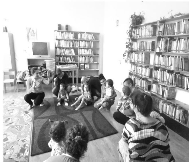
A Kerekítő foglalkozás ölbéli játékokat tartogatott