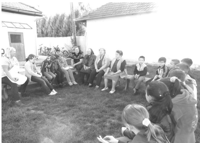
Érdekes történetek által elevenedett meg a múlt