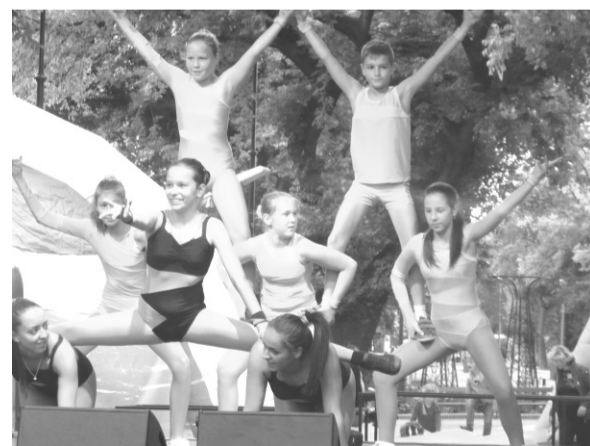
Békéscsaba főterén két aerobik csoport nyolc sportolója lépett fel a Csabai Tér-Erő elnevezésű rendezvény keretében

2013. szeptember 24-én, kedden a Doboz Községi Ház és Könyvtár aerobikosai meghívást kaptak a Csabai Tér-Erő csoport programjára. A szervező gárda azt a célt tűzte ki maga elé, hogy tenni kíván a kultúráért és a fiatalokért, szándékukban áll minden hónapban egy alkalommal hasonló prog-