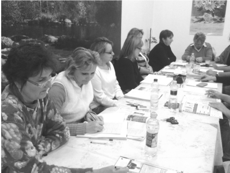
Az angol nyelv tanulása mellett más népek szokásaival is ismerkednek a tanfolyam résztvevői

A TÁMOP-2.1.2/12-1-2012-001 jelű pályázat és a Lingva Nyelvstúdió jóvoltából a Mozsárcsokorlatozottak Békés Megyei Szervezete Dobozi Csoport élt a lehetőséggel, hogy Dobozon is indulhasson angol nyelvtanfolyam, s ezzel is a dobozi tanulni vágyó embereket segítse.