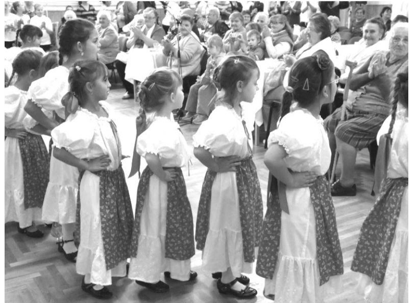
Néptánc, népdal, népzene a gyerekek közreműködésével