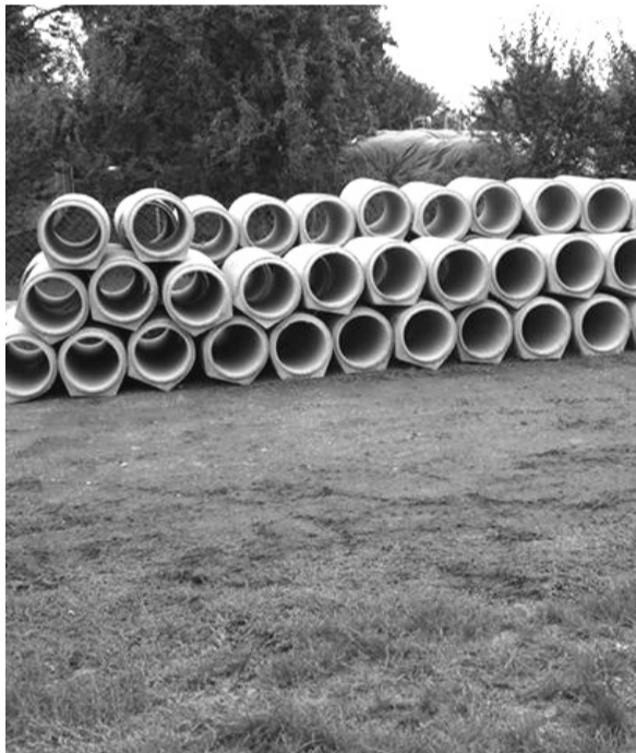
A belvízkárok megelőzése érdekében zajló munkák – 15% -os önerő mellett – az Európai Unió társfinanszírozásával, a Magyar Állam támogatásával valósulhatnak meg.

Békés megyében a sajátos természetföldrajzi és település-szerkezeti adottságok, valamint a szélsőséges csapadékviszonyok miatt jelentős károkat okoz a belvív. Ezért a megye több települése összefogott, hogy közösen nyújtsanak be pályázatot a belvízkárok megelőzésére. 2005-2006-ban már településünkön több utcában (pl.: Zöldfa, Hold, Petőfi, Faluhelyi, Áchim) zárt csatorna, burkolt árok, megépítése, műtárgy elhelyezése valósult meg. A beruházás már elkezdődött Kondoroson és Békésen. Dobozyon a napokban kezdődik meg a kivitelezés. A projekt összköltsége 2 milliárd 197 millió forint, ennek 85%-át, 1 milliárd 868 millió forintot az Európai Unió társfinanszírozásával a Magyar Állam biztosít, 15%-ának fedezetét a települések önerőből vállalták. A közel