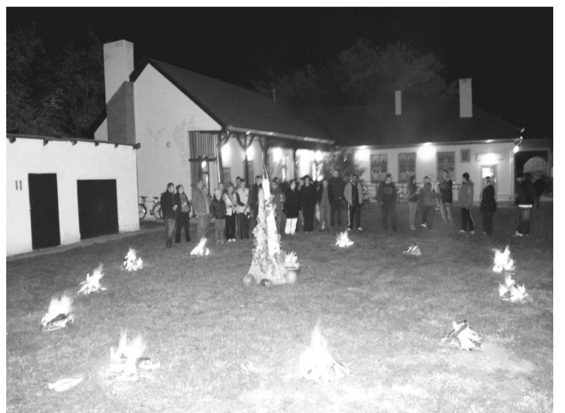
Az „Itthon vagy – Magyarország, szeretlek!” program keretében lobbant fel Szent Mihály tüze