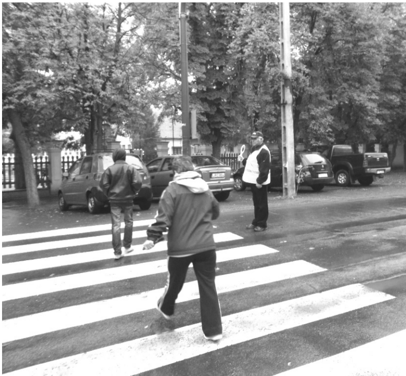
A Dobozi Polgárőr Egyesület a tanév teljes első hónapjában segítette az iskola előtti gyalogátkelőhelynél a tanulók biztonságát.