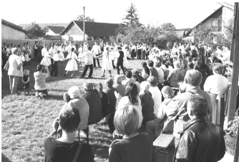
A szüreti felvonulást sokan kísérték figyelemmel

2013 szeptemberében az „Itt a szüret, áll a bál” elnevezésű rendezvénysorozatunkat a „Művelődő gyermekközösségek a kulturális örökség szolgálatában a Körösök mentén” TÁMOP-3.2.13-12/1-2012-0060 pályázati keretből sikerült megvalósítanunk.