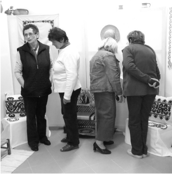
Népművészeti kiállítást rendeztek be Szőlőfürtnek gyöngyszemei címmel