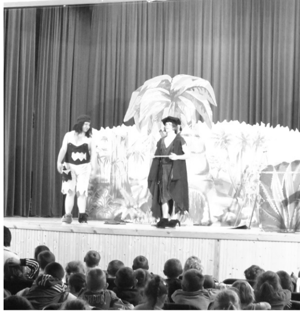
Az „Ősi suli” című darabot a Szegedi Miniszínház mutatta be