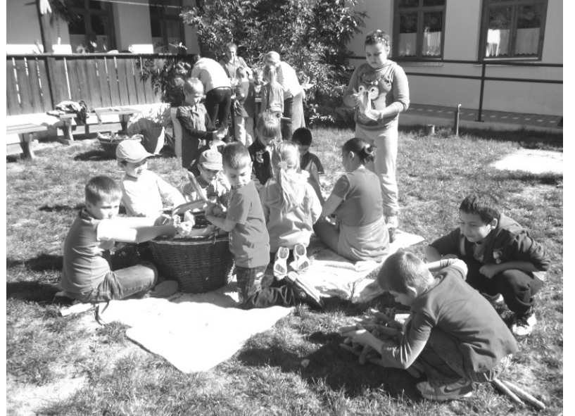
A népi alkotóházban a természetes anyagokkal ismerkedtek a gyerekek

Szeptember 26-án, csütörtökön a vidámságé, a néptáncé, a népdalé és a népzeneé volt a főszerep, ahol a dobozi tehetséges gyermekek egy színes programmal kedveskedtek, a Dobozi Idősek Klubja tagjainak. A színpadon felléptek a Mesekert Óvoda néptáncosai, a Dobozi Általános Iskola tehetséges gyermekei, a Dobozi Népdalkör tagjai és a Dobozi Községi Ház és Könyvtár táncosai.