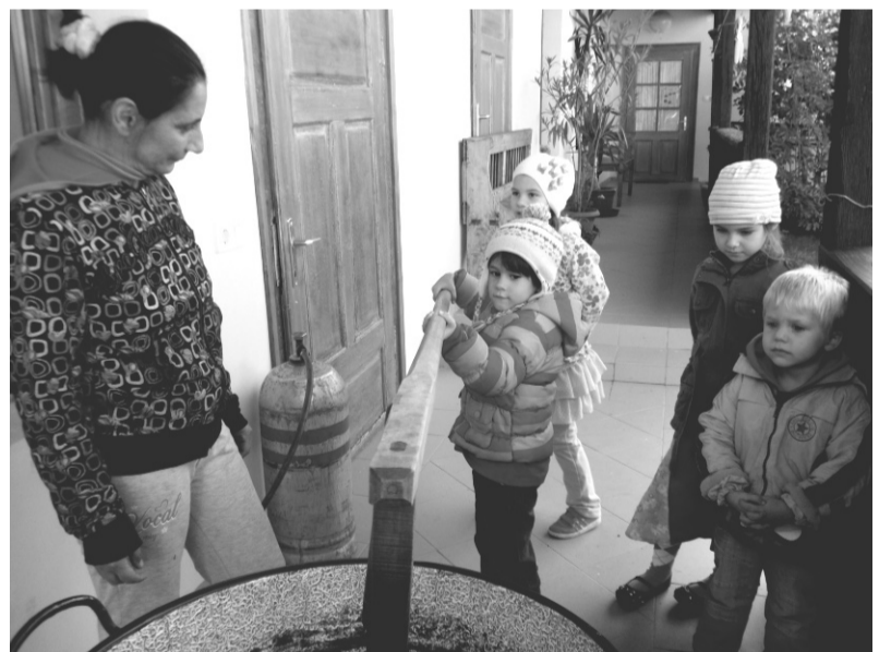
A hagyományörző napon szilvalekvárt főztek a résztvevők