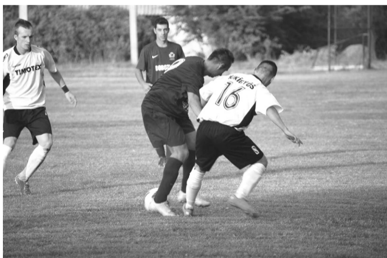
Pillanatkép a Doboz – Újkígyós mérkőzésről

A megyei II. osztályban játszó Doboz SE augusztusi-szeptemberi mérkőzéseinek eredményei: