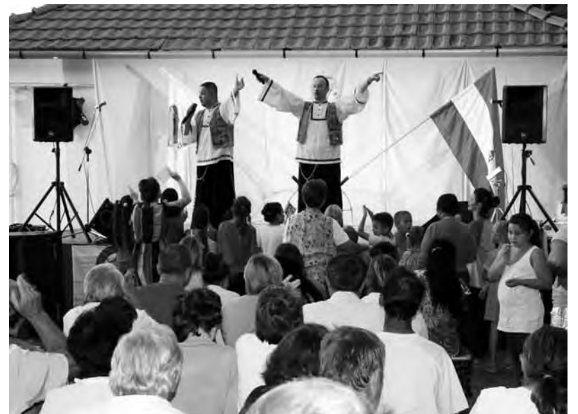
A mulatós zenék képviselője, a 2005-ben alakult Kredenc együttes jól ismert dalokat szólaltatott meg a dobozi színpadon