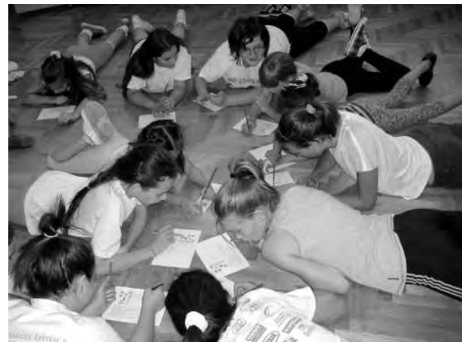
Játékos rejtvény kitöltése

A második órában pedig inkább gyakorlati feladatok voltak, amelynek elsősorban a testünk, izmaink működésének felfedezését és a gyermekek mozgáskultúrájának, keringési, légzési és mozgásrendszerének megfelelő