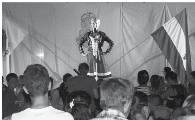
A magyar népi hagyományokat tisztelő énekesnő gazdag repertoárral érkezett településünkre.

Az augusztus 20-ai hosszú hétvége szerte az országban színes programokat tartogatott. Így volt ez községünkben is, ahol a népszerű előadók nótacsokor-