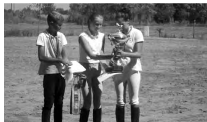
A kupát büszkén vették át a legeredményesebb csapat tagjai