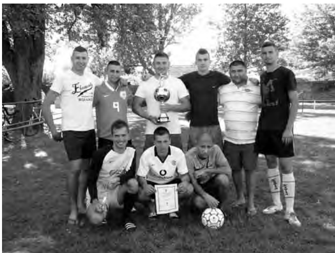
A Bieder csapata az utóbbi években nem talált legyőzőre. Idén is ők nyerték a kupát.