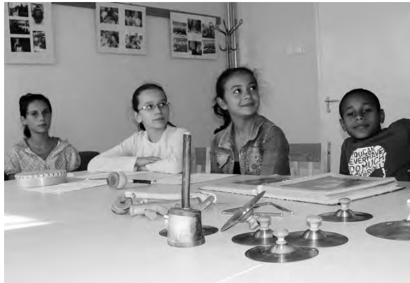
A magyar népzene szeretete köti össze a szakkör tagjait.

A TÁMOP-3.2.11/10-1-2010-0015 azonosító számú „Művelődő gyermekközösségek a szebb jövőért” – szemléletformálás a Körösök mentén című pályázat keretében működött a Bartók nyomában nevet viselő szakkör.