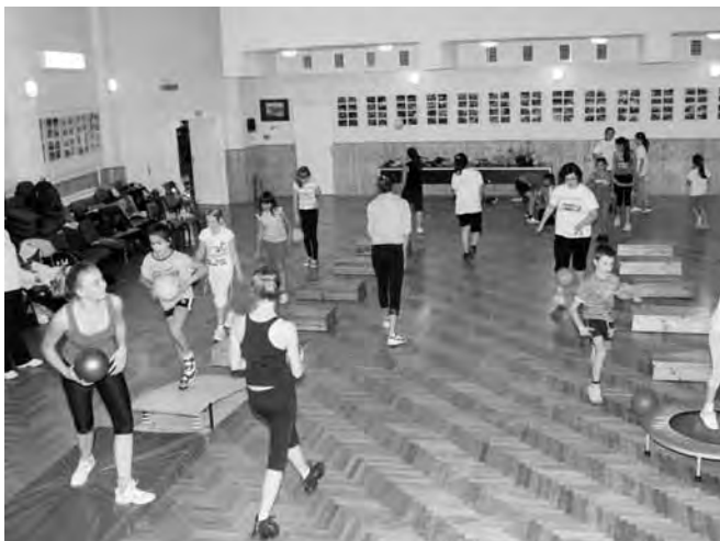
Sorozatok végzése különböző sporteszközökkel

2012 szeptemberében egy pályázati projekt keretében indítottuk az „Ép testben ép lélek” – Egészséges életmódra nevelés szervezett szabadidős sporttevékenység által – alkalmanként 2 órás, heti szakkörünk, 30 fő általános iskolás gyermekekre tervezve.