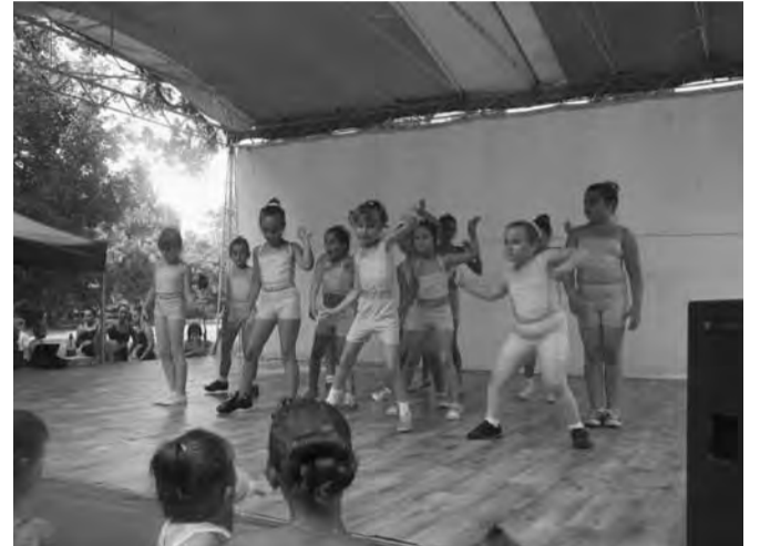
Az aerobik bemutatón ritmusra jártak a kezek és a lábak

A zenés produkciókat táncos műsorszámok követték. A Leg a Láb Alapfokú Művészetoktatási Intézmény helyi növendékei különböző tájegységek táncait mutatták be, míg a Korda Vince Alapfokú Művészetoktatási Intézmény tagjai tánclépéseikkel olyan messzi vidékekre kalauzolták el az érdeklődőket, mint Latin-Amerika vagy Anglia.