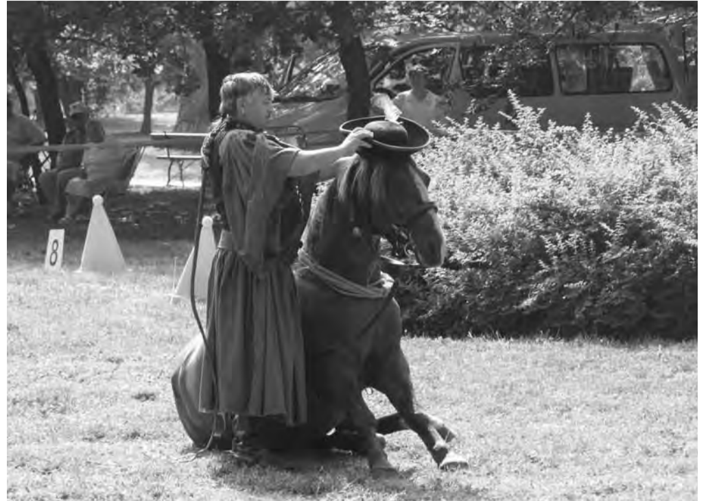
A csikós bemutató bőven tartogatott meglepetéseket