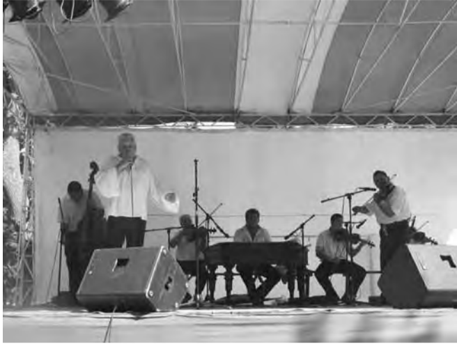
Déli-dobben jó ebédhez szólt a nóta