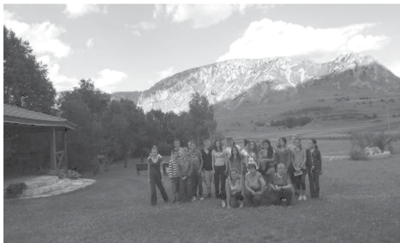
Háttérben a méltóságáteljes Székelykö

Már többször is beszámoltunk arról, hogy a dobozi Kulich Gyula Művelődési Ház a Társadalmi Megújulás Operatív Program Nevelési-oktatási intézmények tanórai, tanórán kívüli és szabadidős tevékenységeinek támogatása című felhívásra 43.880.445 Ft összegű támogatást nyert a