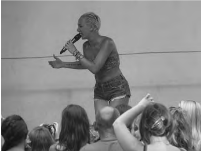
Tóth Gabi – az est sztárvendége – remekül érezte magát a dobozi színpadon