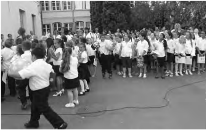
A nyári szünet nyitányaként labdák hullottak a magasból.

Igazán öröm volt látni rajtuk a büszkeséget miközben átvették jutalmukat a jelenlévők elismerő pillantásai közepette. „Közületek sokan folyamatosan, tanórától tanórára, de voltak olyanok is, akik hajrázva az év végi hetekben, így teljesítették osztályuk, tantárgyaik előírt követelményeit. Voltak, akik kiemelkedő teljesítményt nyújtottak: Alsó tagozaton 22, felső tagozaton 10 kitűnő tanulónk lett. Sajnos voltak, akiknek elégtelen osztályzat, osztályzatok kerültek a bizonyítványba. Alsó tagozaton 6, felső tagozaton 3 tanuló bukott. 3 felsős tanuló a sok hiányzás miatt kényyszerül osztályozó vizsgára. Arra kérem ezeket a tanulókat, hogy készüljenek a nyáron, mert nem lesz kegyelem kettes!”-nyomatékosította igazgató úr beszédében.