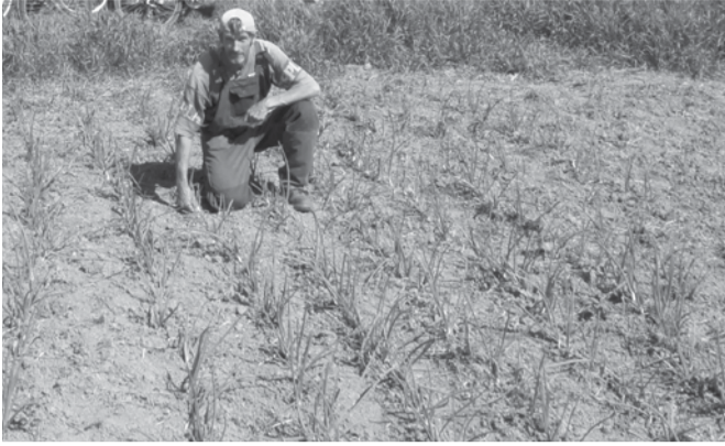
Közfoglalkoztatottak művelik a község földjét

A 2012. július 9-én megtartott V. Dobozi Mézes Fesztivál főzőversenyéhez Önkormányzatunk a dobozi közfoglalkoztatottak által megtermelt több mint 100 kg vöröshagymát tudta kiosztani a csapatok részére. A közfoglalkoztatás életében ez szép eredménynek számít, mivel korábban ilyen formában az értéktérítés nem