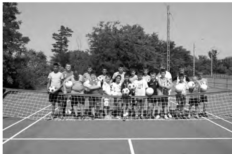
A gyerekek a tábor alatt elsajátíthatták a lánbtenisz alapjait