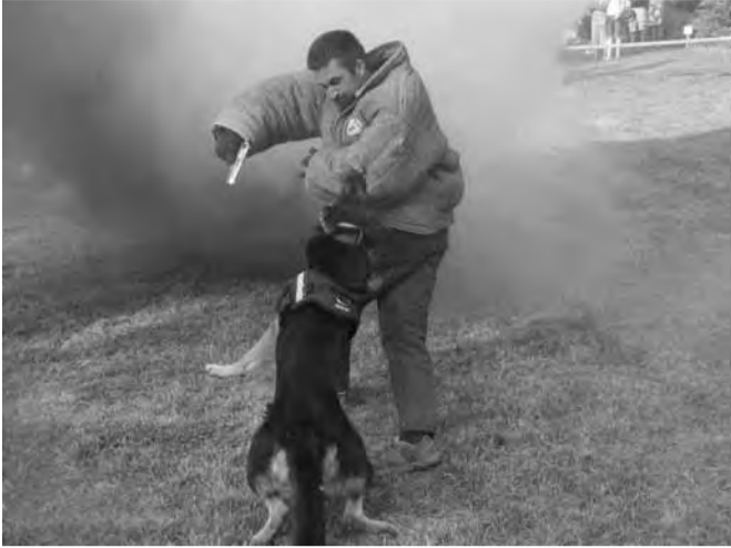
Szimulációs gyakorlat során mutatkoztak be a rendőr-kutyák