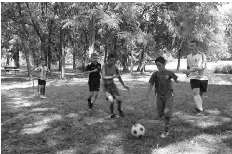
A nagy meleg elől volt, hogy a ligetbe bújtunk el játszani