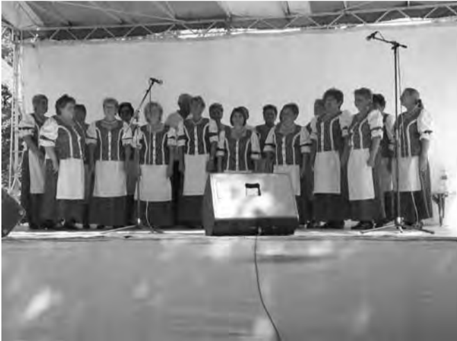
A Dobozi Népdalkörrel a közönség is együtt énekel