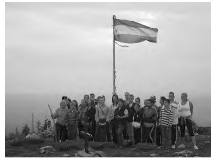
A Hargita tetején a kiránduló csapat

Elmentünk reggel a szalmakalap múzeumba. Fel is lehetett próbálni némelyiket, illetve kicsit belekukkantani a kalapkészítés rejtelseibe. Homokköveket nézhettünk meg, némelyiknek érdekes formája megdolgoztatta a fantáziánkat (pl.: kacsza, fagylalt, nyúl vagy éppen egy beszélő kő). Ezután ki is lehetett próbálni a szalmakészítés mesterségét. Lehetett csinálni angyalt, gyűrűt; különféle fonásokat tanulhattunk meg, némelyikünk még szitakötőt is készített. Meglátogattunk egy régi református templomot, kiválóan lehetett ott hűsölni. Búcsúztunk az ottani emberektől és már mentünk is Parajdra a sóbányába. Lelele busszal mentünk. Kicsit hűvös, de érdekes és magával ragadó élmény volt. Kint ba-