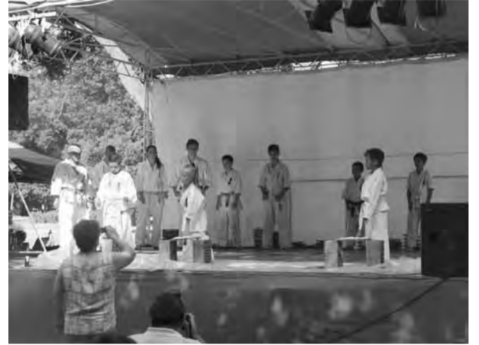
A karate bemutatón látható színes övek a sportolók szintjét jelzik