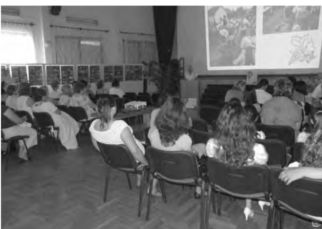
A Dobozi Népdalkörrel a közönség is együtt énekel

A dobozi Kulich Gyula Művelődési Ház a Társadalmi Megújulás Operatív Program Nevelési-oktatási intézmények tanórái, tanórán kívüli és szabadidős tevékenységeinek támogatása című felhívásra 43.880.445 Ft összegű támogatást nyert a TÁMOP-3.2.11/10-1-2010-0015 azonosító számú „Művelődő gyermekközösségek a szebb jövőért” – szemléletformálás a Körösök mentén című pályázatán. A pályázat célja, hogy a gyerekeket bevonjuk új tanulási programokba annak érdekében, hogy szabadidős tevékenységükben a leghatékonyabban segítsük kulturális nevelésüket, kompetenciafejlesztésüket, szemléletformálásukat, életmódjukat. A kivitelezés kez-