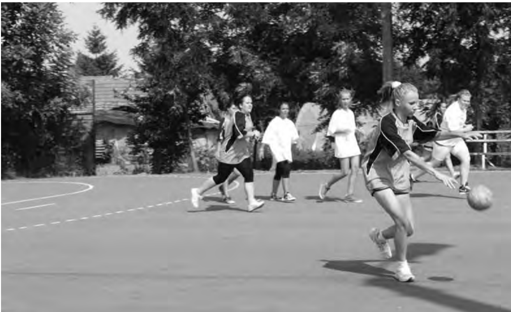
A barátságos mérkőzések a felkészülést segítették

A Mézes fesztivál programjaival párhuzamosan a kézilabda-pályán is pörögtek az események, illetve a labda, hiszen Dobox felnőtt és ifi csapata a sarkadi sporttársakat látta vendégül.