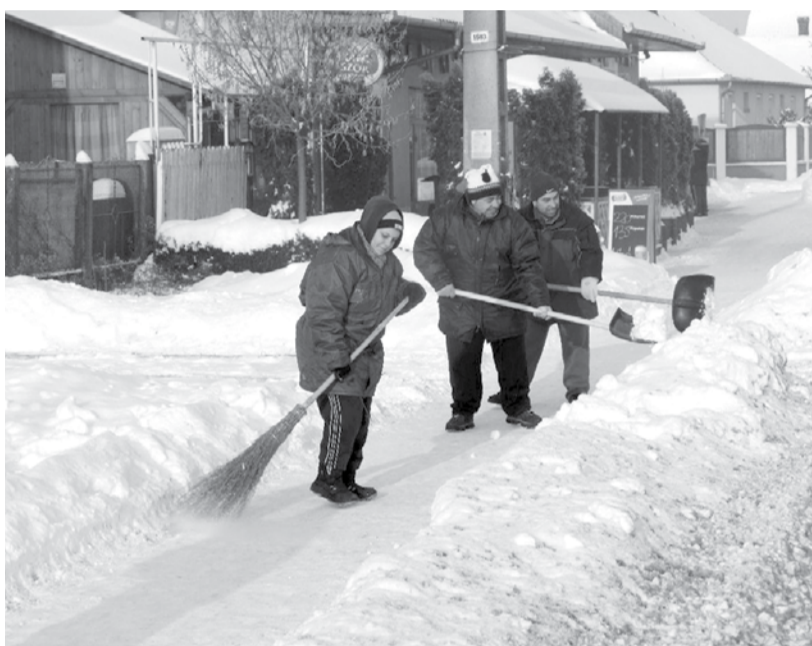
Településünkön rövid idő alatt vált járhatóvá a kerékpárút és az úttest

Csapadékosan indult az idei február. Az első hétvégén (péntektől vasárnapig) 50 cm hó hullott.