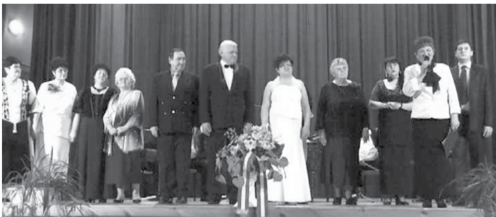
A magyarnóta est közreműködői

A kulturális hét zárónapján a magyarnóta kedvelői gyűltek össze 2012. január 22-én a művelődési ház nagytermében, hogy egy egész estét töltsenek együtt a remek muzsikák társaságában. A 12 fellépőt felvonultató eseményen felcsendültek a már jól ismert friss dalok és hallgatós nóták egyaránt.