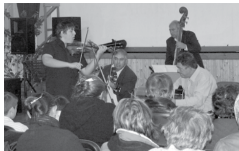
A könyv bemutatójának egyik mozzanata: öröme a javából