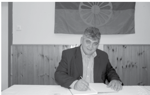
A dobozi cigányok képes könyvét Iránytű címmel Zsigmond Károly írta, szerkesztette.