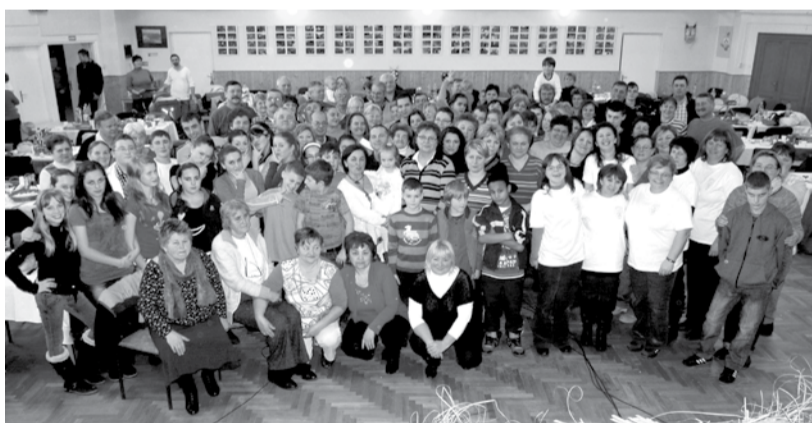
A játék végén közös kép készült a résztvevőkről

Idén kilencedik alkalommal vehetünk részt a mindig sok meglepetést rejtő, tanulságokkal szolgáló helytörténeti vetélkedőn. Az esemény népszerűsége szemernyi sem csökkent, ezt mi sem bizonyítja jobban, mint hogy az érdeklődés évről évre nő. Idén tizenöt csapat gondolta azt, hogy játszik egyet ezen a januári péntek estén. Am ezt a játékot jócskán elő kell készíteni!