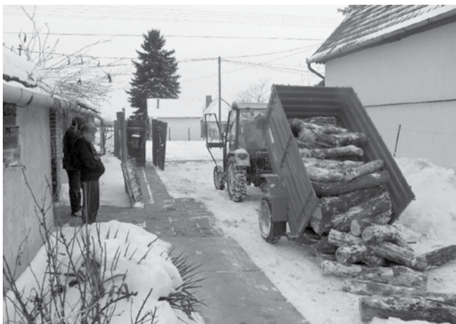
Természetbeni juttatásként fát osztott az önkormányzat