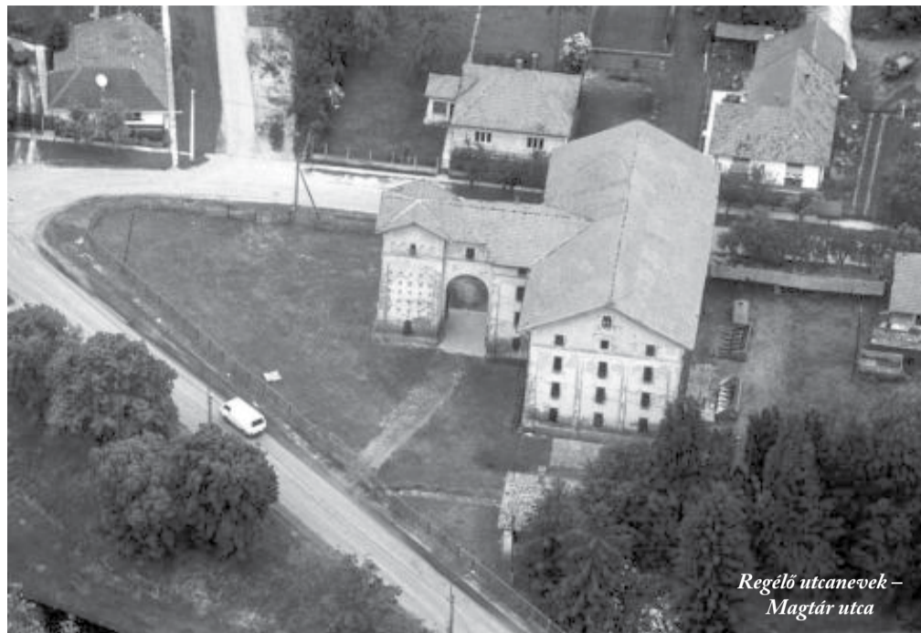
Regélő utcanevek – Magtár utca

Dobozról Vésztő felé haladva találkozunk a Magtár lenyűgöző épületével, mely nevet is adott annak az utcának, amelyben áll.