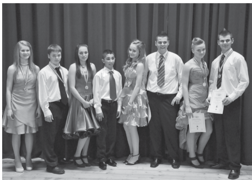
Az idei év bálkirálynői, -királyai, -hercegnői, -hercegei