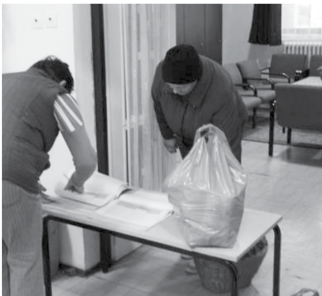
600 csomagot osztottak ki az EU Élelmiszersegély-program keretén belül a dobozi Gondozási Központban november 13-án, kedden és november 14-én, szerdán. A csomagokba tartott élelmiszerek kerültek