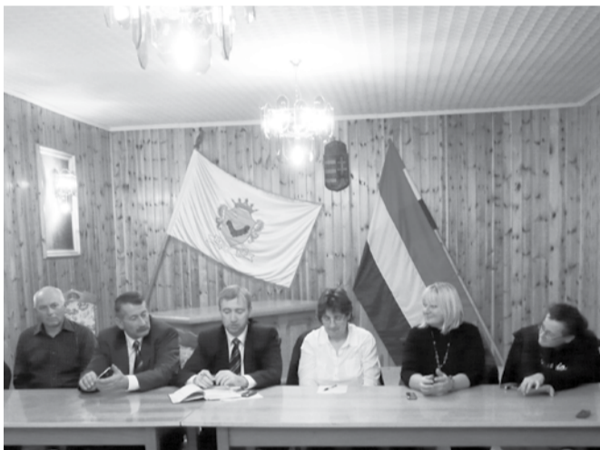
Doboz Nagyközség Önkormányzatának Képviselő-testülete 2012. november 15-én közmeghallgatást tartott. A következő közmeghallgatás 2013 novemberében esedékes, ám a képviselő-testület havonkénti nyílt ülésén bárki részt vehet.

2012. november 15-én az önkormányzati törvény rendelkezéseinek megfelelően megtartották a minden évben legalább egyszer kötelező közmeghallgatást, ahol a választópolgárok és a helyben érdekelt szervezetek képviselői közérdekű kérdést és javaslatot tehetnek fel a polgármesternek, a képviselőknek és a jegyzőnek.