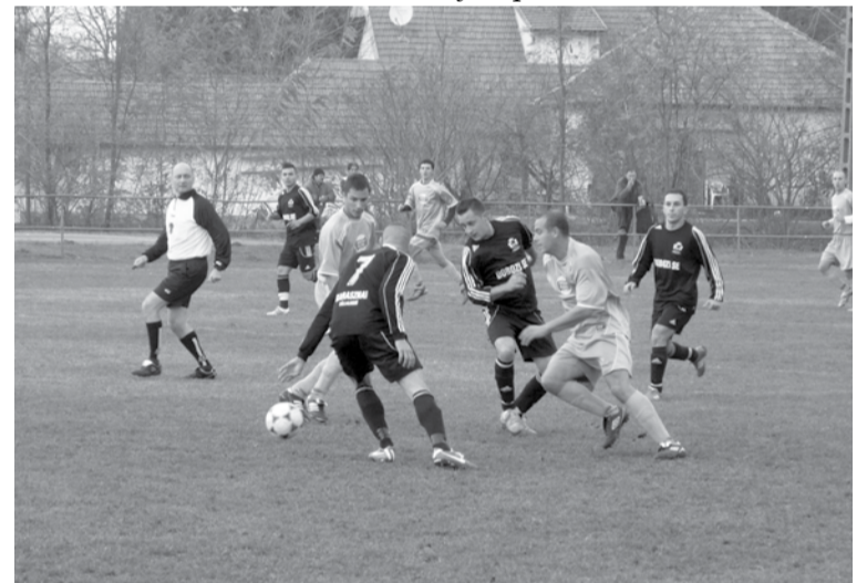
Könnyed manőver az ellenfelek között