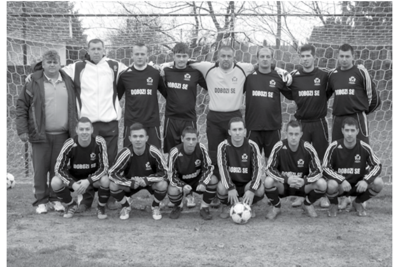
A Dobozi SE felnőtt csapata