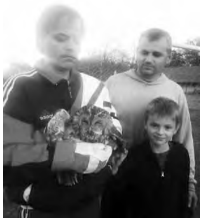
Egy baglyot sikerült kimenekítenie a hálóból a mentőcsapatnak