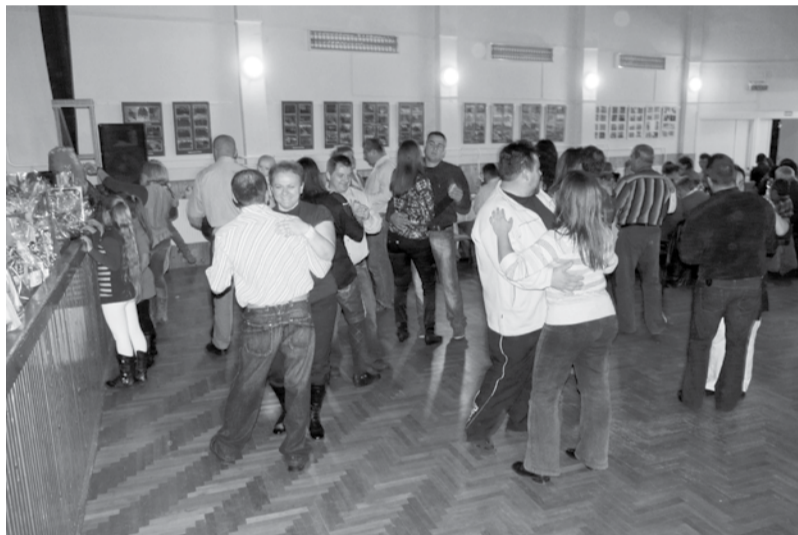
Az idei ovibál is jó célt szolgált; emellett nagyon jól sikerült az este a bemutatókkal, tombolával, tánccal

Jó dolog bálba járni. Mert kicsit kiemel a hétköznapokból, feltölt és új erőt ad a további feladatokhoz. És ha mindezt ráadásul jó cél érdekében tesszük, akkor dupla az öröm. November 10-én ovibálba mentünk jó célért mulatozni: a teljes