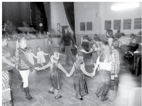
Azok is jól mulattak, akik miatt a rendezvény létrejött; a gyerekek örömmel vették birtokba a táncparkettet

Jó volt bálba menni. Mert kiemelt a hétköznapokból, feltöltött és erőt adott. És jó célért tettük: a dobozi óvodát és óvodásait, a gyermekeinket támogattuk ezzel.