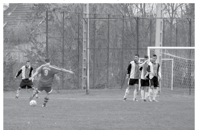
Az ellenfél többnyire érvényesítette a szabadrúgásokat

A megyei II. osztályban játszó Dobozi SE novemberi mérkőzéseinek eredményei