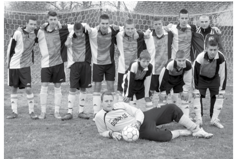
A Dobozi SE ifi csapata