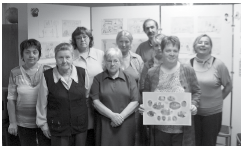
Egykori és jelenlegi kollégák, akik segítették a könyvtár életét