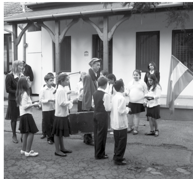
Az emlékműsor egy jelenete