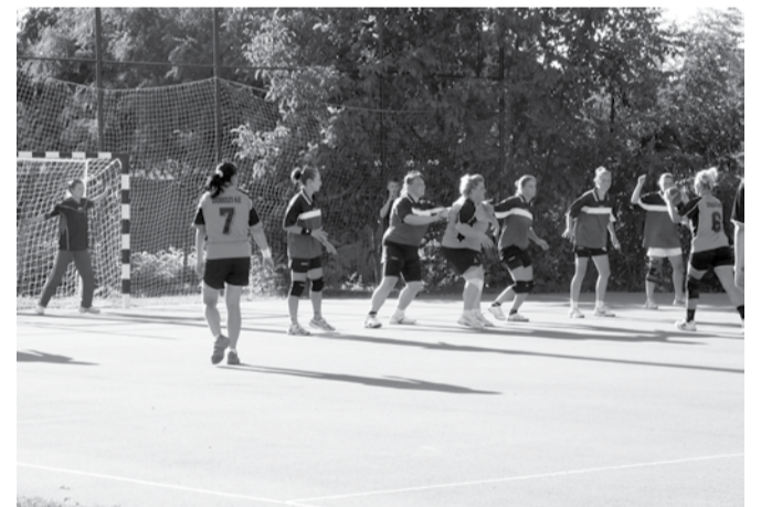
Támadásban a dobozi kézilabdacsapat

Folytatódott a megyei első osztályú női kézilabda bajnokság. A dobozi lányok 3 mérkőzést játszottak, egyet idegenben, kettőt itthon - egy győzelem, két vereség a mérleg.