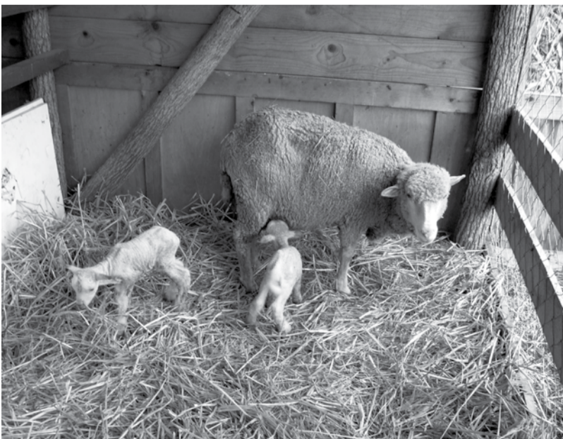
Önkormányzatunk birkanyája ismét gyarapodott. Október 28-án a hajnali órákban két egészséges kis bárány született.