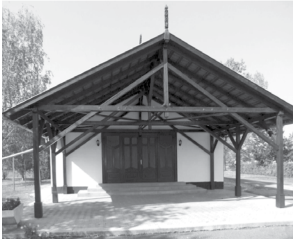
A ravatalozó külső falát és lábazatát, valamint a faszervezetét is újrafestették