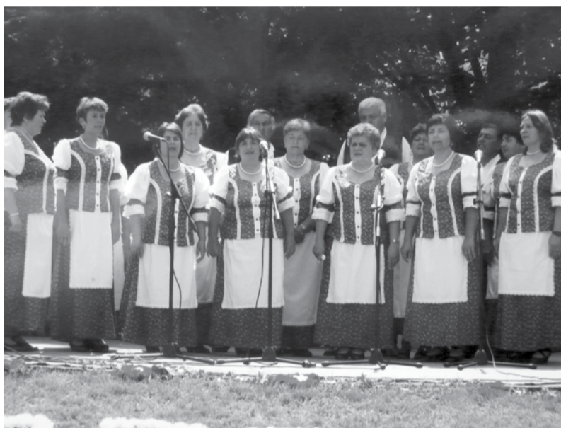
A Doboz Népdalkör tízéves fennállása alatt számtalan rendezvényen mutatta meg a népdalokban lakozó szépséget. Kitartásukat, munkájukat ez idő alatt többek között Nívódíjjal, bronz- majd ezüst minősítéssel jutalmazta a szakma.

„Mindenik embernek a lelkében dal van, És a saját lelkét hallja minden dalban. És akinek szép a lelkében az ének, Az hallja a mások énekét is szépnek” (Babits Mihály)