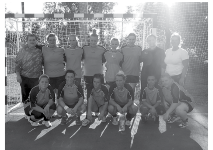
A kézilabdacsapat tagjai