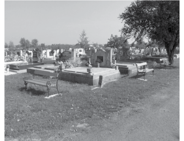
Az önkormányzati temető szabadterei részére padok kerültek

A halottak napján és az azt követő hosszú hétvégén a temetőbe látogatók a korábbinál is rendezettebb környezetben róhatták le kegyeletüket elhunyt hozzátartozóik és ismerőseik sírhantjánál.