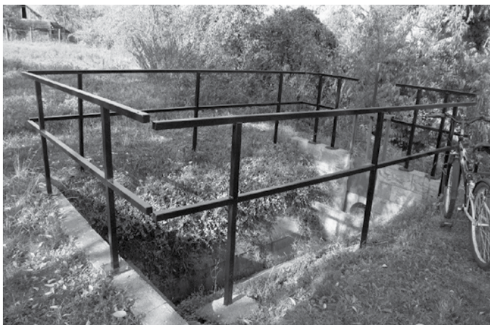
Az árkok és elvezető csatornák tisztítása folyamatban van.