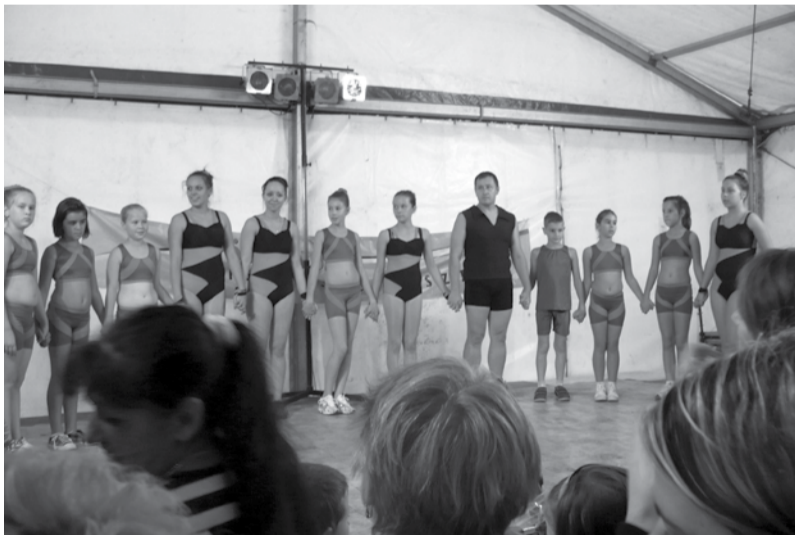
Jó hangulatot teremtve, nagy sikerrel szerepeltek a csoportok

2012. szeptember 15-én, Muronyba jártunk az aerobikosokkal, ahol a Körös-körül Kistérségi Fesztivál fellépői voltunk mi is. Az idő nagyon szép és kellemes volt, a rendezvényt a Ligetben tartották. Igen sok látogatót és nézőt vonzott a falunapi eseménysor, a közönség nagyon lelkes volt, és végig tapsal díjazták a bemutatónkat.