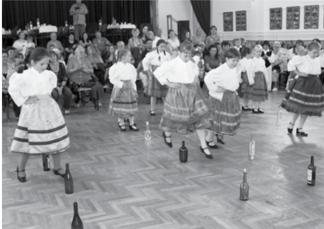
„Leg a láb” Alapfokú Művészetoktatási Intézmény dobozi néptáncsoportja üveges táncot adott elő