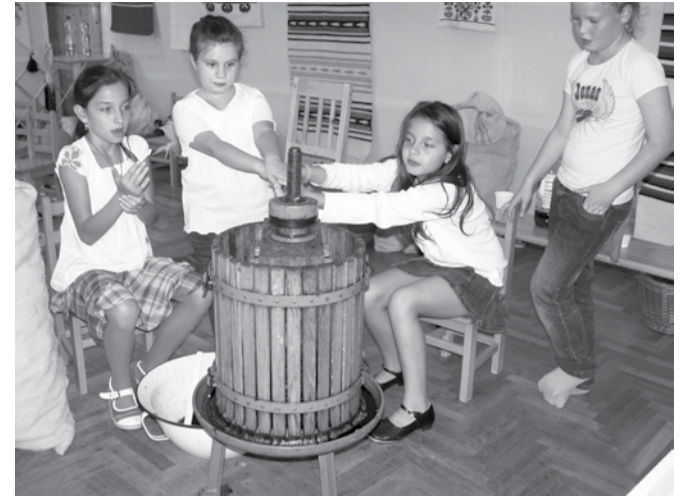
A gyerekek kipróbálhatták a szőlőprést, megízlelték a mustot