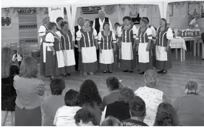
A Dobozi Népdalkör szüreti és bordalokat adott elő