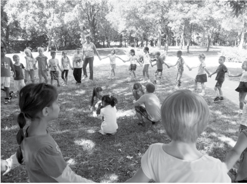
Az első napokban a már jól ismert ligetben játszottak az iskola legifjabbjai