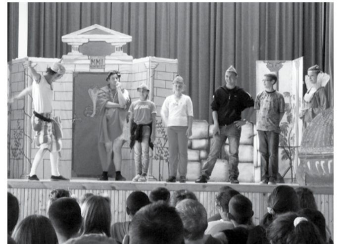
Az előadás interaktív volt, az iskola tanulói szívesen vettek részt a darabban