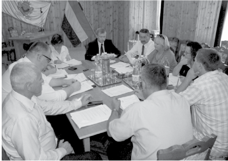
A képviselő-testület szeptemberben két alkalommal ült össze.

Doboz Nagyközség Önkormányzata Képviselő-testülete 2012. szeptember 13-án megtartott soros ülésén hatályon kívül helyezte a civil szervezetek támogatásának rendjéről szóló rendeletét, mivel a közpénzekből nyújtott támogatások átláthatóságáról szóló törvény szabályozta ezt a tárgyat, és az önkormányzati rendelet a törvényhez viszonyítva nem tartalmaz szigorúbb összeférhetetlenségi szabályokat, ezért hatályban tartása nem indokolt. E döntés következtében a Képviselő-testület és Szervei Szervezeti és Működési Szabályzatáról szóló rendeletet is módosítani kellett.