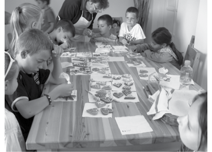
A mézeskalács-díszítés kézügyességet és kreativitást is igényel