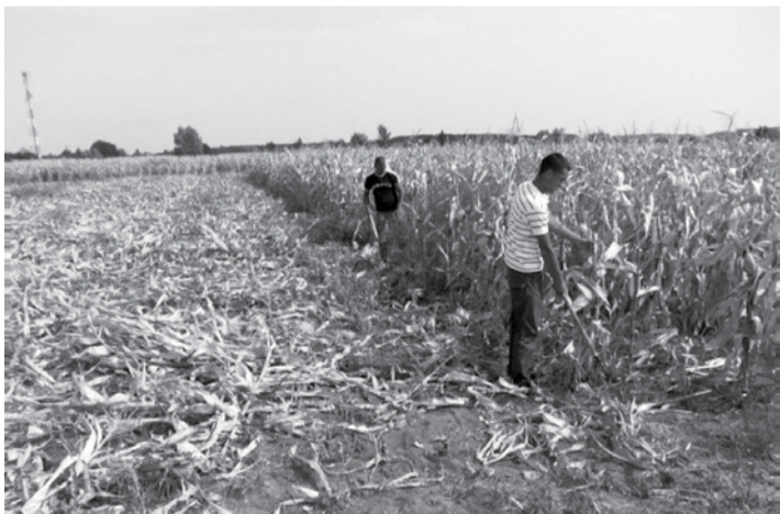
Sok gazda ajánlotta fel kukoricakóróját a nyáj takarmányozására.