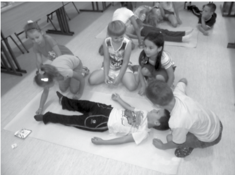
A foglalkozások, tanórák remek hangulatban teltek

2012.szeptember 3-án elkezdődött az új tanév. Ez a tény az első osztályosok és szülei számára hozta a legnagyobb változást. Hogy ezt a nehézséget könnyebben tudják leküzdeni a kis újdonsült nebulók, ezért iskolánkban már évek óta hagyomány az óvoda- iskola átmenetet elősegítő projekt. A projekt tartalma és hossza változó. Idén három napig ismerkedtek a gyerekek és a tanár nénik egymással, az iskola rendjével. Az első órákban együtt volt a két első osztály a foglalkozásokon, a következő két órán a saját tantermbükben a tanár néniükkel. Az utolsó órákban pedig meglepetésként az óvó nénik segítségével együtt játszottunk az óvodai játékaikat a ligetben, mely játékok mindig kapcsolódtak az aznapi témához. Játékos formában elevenítettük fel mindazt, amit az állatokról tanultak eddig az óvodában és a szüleiktől, a Hófehérke és a hét törpe meséje segítségével az érzelmek világát fedezhették fel a gyerekek. A harmadik napon a testrészek és az érzékszervek kerültek terítékre! Ezt szerint is kell érteni, hiszen az általuk hozott gyümölcsökből különböző formák, alakzatok kirakása után nagy lakomát is csaptunk. A