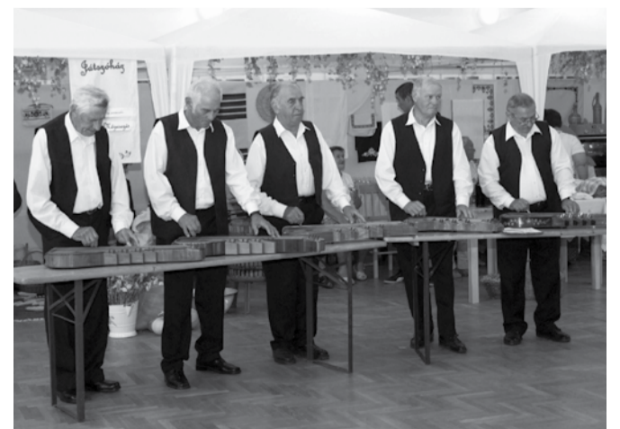
A békési Körös Citerazenekar nagy sikerrel szerepelt a fesztiválon