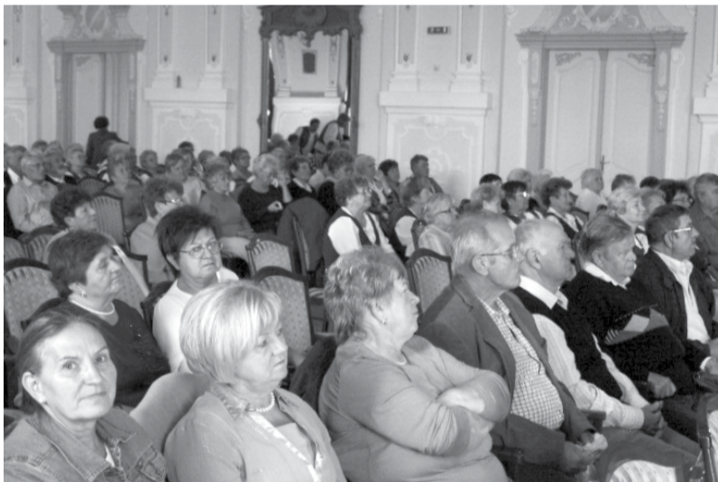
A Dobozi Népdalkör részt vett az I. Tiszántúli Népdalköri Találkozón, ahol a zsűri Nívódíjjal jutalmazta szereplésüket

2012. szeptember 15-én Gyulán tartották a II. Országos „Népek tánca, népek zenéje” fesztivál elődöntőjét. A szervezők célja az volt, hogy összehozzák a hazánkban és határainkon túl élő amatőr nemzeti hagyományörző táncegyütteseket, zenekarokat, népdalköröket, és a hagyományait őrző nemzeti népzene egy fesztivál keretén belül bemutatkozhasanak, megismerkedhessenek más nemzeti kultúrájával.