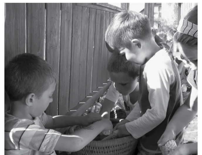
A játszóházban felfedezték a gyerekek: a kukoricacsutka játékra is alkalmas