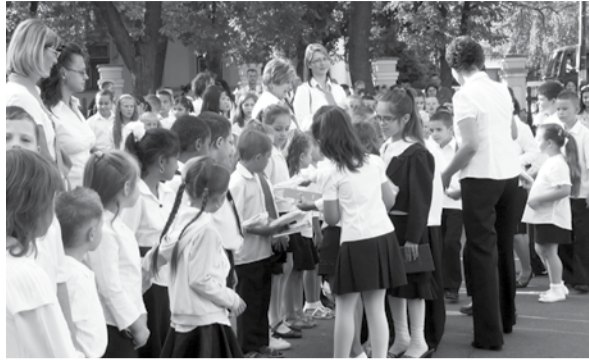
Az ünnepélyes évnyitó középpontjában a legkisebbek, az első osztályosok álltak