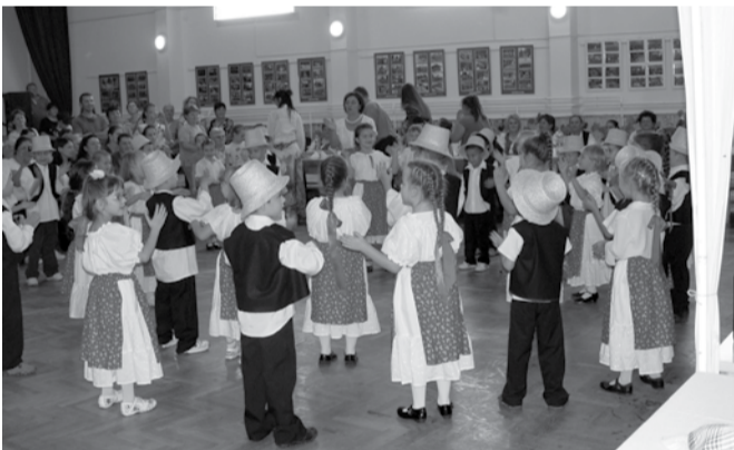
A Mesekert Óvoda Csipkebogyó néptáncsoportjától szüreti bevonulót látott a közönség