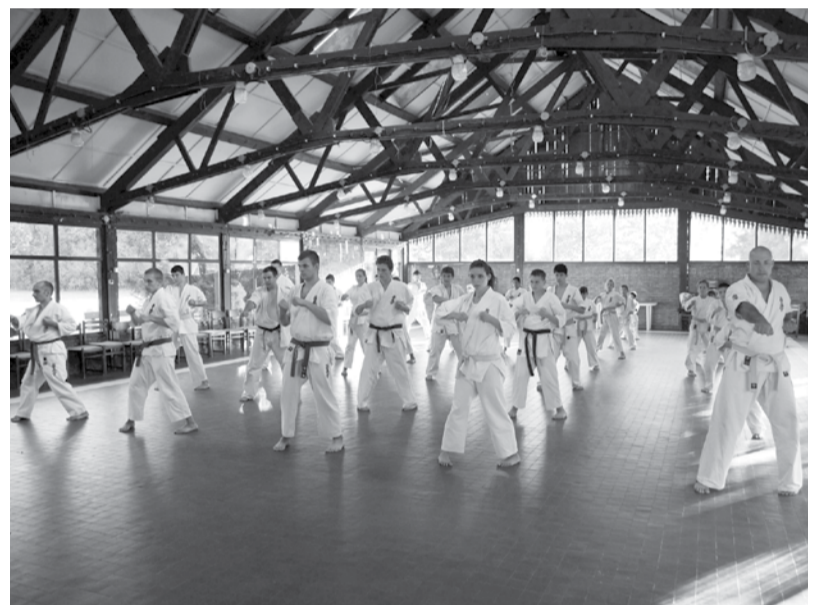
A fáradhatatlan harcosok

2012. szeptember elején – idén negyedik alkalommal – rendezték meg a Samuray Kyokushin Karate SE immár hagyományosnak mondható három napos edzőtáborát. Az időpont ugyan nem az eddigi július közepe lett, ugyanis többen nyaralás miatt nem tudtak részt venni, illetve a Dobo-Szanazugi Ifjúsági Üdülőközpont telítettsége miatt választotta Egyesületünk vezetése az iskolakezdést követő első hétvégét.