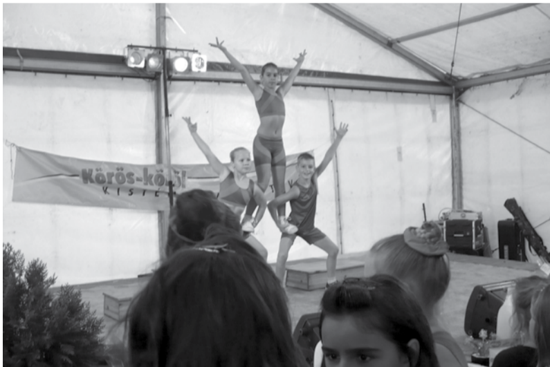
A Körös-körül Kistérségi Fesztivál meghívására érkeztek Muronyba az aerobikosok