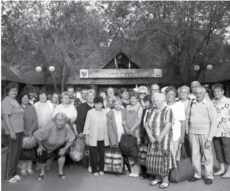
A nyári melegben strandra mentek az egyesület és a klub tagjai

A Mozgáskorlátozottak Békés Megyei Egyesületének Dobozi Szervezete a dobozi Idősek Klubjával közösen két kiránduláson vett részt az elmúlt időszakban.