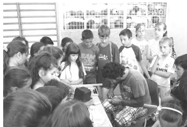
A gyerekek egyetlen mozdulatról sem akartak lemaradni, ezért a lehető legközelebről figyelték a faragás mozdulatait.