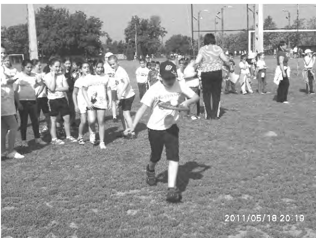
Az alsósok versenyén minden ügyességüket, egyensúlyérzéküket elővették a gyerekek.

Tisztelettel és szeretettel köszöntjük a pedagógusokat!