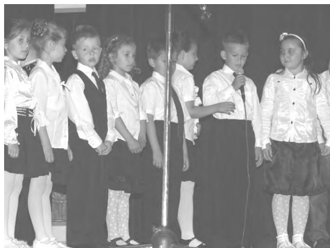
Ünnepelőbe öltöztek a Tigris csoport tagjai, hiszen elbúcsúztak az óvodától.

Emlékszem, pályám elején műsorzárásként volt csupán egy dal, amit az ovi udvarán mert akkoriban meg ott tartot-