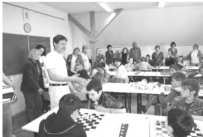
A Hejőkeresztúri IV. Béla Általános Iskolában fontos szerepet kaptak a logikai játékok. Nemcsak órákon, hanem délután szakkör keretében is foglalkoznak a logikai képességet nagy mértékben fejlesztő társasjátékokkal.