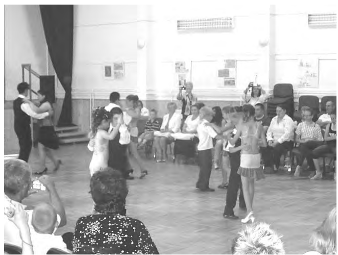
A tanév végi vizsgabemutatót 28 növendék bizonyította tánc tudását.