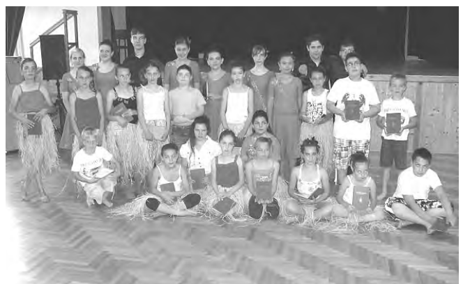
Egy dolog biztosan közös bennük: szeretik és értik a táncot.