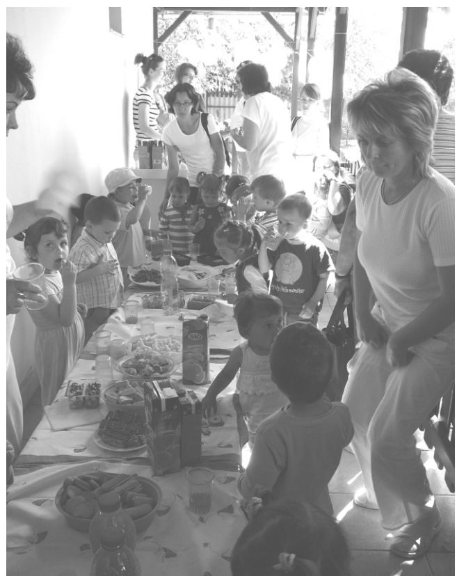
A bölcsődések örömmel kóstolták végig a sok finomságot, melyet szüleik, nagyszüleik készítettek.