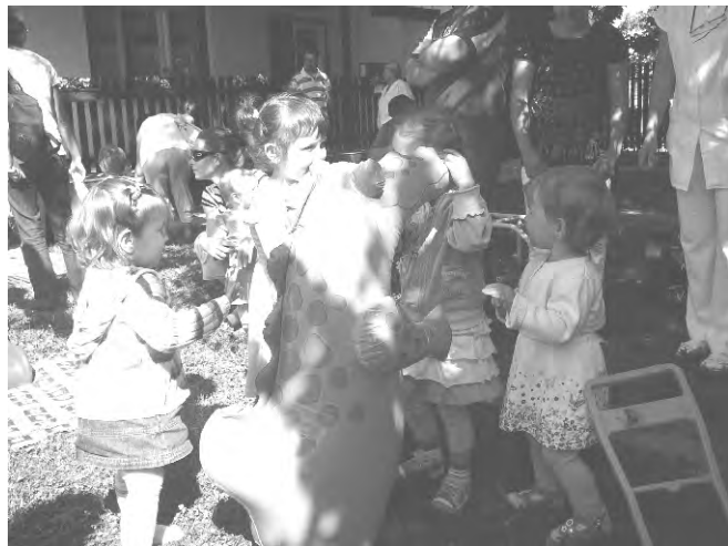
Nagy örömmel és érdeklődéssel fogadták az apróságok az új játékokat.