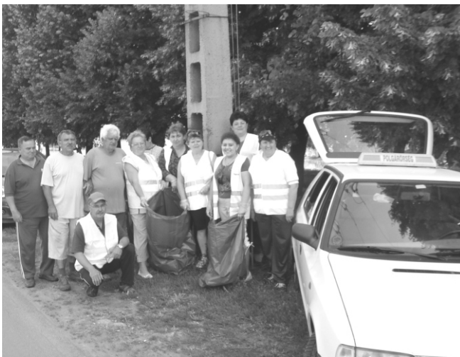
Településünkön mintegy 14 fő vett részt az országos méretű önkéntes szemétszedésben.