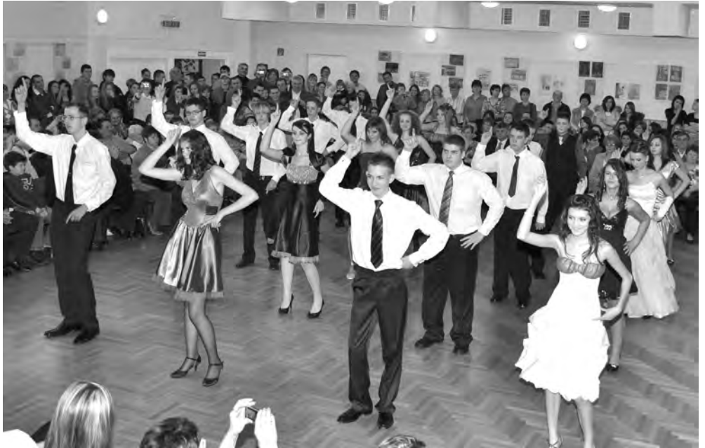
Remekül vizsgáztak a tanulók, bebizonyították, hogy sikerült elsajátítaniuk a legnépszerűbb táncok lépéseit.