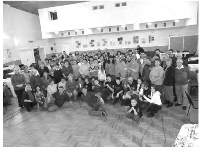
A magyar kultúra napja tiszteletére rendezett programsorozatot a helytörténeti vetélkedő zárta. A mozgalmas vetélkedő után a résztvevőkről, szervezőkről és a közönségről közös fénykép készült.