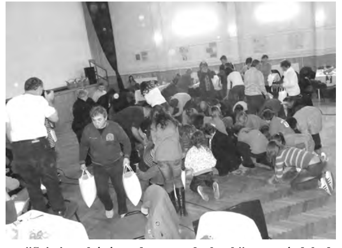
"Sej, tiszta búzát szedegtet a vadgalamb" - ez a népdal adta az ihletet a helytörténeti vetélkedő utolsó feladatához.