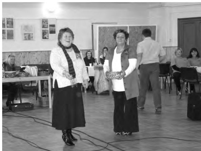
A "Gramopontos dobás" népszerűnek bizonyult, nagy örömet szerzett egy-egy találat. A célba talált mandarinok komoly pontokat jelentettek, hiszen a holtversenyt is ez a játék döntötte el.