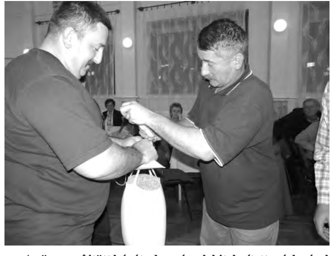
Az összegyűjtött búzát a horgászok hitelesített mérlegével mérték le.