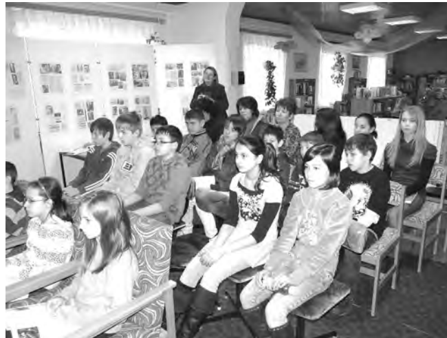
A Dobozi Általános Iskola tanulójának részvételével zajlott a felolvasás a Nagyközségi Könyvtárban.