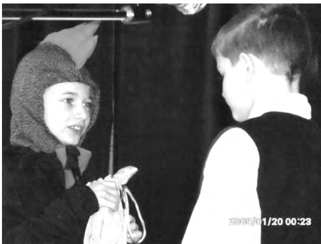
A Gilikotti színjátszócsoport A kiskakas két krajcárkájának meséjét keltette életre.