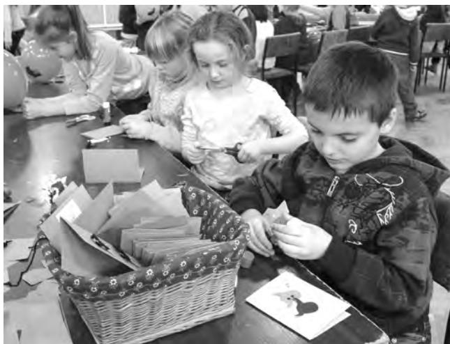
Ismét játszóházban ügyeskedhettek a dobozi gyerekek; ezúttal a farsang jegyében készültek az alkotások.

A farsangi multságok háttárolták meg, hogy mi is készüljön az ügyes kis kezek által. Fújunk léggömböt, és ki-díszítettük a bulira.