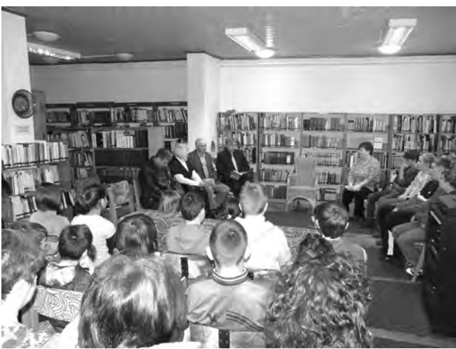
A magyar kultúra napja tiszteletére rendezett program-sorozat nyitányaként a könyvtárban rendeztek felolvasást.

volt. A játszóház nem szokatlan a dobozi gyerekek életében. Rendszeresen alkotnak sok-sok szép és hasznos dolgot az aktuális ünnepekre, és az évszakoknak megfelelően. A játszóházat természetesen most a farsang fémjelzte.