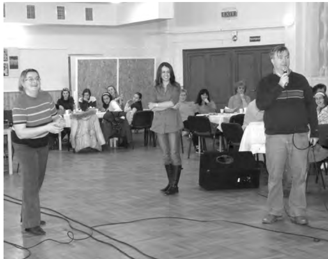
A Bartók Béla emlékére kapcsán "Csodálatos mandarin"-okat kellett gramofonba dobni.