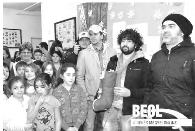
Mikulásjárás idején ajándékot hozott a Magna Cum Laude zenekar.