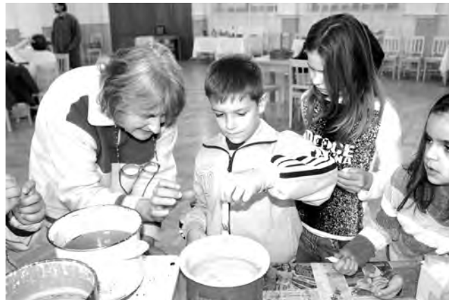
Gyertyát is készítettek azok a diákok, akik a Varázskörök Körenek játszótérjébe ellátogattak.