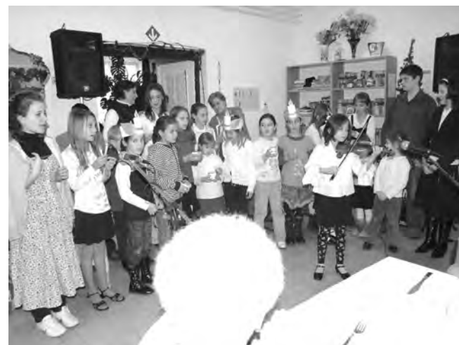
A Nagycsaládosok Egyesülete maradandó meglepetéssel készült az idősek számára.