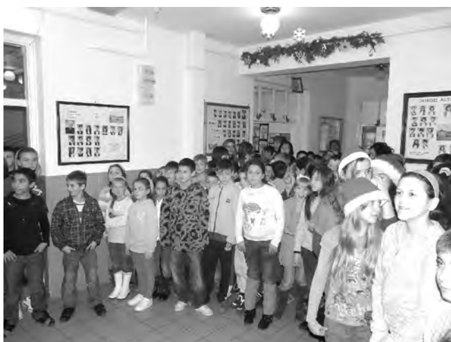
Az iskola tanulói nagy örömmel és szeretettel fogadták a zenekart.