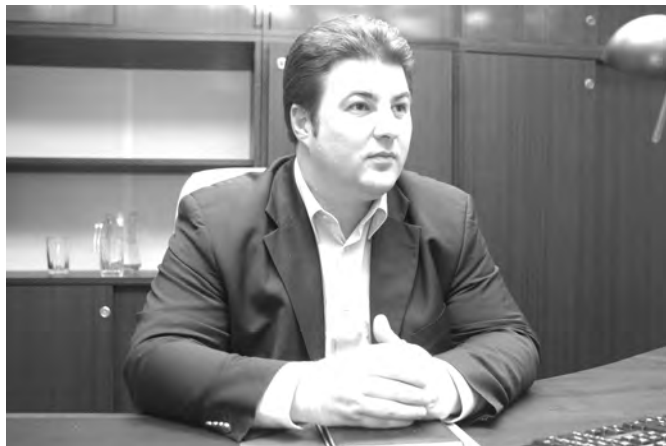
Erdős Norbert emberközpontú közigazgatást szeretne Békés megyében.

Erdős Norbert vezeti januártól az újonnan felálló megyei kormányhivatalt. A fideszes honatyá hangsúlyozta, a polgárok szolgálata a legfontosabb céljuk.