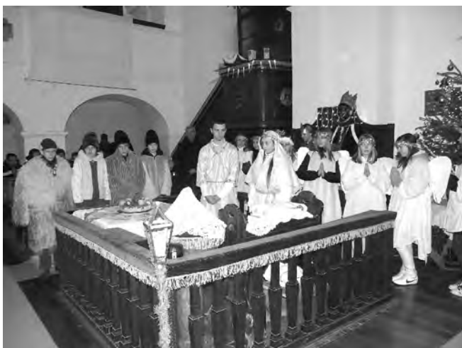
A nyolcadik osztályos tanulók a templom falai között keltették életre Jézus születésének történetét.