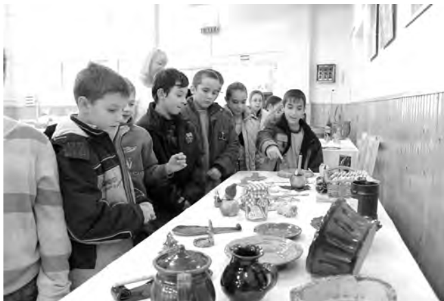
A Népművészeti Egyesület tagjainak munkáiból készült kiállítást a diákok is megtekintették.