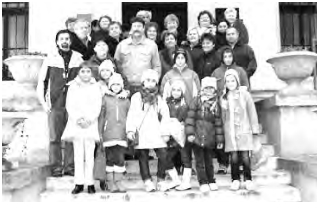
A Munkácsy Mihály Múzeum kiállításait is megtekintették.