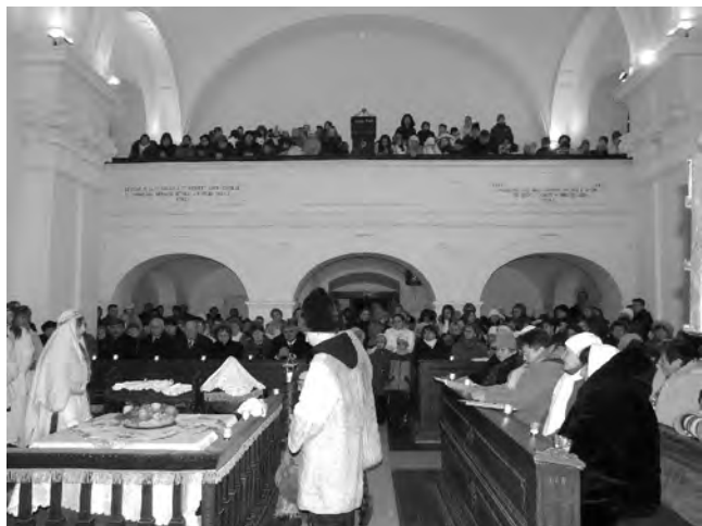
Az érdeklődők megtöltötték a református templom padjait.