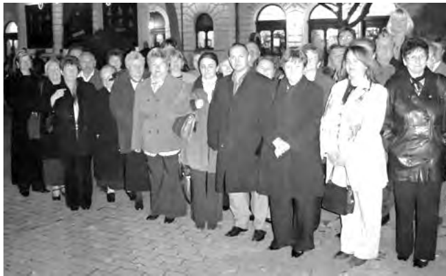
A Dobozi Népművészeti Egyesület tagjai a Jókai Színházba látogattak.