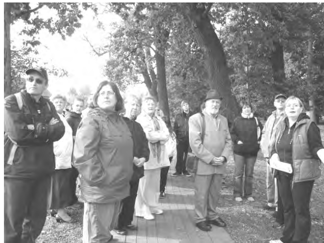
Településünk múltját, épített örökségét ismerték meg az érdeklődők a közel három órás kirándulás során.

volt. Pályázati forrásból biztosították számunkra az utazás lehetőségét, a rendezvényeket. Örültünk a közös munkának és köszönjük szépen a megtisztel-