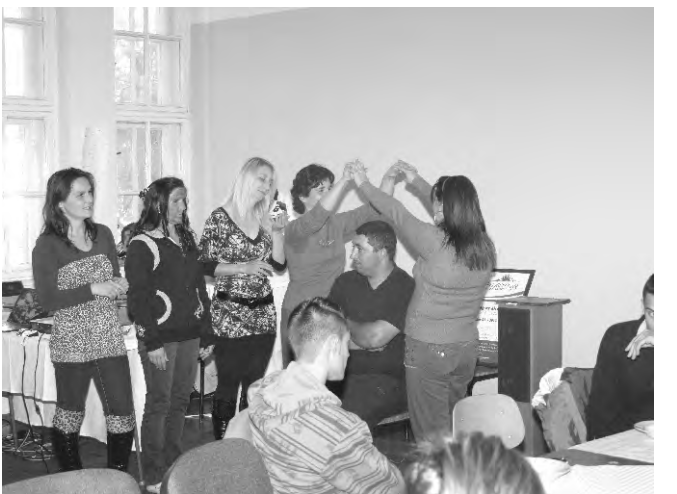
A dobozi csoport az ember teremtését elevenítette meg előadásában.