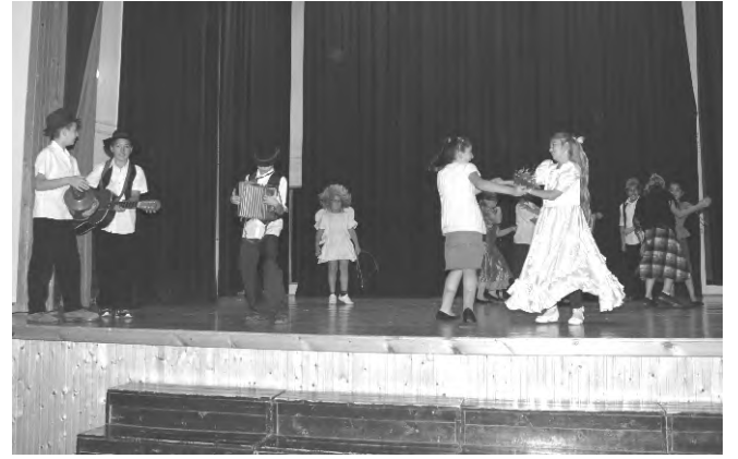
A Mutasd meg magad szakkör tagjai színpadra termettek.