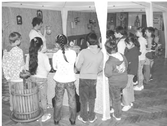
A rendhagyó néprajzóra sok új információt rejtett a gyerekek számára.