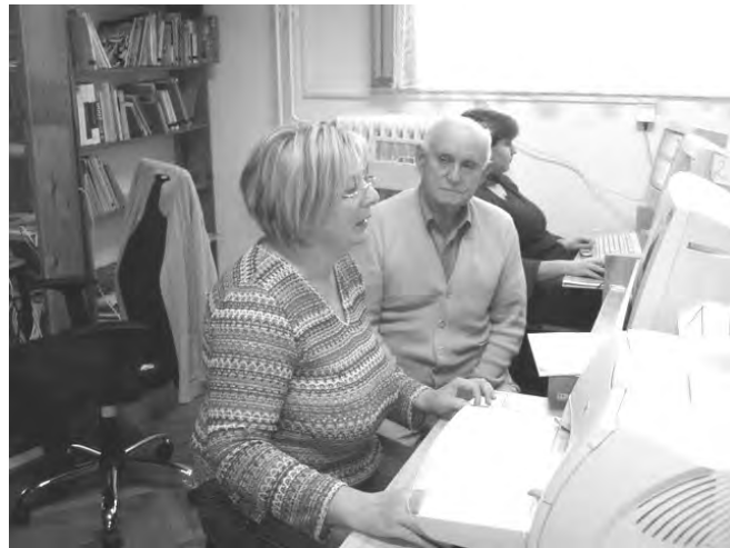
Puskás Gábor bácsi gyűjteményéből is kerültek dokumentumok az elektronikus könyvtárba.