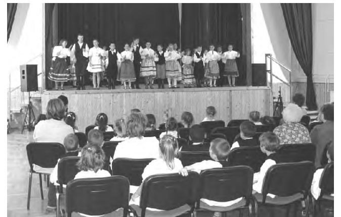
A néptáncbemutató óriási sikert aratott.