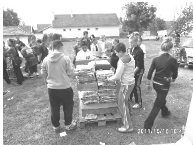
Egyetlen délután 8 tonnánál is több papírt gyűjtöttek a diákok és segítőkész szülei.