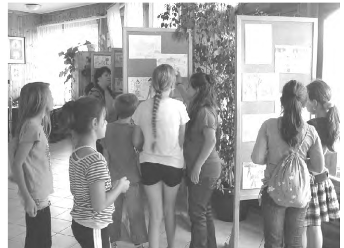
A beérkezett munkákból kiállítás nyílt.