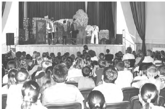
A színház világa elvarázsolja a nézőket.