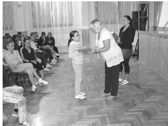
A rajzverseny díjazottjai ajándékot kaptak.