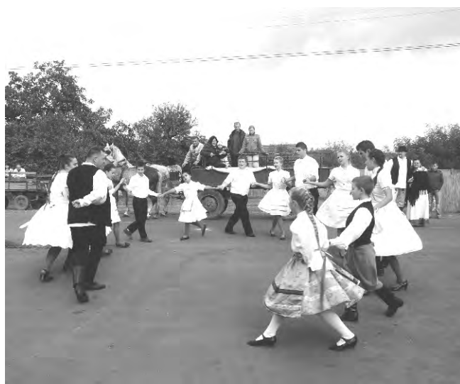
A fesztivál célja, hogy az összefogásban résztvevő települések megismerjék egymást. Dobozon szüreti felvonulás várta az érdeklődőket.