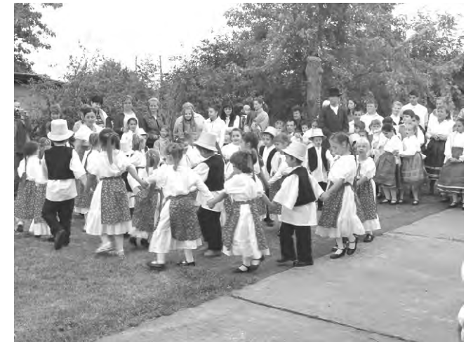
A szüreti felvonuláson az óvodások is megmutatták, már ők is tudnak mulatni.