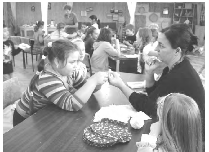
A népi játszóházban gyorsan és hasznosan telt az idő.