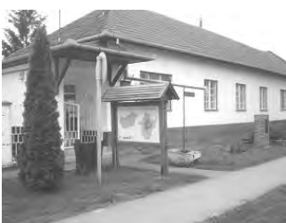
Könyvtárunk pályázatot nyújtott be a Nemzeti Család és

Szociálpolitikai Intézet Gyermek és Ifjúsági közösségek rendezvényeinek támogatására, „Kerek a világ”, -gyermek és fiatalok közösségépítő tevékenységének elősegítése, olvasóvá nevelés, az olvasás örömeinek felfedezése címmel. Sikeres pályázat esetén könyvtárunkban az olvasást népszerűsítő foglalkozások valósul-