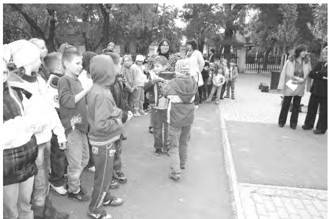
Az eredményhirdetés mindenkit lázba hozott. Vajon ki nyeri a tortát?

A Dobozi Hírmondó elérhetőségei: Tel.: 06/66 268-765/35 E-mail: hirmondo@doboz.hu