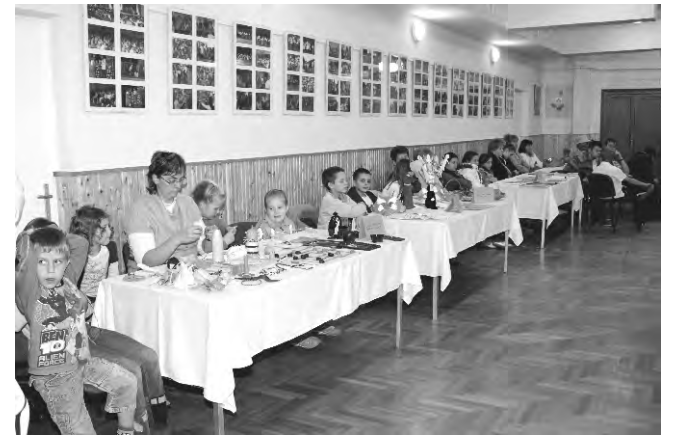
A különböző szakkörök lehetőséget kaptak a bemutatkozásra.

A Kulich Gyula Művelődési Ház konzorciumi partnerei: a Dobozi Általános Iskola, a Mesekert Óvoda Dobozi, Köröstarcsa Község Önkormányzata Napköziotthonos Óvoda és Bölcsőde, Köröstarcsa Község Önkormányzata Általános Iskola és Alapfokú Művészetoktatási Intézmény, Kézműves Szakiskola és Alapfokú Művészeti Iskola Békéscsaba