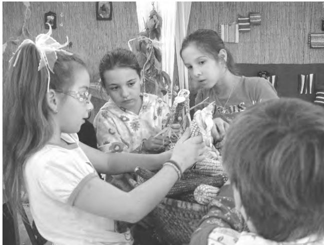
A gyerekek igyekeztek mindennel megismerkedni.