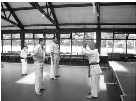
Első alkalommal rendezte meg a Samuray Kyokushin Karate Egyesület edzőtáborát.

Természetesen voltak rendkívüli tréningek is. A péntek délutáni edzést Szanazugban tartot-