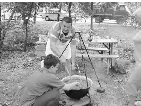
A főzőverseny helyszínére sokakat kicsaltak az ínycsiklandó illatok.