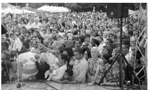
A II. Dobozói Mézes Fesztivál nagy létszámú közönsége.