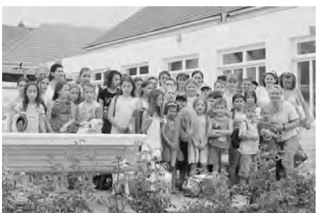
Az idei Kézműves Táborban óvodás- és iskolás- és iskolások egyaránt alkottak.

A táborozók kézműves munkák során megismerkedhettek különböző anyagokkal, eszközökkel, egyszerű technikákkal, ezen keresztül megtapasztalhatták az anyagok tulajdonságait. Mindezek segítettek a gyermekek a szabad önkifejezésben, élmény- és fantáziaviláguk megjelenítésében, esztétikai érzékük fejlesztésében, a szép iránti nyitottságában. A kézműves világ sokszí-