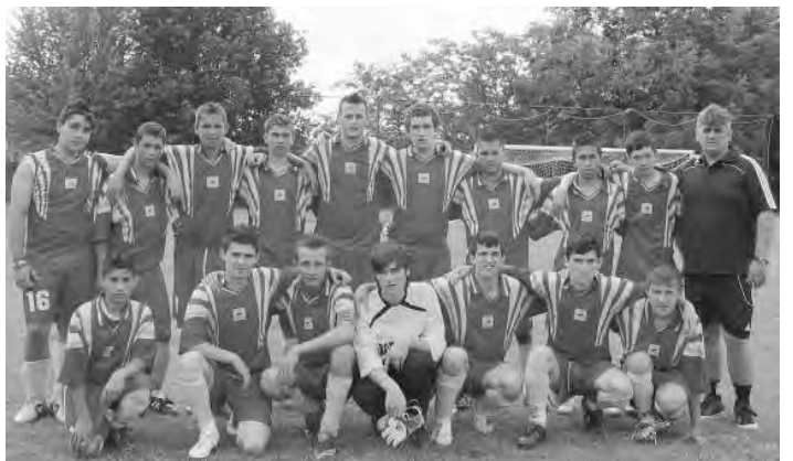
Ifjúsági labdarúgó csapat