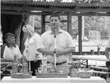
Erdős Norbert Doboz országgyűlési képviselője nyitotta meg a II. Doboz Mézes Fesztivált.

2009. július 11. különleges nap volt a doboziak életében, hiszen ezen a napon rendezték meg községünkben a Mézes Fesztivált, immáron második alkalommal.