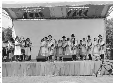
A Csehországból érkező Kunicei és a szlovákiai Klasok Néptáncegyüttes lendületes bemutatót tartott.