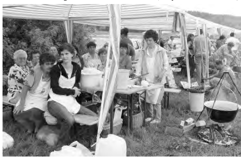
A Szanazugi bulin kiemelkedő program volt a főzőverseny, melyen 34 csapat mérette meg magát.