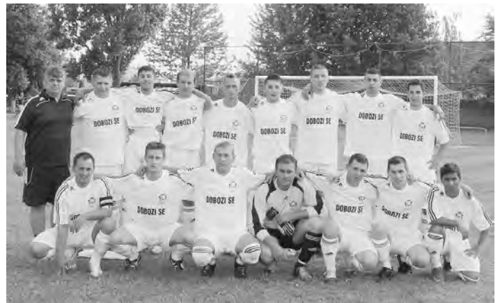
Felnőtt labdarúgó csapat