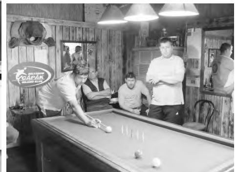
A Magyarbiliárd Országos Csapatbajnokságán részt vevő dobozi versenyzők.

DOBOZI HÍRMONDÓ Megjelenik havonta Kiadó: Dobozi Nagyközség Önkormányzatának Képviselő-testülete Felelős kiadó: Szabó Tibor aljegyző Felelős szerkesztő: Futakiné Debreczeni Ilona Tördelő szerkesztő: Vácziné Urbanecz Annamária A szerkesztőség címe: 5624 Dobozi, Kossuth tér 3. Tel.: (66) 268-765 Nyomatás: Földesi és Társa Bt. Példányszám: 1800 A szerkesztőség nem feltétlenül azonosul a szerzők cikkeinek tartalmával és azokért nem vállal felelősséget.