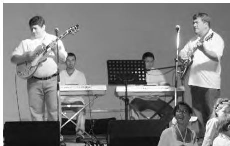
A Fekete Gyémántok zenekar utcaból hangulatot varázsolt a sportpályára.