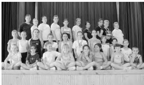
Az aerobik tábor résztvevői.