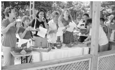
A zsűri lelkesen kóstolgatott Doboz legfinomabb mézes süteményeiből.