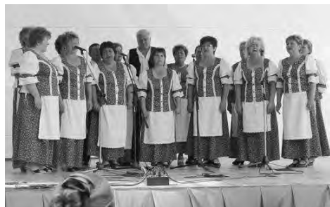
A Dobozói Népdalkör hangulatos népdalcsokrot nyújtott át a közönségnek.