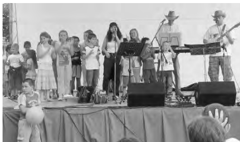
A Pamac Minitársulat koncertje nemcsak a legkisebbeknek szól.