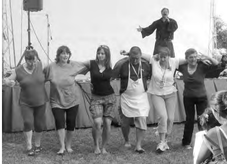
Laci betyár táncra perdítette a közönséget, műsorában ismert és eddig ismeretlen dalok is elhangoztak.