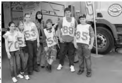
A Dobozi Általános Iskola "két keréken" mesterei.