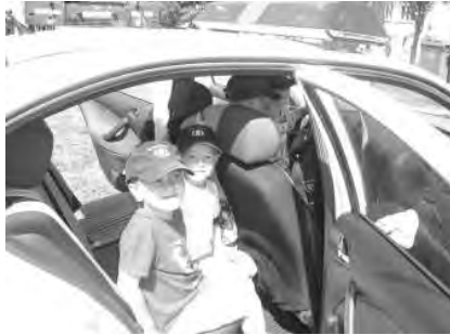
Az óvodások még a rendőrautót is birtokba vehették.