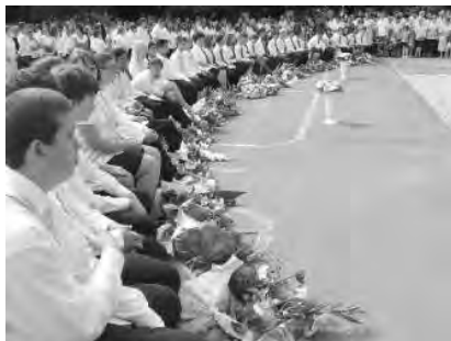
34 ballagó diák búcsúzott a Dobozi Általános Iskolától.

Amikor én ballagtam, nem is fogtam fel, hogy ez valami „nagy dolog”, hogy változni fog az életem. Szükségszerűnek láttam, hiszen már első korában tudja az ember, hogy majd egyszer nagy lesz, hetedik osztályosként a ballagás szervezése közben tudja, hogy jövőre ő fog ott állni virágregeteg karján cipelve. A következő napokban az elballagott nem ébred más emberként, nem érzi többnek magát. Aztán szeptemberben az élet vonata befut egy újabb állomásra, ahonnan elindulva négy év múlva éri el úti célját. Ismét ballagás. Minden évben ott voltál a felsőbb évfolyamok ballagásán, észre sem veszed, hogy most Te ballagsz. Az érettségi sem olyan „nagy szám”, hiszen minden év végén próbaérettségén treniroztak a végso megmérettetésre. Ha kitartó a kisvovatod, ismét felkerelkedik egy négy vagy öt éves útra és visz és rohog, telnek a munkával terhes percek, órák, évek, s hoppá, mily meglepő, ballagsz és diplomát kapsz.