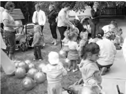
A gyermeknapon a bölcsődések a szüleikkel együtt ünnepelek.