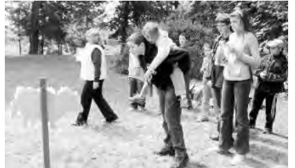
Kicsik és nagyok egy csapatot alkotva, játékkal töltötték ezt a napot.