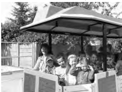
A „Dotto”- kivonat járata Szanazugba vitte a gyerekeket jégkrémrezní.