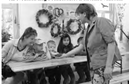
A látogatóközpontban sok érdeklődést láthattak.