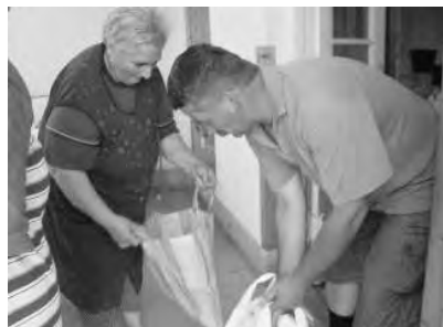
A Magyar Ökumenikus Segélyszervezet élelmiszer adományozott településünk rászoruló állampolgárai részére. 500 család részére osztottak ki segélycsomagot.