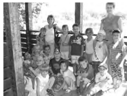
A Szegedi Vadasparkban tett kirándulás óriási élmény volt az ovások számára.

Kedden a gyerekek birtokba vehették a rendőrautót, s a rendőr bácsi „lefégyverezése” után minden eszközt alaposan megnézegettek. Hangos szírnázás közepette kifürkészték az autó belsejét. A túzóltatót is sok érdekességet rejtgetett. Nagy élményt jelentett a védőruhák felpróbálása, a hatalmas vízsgár játéka, ami sajnos egy gyors riasztás és készülődés után hamarosan már egy igazi túzólt vált szükségessé. A valódi izgalom igen fégyelmezette tette a gyerekeket, segítve