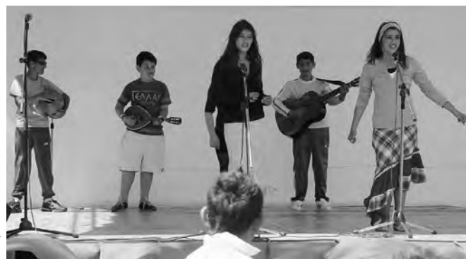
A Tátika showban a gyerekeké volt a színpad.