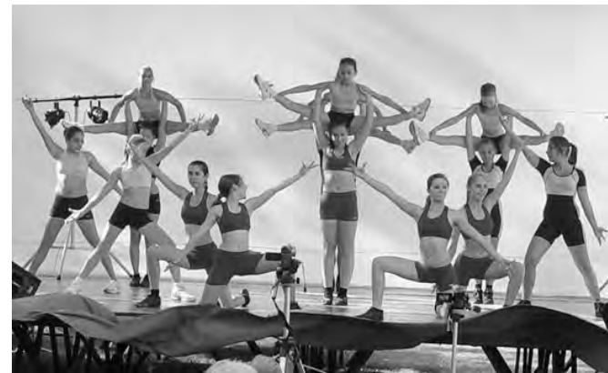
Az aerobikosok lendületes bemutatója.