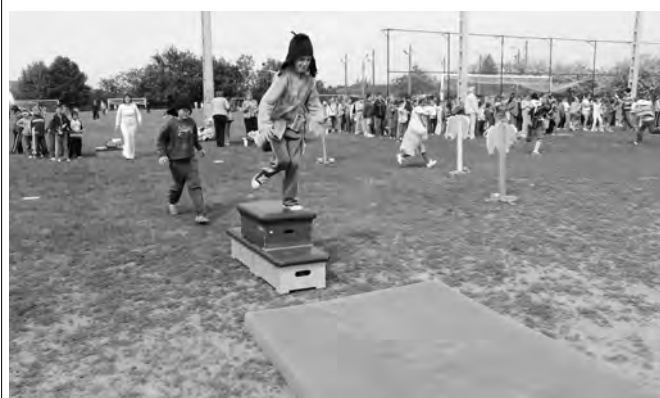
Nagy sikert aratott a mesés sportnap a gyerekek körében.