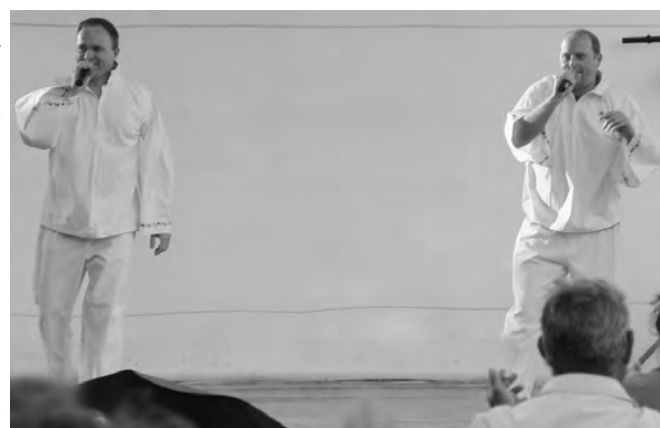
A Sógorok együttes mulató dalaival jó hangulatot teremtett.