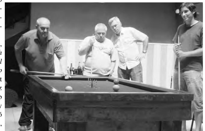
A Dobozi Simák Biliárd Klub tagjai játék közben.