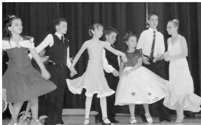
A társastánc bemutató üde színfoltja volt a fesztiválnak.