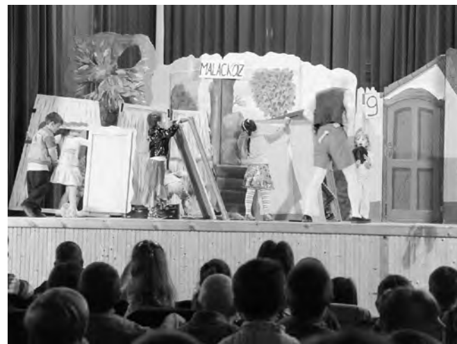
A három kismalac története a Szegei Miniszínház társulatának jóvoltából elevenedett meg.