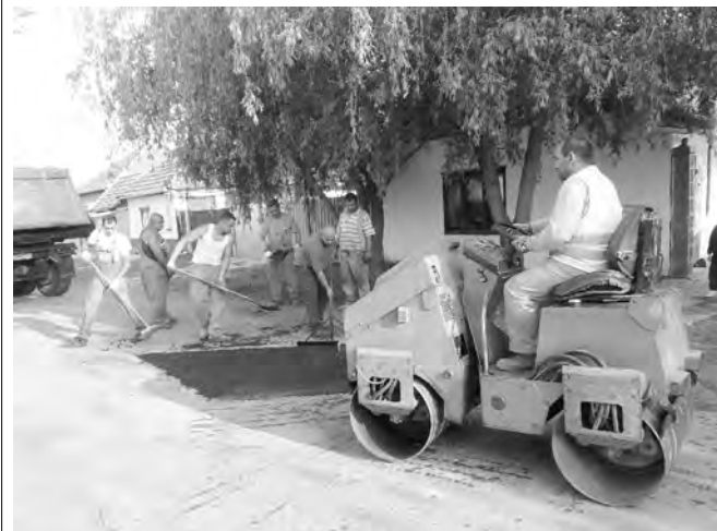
Most hatékonyabb, jobb módszerrel javítják az utakat.