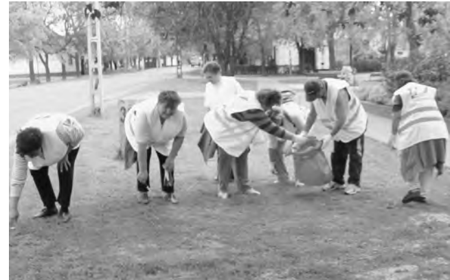
Az országos szemétyűjtő akcióba településünk is részt vett.

Dobozon 4 szervezet közreműködött abban, hogy a településünk belterületén áthaladó főútvonal melletti környezet megtisztuljon. A vadászok a Vadászház környékét és a Maróci erdőt szeltek rakták rendbe. A Népdkör a Vésztoi úton a helységjelző táblától a Kossuth téren keresztül a Zsibongó utcai kereszteződésig gyűjtötte