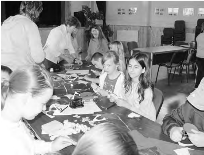
A játszótérben anyák napja alkalmából az anyukáknak, nagymamáknak készült a sok ajándék.