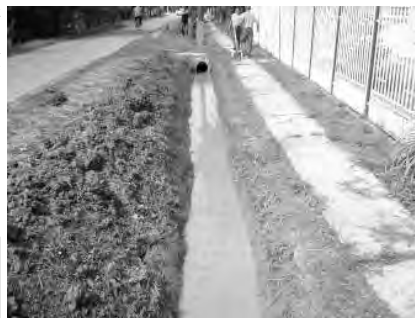
Az árokásás bejezésekor.

Az "Út a munkához" program keretében tavasszal Dobozon a Béke utcában végezték el ezeket a munkálatokat.