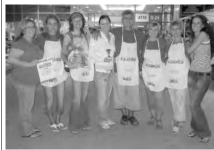
A Doboz Általános Iskola is meghívást kapott az idei Lecsófesztiválra.