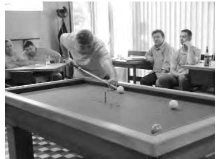
A szeptemberben kezdődött bajnokságon jól vette aka- dályokat a Doboz Simák Biliárd Klub.

DOBOZI HÍRMONDÓ Megjelenik havonta Kiadó: Doboz Nagyközség Önkormányzatának Képviselő-testülete Felelős kiadó: Szabó Tibor aljegyző Felelős szerkesztő: Futakiné Debreczeni Ilona Tördelő szerkesztő: Vácziné Urbanec Annamária A szerkesztőség címe : 5624 Doboz, Kossuth tér 3. Tel.: (66) 268-765 Nyomtatás: Földesi és Társa Bt. Példányszám: 1800 A szerkesztőség nem feltétlenül azonosul a szerzők cikkeinek tartalmával és azokért nem vállal felelősséget.