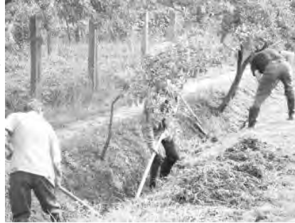
A munkálatok megkezdésekor.

A dobozi polgármesteri hivatal közeli munkái a csapadék elvezető árkot tisztították ki.