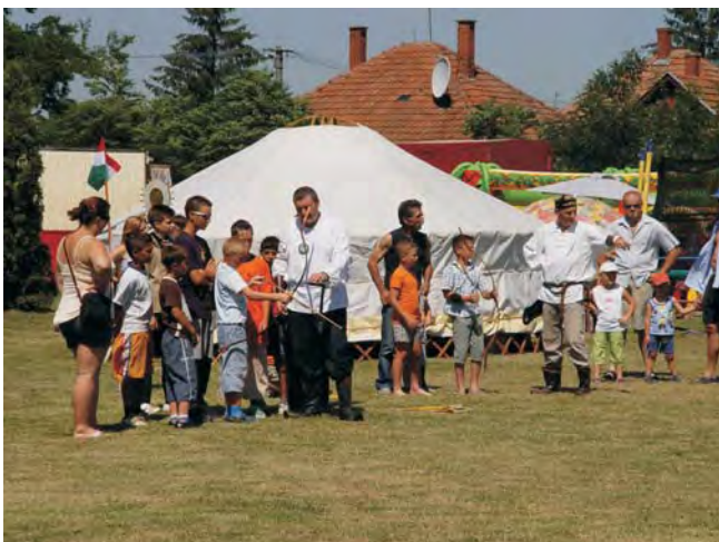
Az újszatba is belekóstolhattak az érdeklődők.