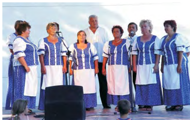
A Dobozi Népdalkör ismét nagy sikert aratott.