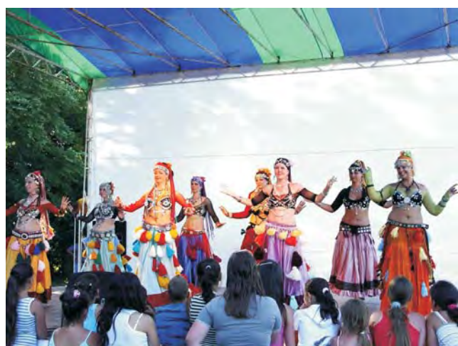
A hastáncos lányok elbűvölték a közönséget.

2008. július 12-én különleges napra ébredtek a doboziak. Először hívogatt minket Mézes Fesztiválunk. Megyénkben több városhoz, községhez kötődnek jellegzetes rendezvények, amelyeket elsősorban az ott élők foglalkozása és múltja ihletett. Dobozon már több mint egy évtizede rendeznek kulturális és sportnapokat. A szervezők szerették volna, ha településünkön is újtára indul egy fesztiválhagyomány, amely a község sajátjává válhat. A mézre, a méhészetre esett végül a választás. Hiszen a halászat, vadászat és sertésnyészés mellett ez is ősi dobozi foglalkozás. „A méhészet adta a hagyományos édesítőszert a paraszti háztartásokban. Kezdetben a méhrajokat az erdőből zsákmányolták, kasokat borítottak rájuk, és hazavitték a családot. A korábbi századokra jellemző hagyományos formát, a káros méhészetet Dobozon 1899-ben váltotta fel a kaptáros változat.” (Száz magyar falu könyvsorozat - Doboz)