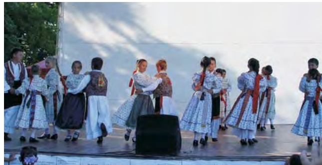
A Minerva ANI táncosai felejthetetlen bemutatójukkal nemcsak szórakoztattak, hanem értéket is közvetítettek.