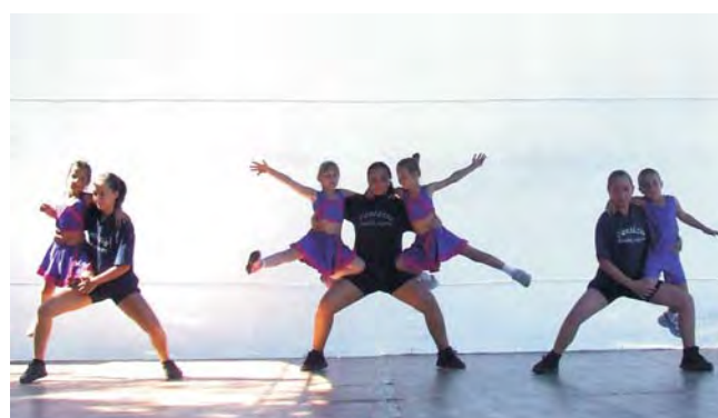
Ismét egy jól kidolgozott, látványos produkcióval készültek az aerobikosok.