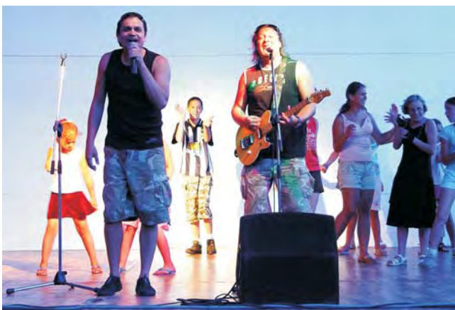
A Bon-Bon zenekar belopta magát a nézők szívébe.