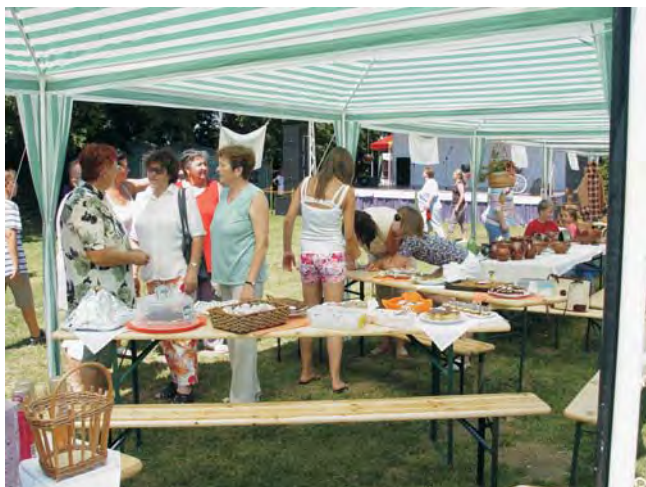
Nagy volt a forgatag a „Mézes utcában”, mindenki szívesen kóstolgatott.