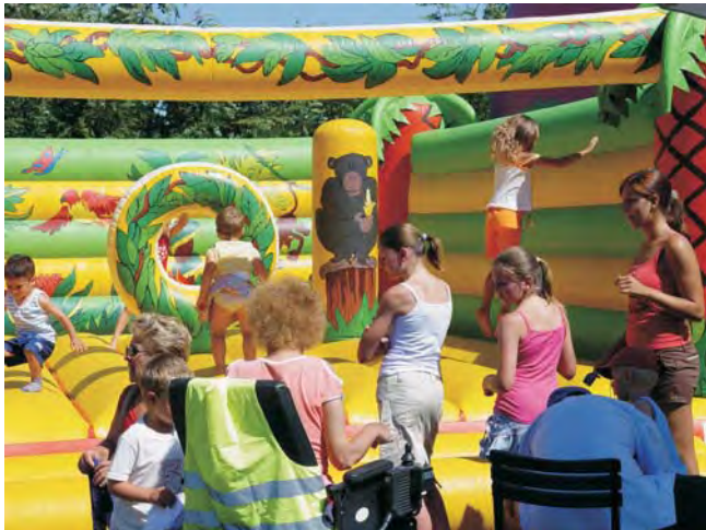
Ingyenes volt az ugrálóvár a gyerekek nagy-nagy örömeire.