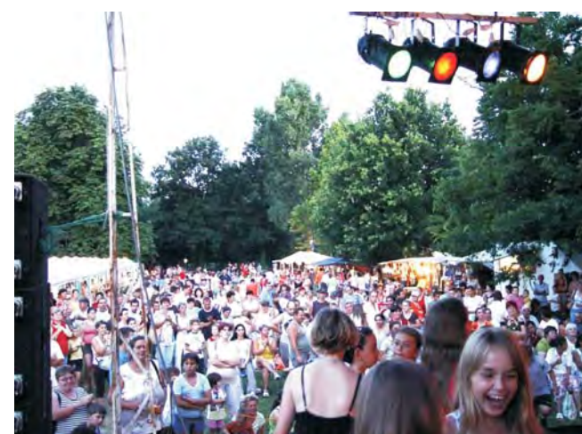
Rengetegen voltak kíváncsiak a színpadi produkciókra.