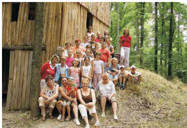
A kézműves foglalkozások mellett kirándulások sora gazdagította a tábor programjait. Az utolsó napot Sámson várájánál töltötték a résztvevők.

Az „Apáról fiúra” pályázat segítségével 19-en tarthattunk a kezünkben régi kismesterségekről szóló bizonyítványt. Még most is a fülemben csengenek a Népművészeti Egyesület elnökétől elhangzott szavak: „... külön szólok a dobozi különítményhez (19 fő dobozi szakképzett kézműves), amit ti képviseltek, az egy csoda ebben a rohanó, modernizált világban, hogy egy településről ennyien, olyan értéket képviseltek és olyan szemlélettel rendelkeztek, amely a hagyományörzést szolgálja. Tudom, hogy képesek vagytok arra, hogy ezt közvetítsétek mások számára! ...” Számomra ezen az úton megtett első lépés ez a kézműves tábor, amely már minden évben megrendezésre került idén június 30-tól július 04-ig tartott. A „táborlakók” óvodás-korú és iskolás-korú gyerekek, sőt még más településről is részt vettek. Kijelenthetem, hogy ez az egy hét, mind gyerekeknek, mind felnőtteknek élményt adott, mindenki kipróbálhatta önmagát, új barátságokra tehetett szert, és minden-