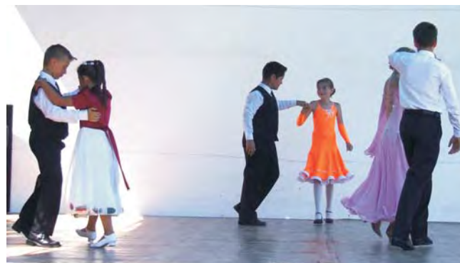
A társastánc bemutató magával ragadta a közönséget.