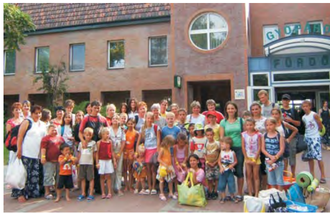
Harminc gyermek kirándulhatott Gyopárosfürdőre a családsegítők jóvoltából.