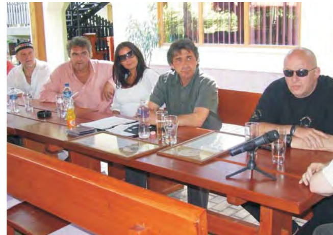
Neves szakmai zsűri értékeli a tehetségek bemutatkozását.

A két gondolatot összegezve arra a kérdésre kerestük a választ, hogyan lehetne ismeretlenebbé tenni az Alföld e távoli zugát a zene segítségével, miközben neves szakmai zsűri által felügyelt zenei versenyen tehetséges fiatalokat fedezünk fel, akik később a hazai zenei élet fajsúlyos egyéniségeivé válhatnak, és pályafutásuk kezdetét e helyhez kötik. Nem titkolt szándékunk, hogy a zenei adottságokon túl elsősorban olyan fiatalokat várunk, akik tisztelik, szeretik és képe-