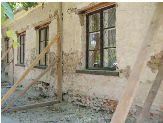
Ez a legfontosabb?