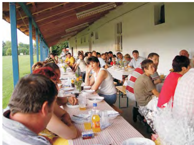
A szezonzáró vacsorát méltó helyszínen, a Sportpályán tartották. Az est során felelevenítették a mérkőzések legszebb pillanatait.

Remélhetőleg sok, focit szerető dobozi szurkolónak szerzünk a jövőben is szép hétvégét.