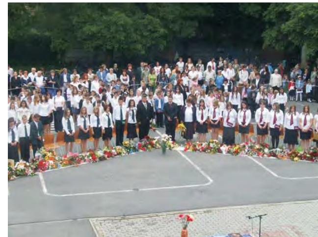
46 ballagó diák búcsúzott a Dobozi Általános Iskolától. Valamiannyien középfokú intézményben folytatják tanulmányaikat.