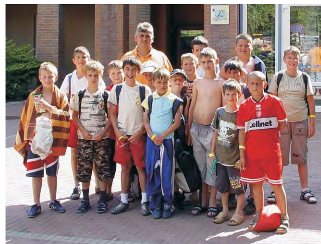
A Gyopároson eltöltött nap felüdülést jelentett a focisták számára.