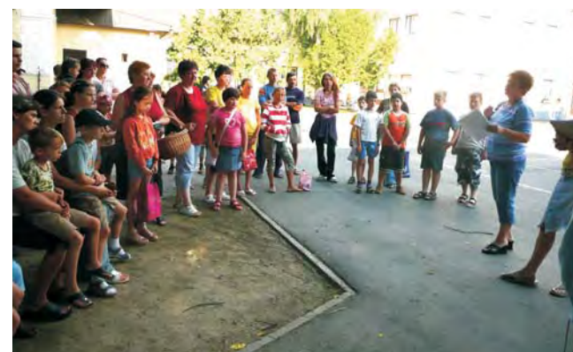
A 40 tanuló és szüleik nagy izgalommal várták a kétéhetes tábort.