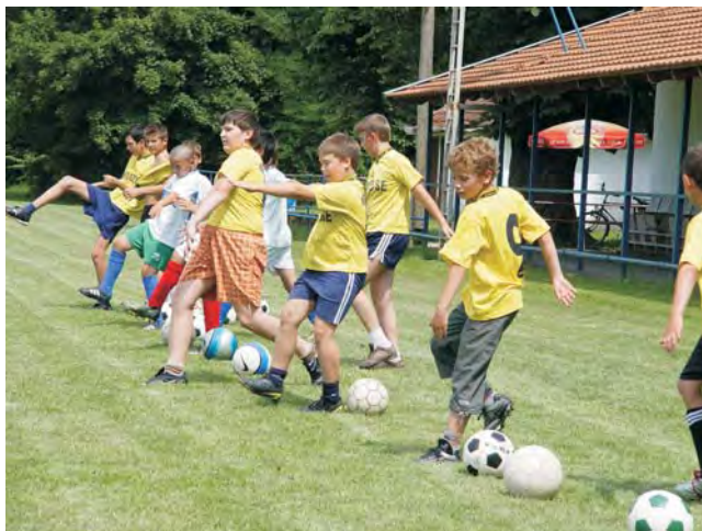
A nyári szünet első hetében 18 tanuló hódolt legnagyobb szenvedélyének: a focinak.