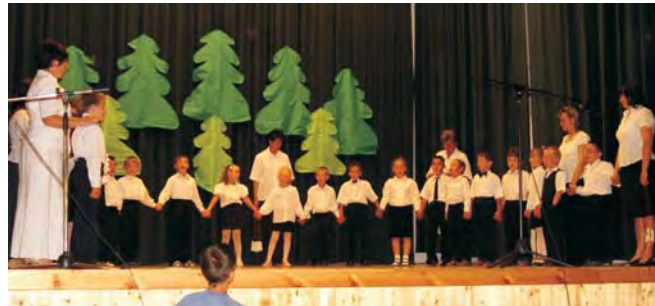
A ballagási ünnepségen a jóságról és a szeretetről szólt a gyerekek meséje.