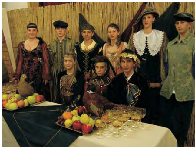
Mátyás és udvarnépe reneszánsz vacsorára invitálta a vendégeket.