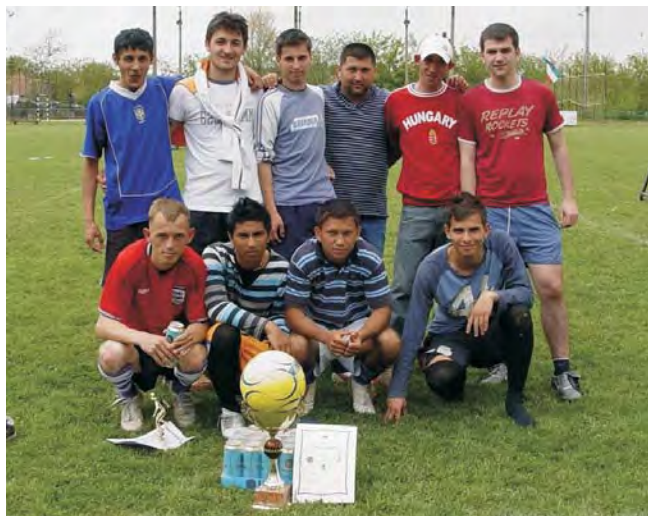
A győztes Bieder csapat.