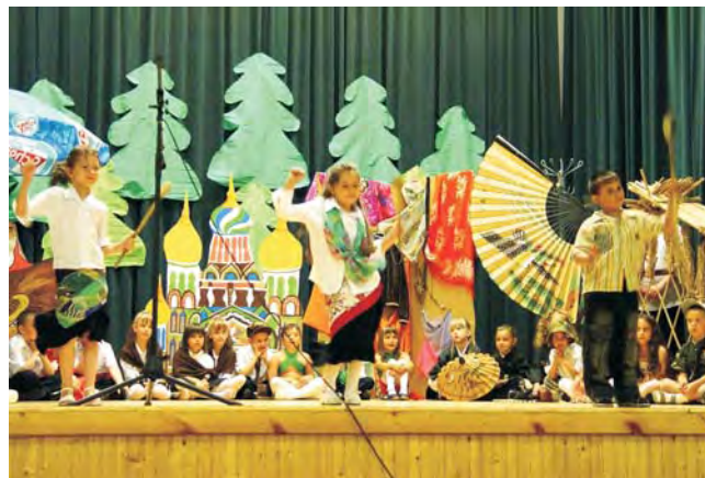
A nagycsoportosok örömmel és büszkén mutatták be, mit tudnak más népekről.

A középső csoportosok, a gyerekek egyik kedvencét, a