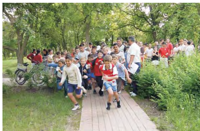
Fiatalok és idősebbek is rajthoz álltak.