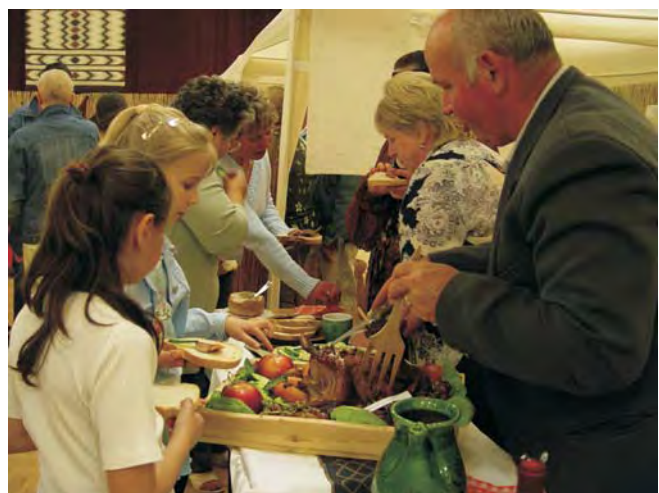
Káprázatos menüsört kóstolhattak végig az est vendégei.

Az I. Tavaszi Fesztivál alkalmával olyan programoknak lehettünk részesei, amiért köszönet illeti a szervezőket! Ezeket a színvonalas eseményeket rengeteg élménnyel gazdagodhattunk. Köszönet érte! További sok sikert kívánok!