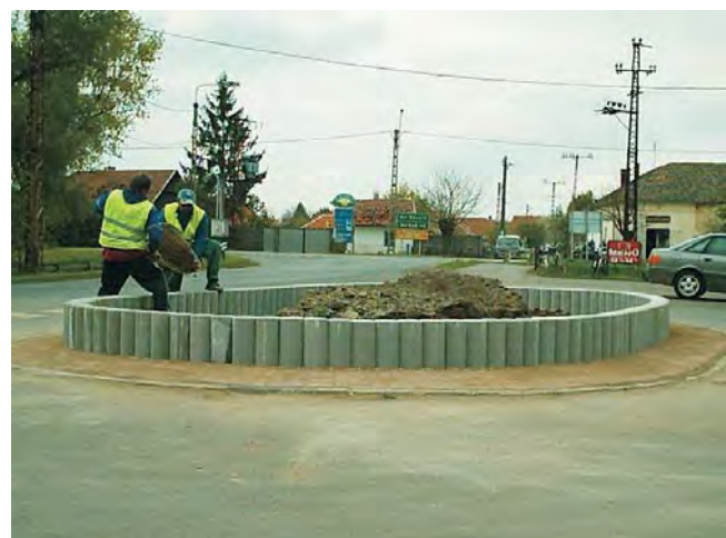
Faluszépítő program keretében újítják fel a buszfordulónál lévő virágágyást.