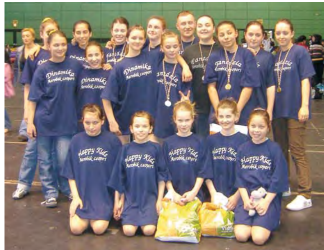
Aerobikosaink a Nyíregyházán rendezett Országos Amatőr Dance és Step bajnokságról éremmel tértek haza.