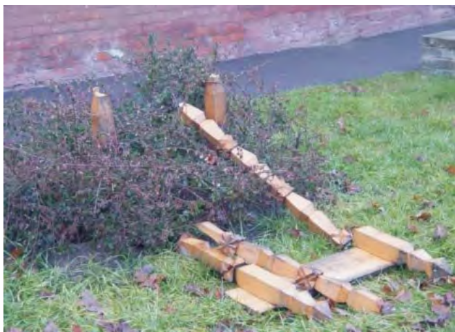
Az utóbbi időben megszorodtak községünkben a rongálások.

Doboz Nagyközség Önkormányzata a lehetőségeihez mérten mindent megtesz (saját erőből és pályázati forrásokból) annak érdekében, hogy a település, a környezetünk minél szebb, tisztább, élhetőbb legyen. Ez mindannyiunk közös érdeke. Úgy tűnik azonban, hogy ezt nem mindenki látja így. Sajnos az utóbbi időben nagyon sok rongálás, lopás történt a településen, amit valószínűleg nem idegenek csináltak, hanem éppen azok, akiknek az érdekében ezek a dolgok megvalósultak. A ligetben nagyon sok növényt elloptak, a padokat összefirkálták, megfaragták. Kiszedték a lebetonozott személtároló edényeket a földből és a vízbe dobták. Legutóbb már a burkolatot is megrongálták. Nem kímélik a játszóteret sem, amit a gyerekek nagyon szívesen használnak, mivel a településen ez az egyetlen nyilvános játszótér. A település más részein is hasonló a helyzet. Több személtároló edényt összetörtek, az iskola előtti padokat rendszer-