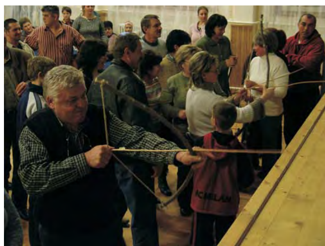
A versenyzők saját készítésű íjakkal és nyilakkal mutathatták be, hogyan tudnak vadra löni.

- Öt éve mi volt a mozgórugó? Mi adta az ötletet az első vetélkedőhöz?