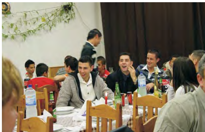
A rendezvényen jó kedvvel, sportélmények felidézésével zárták játékosaink az évet.

A Dobozi SE 2007. december 15-én tartotta vacsorával egybekötött közgyűlését.