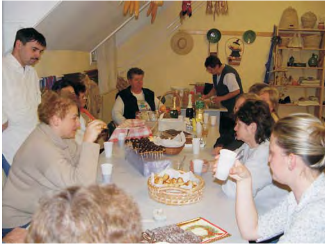
Jó hangulatban telt a Művelődési Ház évzáró foglalkozása.

Ez volt a mottója a Művelődési Ház pénteki évzárójának, amelyet a mézeskalács és tepertős pogácsa illata járt át, ahol nem hagyott alább a kreativitás, az alkotni vágyás az utolsó foglalkozáson sem. A sütés-főzés közepette, meghitt hangulatban karácsonyi ajándéktárgyakat készítettünk, dia-