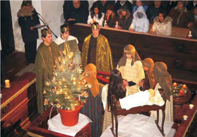
A templom falai között kelt életre a betlehemi történet.

Karácsony közeledtével, advent időszakában szomorúan tapasztaltam, (meglepődve naivságomon), hogy a készülő karácsonyváró ünnepséggel kapcsolatban negatív vélemények is megfogalmazódtak. Ennek bizonyára több oka lehet. Egyik talán, hogy az új