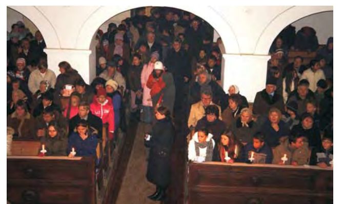
A templom padsorai színültig megteltek a karácsonyváró ünnepségen.