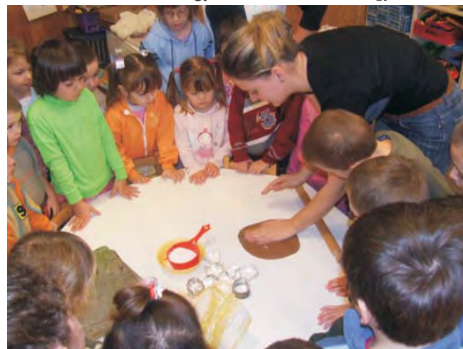
A közös sütést a "varázskézek" segítették az óvodában.